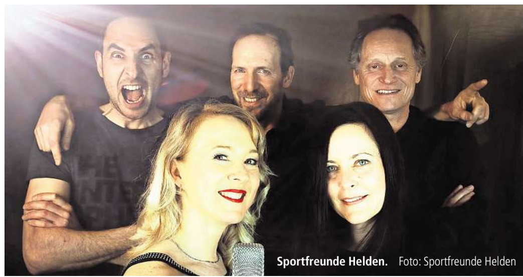
Sportfreunde Helden.

Viele weitere, spannende Neuigkeiten aus der lokalen Kulturszene finden Sie in der aktuellen Ausgabe unseres Partnermediums magaScene , monatlich frisch gedruckt und kostenlos an über 500 Auslegestellen in Hannover oder online auf www.magaScene.de inklusive Download-Möglichkeit.