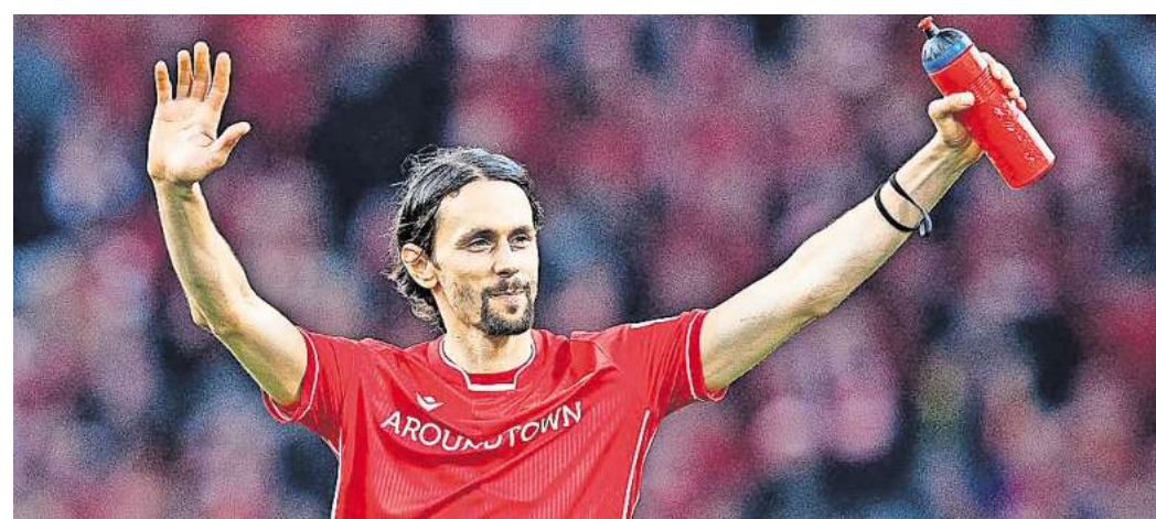
Im Union-Trikot: Neven Subotic wurde nicht nur in Dortmund, sondern auch in Berlin von den Fans gefeiert