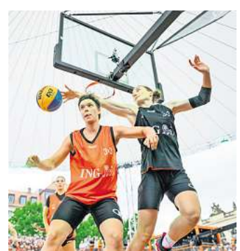
Spannende Spiele im 3x3-Basketball soll es wie hier in Dresden im nächsten Jahr auch in Hannover geben.

Speziell für diese Aufgabe ist nach Auskunft von Stadt und Region eine dreiteilige Ausbildung vorgesehen. Unterstützt