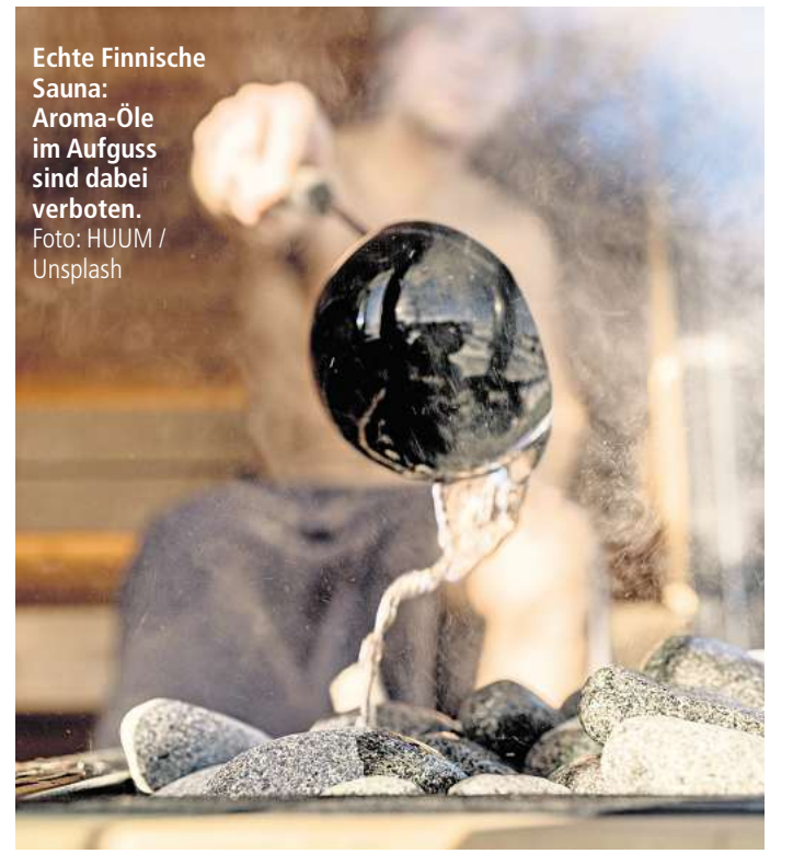
Echte Finnische Sauna: Aroma-Öle im Aufguss sind dabei verboten.

Ja, die finnische Sauna ist etwas sehr Demokratisches. Ein fester Stundenplan für einen Aufguss, wie es in Deutschland gibt, wäre in Finnland undenkbar, genauso wie die Sanduhr an der Wand. Oder dass man sich ein verrückt großes Handtuch mitbringen muss, auf dem man sitzt. Solche starren Regeln gibt es hier nicht. Während in Finnland einfach alle in der Sauna sitzen und sich entspannen, tritt in Deutschland ein sogenannter Saunameister in die Mitte und zieht die ganze Aufmerksamkeit auf sich. In dem Moment kriert