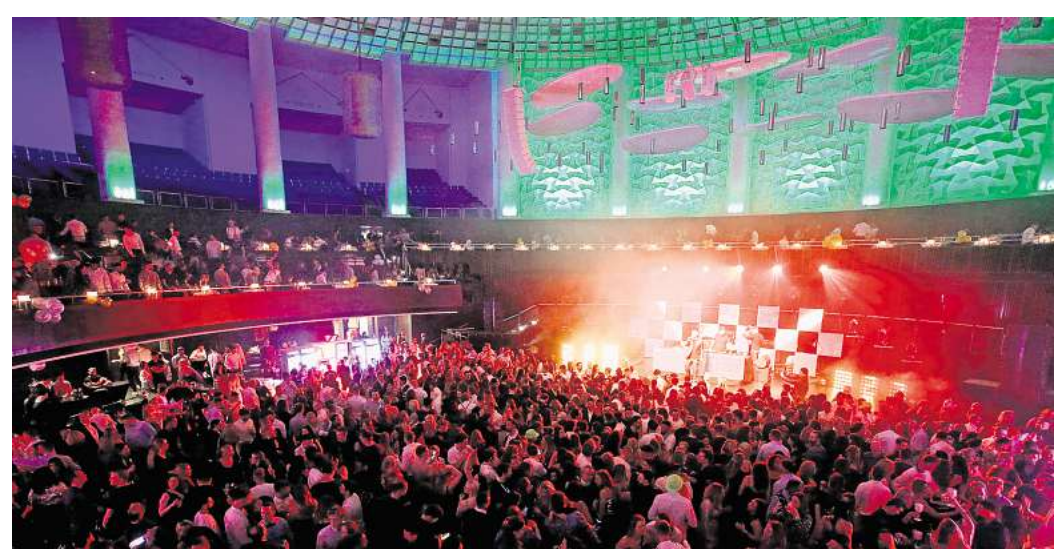
Bereits zum elften Mal steigt die große Silvesterparty im HCC.