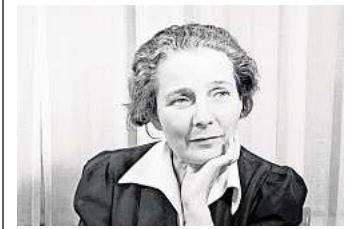
Eine Künstlerin wird wiederentdeckt: Käthe Steinitz.

HANNOVER. Das Sprengel Museum Hannover widmet der Künstlerin, Autorin und Kunstwissenschaftlerin Käthe Steinitz (1889–1975) erstmals eine umfassende Retrospektive. Unter dem Titel „Käthe Steinitz. Von Hannover nach Los Angeles“ werden bis zum 25. Januar 2026 rund 180 Werke aus sieben Jahrzehnten gezeitigt – darunter expressionistische Hinterglasbilder, Zeichnungen, Fotografien und Texte, die den Lebensweg der Künstlerin und ihr Schaffen und Wirken nachzeichnen. Erstmals werden zahlreiche fotografische Arbeiten präsentiert, die bislang nur als Negative überliefert waren. Begleitend zur Ausstellung erscheint im Hirmer Verlag eine Monografie. Sie ist Ergebnis eines Forschungsprojekts, das vom Niedersächsischen Ministerium für Wissenschaft und Kultur gefördert wird. Zudem vergibt die Landeshauptstadt Hannover erstmals den „Käthe Steinitz Preis für künstlerische Kollaboration“, der das vielseitige Schaffen der Künstlerin in die Gegenwart führt.