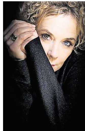
Schauspielerin Katja Riemann liest aus ihrem Debütroman.

Aber die Welt ist aus den Fugen: Ein Nebel bedeckt die halbe Welt, Feuersbrünste und Heuschreckenschwärme wüten. Aus Berlin flieht Johanne