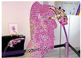
Teil der Ausstellung ist das Exponat „Nicht noch ein Stück“.