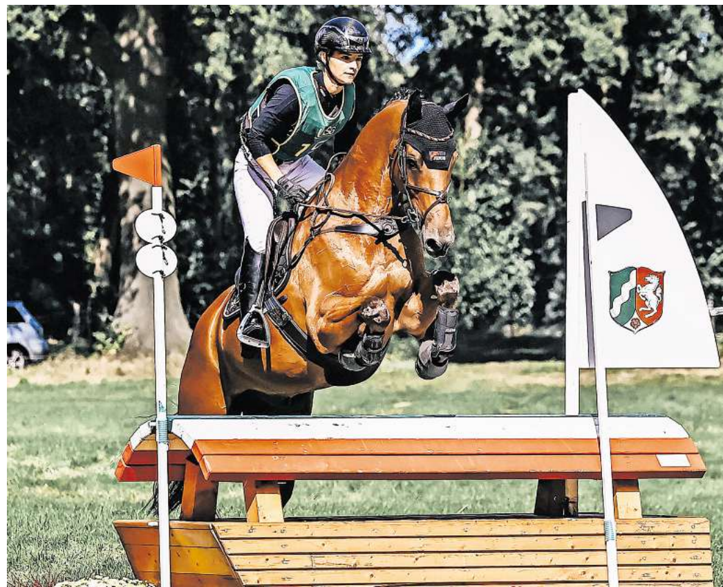
Stars des Spitzensports auf der Geländestrecke in Twenge: Julia Krajewski auf Ero de Cantraie.

Der Eintritt ist frei. Ein kulinarisches Arrangement am Springplatz lädt zum Verweilen ein. Den Anweisungen zur Turniersicherheit vor Ort ist Folge zu leisten. Für Hunde gilt strikte Leinenpflicht. Ein ehrenamtliches Team aus dem Verein für Vielseitigkeitsreiterei sorgt für einen reibungslosen Ablauf in einem landschaftlich grandiosen Ambiente. GG