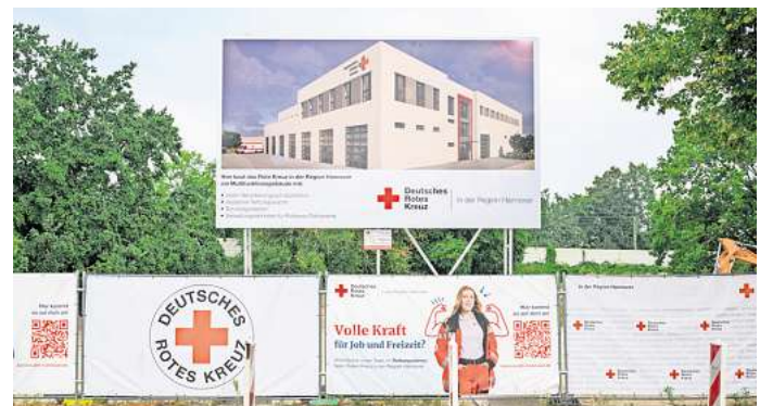
Soll Ende 2026 fertig sein: Das DRK bringt an der Zeißstraße 79 eine Rettungswache, die Verwaltung und ein Bevölkerungsschutzzentrum unter ein Dach.

Am 14. August war Grundsteinlegung, Ende 2026, spätestens Anfang 2027 soll die neue Rettungswache fertig sein. 60 Mitarbeitende im Rettungsdienst werden dort beschäftigt sein. Platz ist auch für drei Rettungswagen, einen Notfallkran-transporter und drei Krantransportwagen.