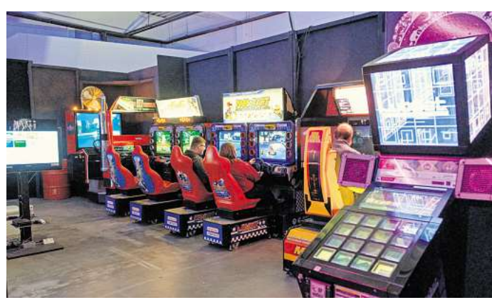
Besucher testen beim Senak Peak die Spielautomaten im Arcademuseum Hi-Score, das vom Aufhof in die Südstadt umgezogen ist.

Sommerrodelbahn und oder auf einem historischen Karussell ausstoben. Dazu können gibt es Dino-Figuren sowie das Drachenreich oder ein Märchenland bestaunen.