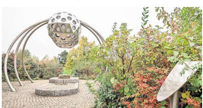
Das wohl bekannteste Kunstobjekt im Park der Sinne ist das Insektenauge. Für die Entwicklung benötigte Rimkus mehr als ein Jahr. Alle Teile sind gelasert, die Oberfläche ist elektroplottiert. Die Linien sind eine Spezialanfertigung.

3. Action im Erse-Park Action und riesige Dinosaurierfiguren warten im Erse-Park in Uetze. Hier können sich Kinder auf einer Wasserbahn, einer