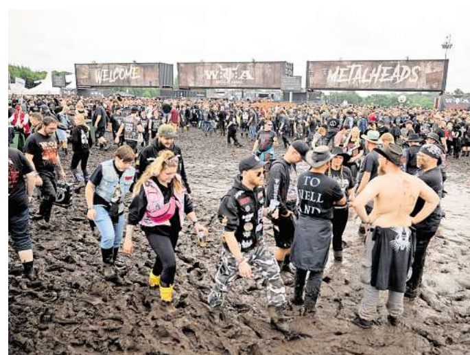
Schlamm Schlacht in Wacken: 2023 mussten Metal-Fans knöcheltief im Modder über das Gelände des größten Heavy-Metal-Festivals der Welt stapfen.

G wie Gummistiefel: Gummistiefel gehören in jedes Gepäck – viele machen daraus längst ein modisches Accessoire.