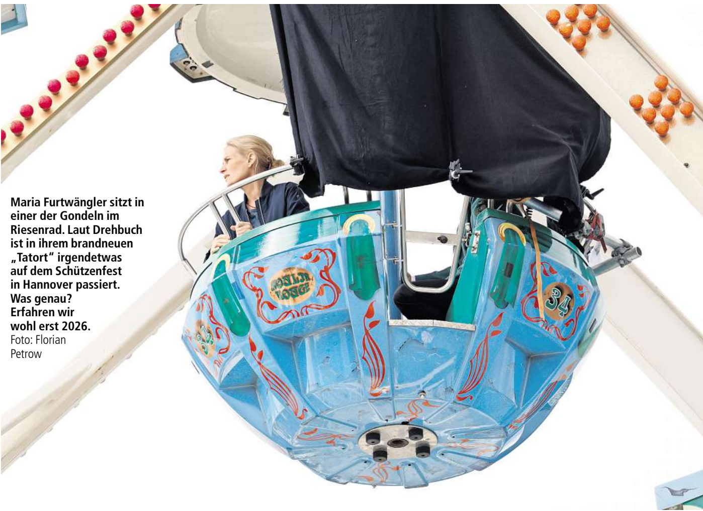
Maria Furtwängler sitzt in einer der Gondeln im Riesenrad. Laut Drehbuch ist in ihrem brandneuen „Tatort“ irgendetwas auf dem Schützenfest in Hannover passiert. Was genau? Erfahren wir wohl erst 2026.