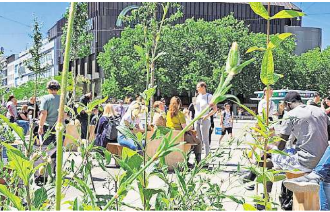
Begrünte Sitzplätze bieten Platz für eine Pause.

HANNOVER. Das Sprengel Museum, Kurt-Schwitters-Platz, setzt sich in der Ausstellung „Stand up! Feministische Avantgarde“ bis zum 28. September mit künstlerischen Positionen von feministischen Pionierinnen der 1970er-Jahre auseinander. Die Arbeiten aus der Wiener Sammlung Verbund – darunter Fotografien, Video-Arbeiten, Objekte und Zeichnungen – widmen sich der Konstruktion von Weiblichkeit. Sie untersuchen, was es bedeutet, eine Frau in den 1970er-Jahren zu sein, und entlarven Stereotype und Klischees. Die Künstlerinnen der Feministischen Avantgarde schufen erstmals in der Geschichte der Kunst radikal, subversiv und ironisch ein völlig neues „Bild der Frau“ aus weiblicher Perspektive. Im Jahr 2025 sind die Themen dieser künstlerischen Frauenbewegung noch immer aktuell. Die Schau, die bereits in Rom, Madrid, London