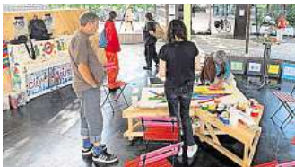
Bei der Sommerlounge gibt es einen Offenen Plakat-Workshop.

Zuschauen – ist jeweils montags ab 19 Uhr. Die Bahnhofsmision veranstaltet dienstags von 12 bis 14 Uhr ein offenes Bingo, das alle Generationen verbindet. Der Verein der Swing Tanz Kultur Hannover spielt Swing-Musik und lädt ein, in der Sommerlounge entspannt ins Wochenende zu tanzen oder einfach nur Musik zu genießen, am 18. Juli ab 19 Uhr. Mittwochs stehen ab 18 Uhr Internationale Tänze für alle zum Mitmachen auf dem Programm, donnerstags von 11 bis 12 Uhr Tischtennis – Schläger und Bälle gibt es vor Ort.