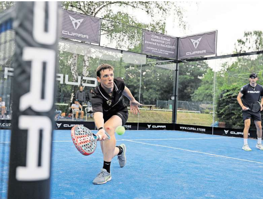
Im Trend: Padel-Tennis erfreut sich zunehmender Beliebtheit.

auf dem Platz zu treffen und zu bewegen. Im Winter lud eine Kunststoff-Eislauffläche dazu ein, Kreise auf Kufen zu ziehen.