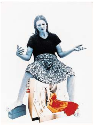
Valie Export: „Die Geburtenmaddonna“, 1976. Farbfotografie.

und zuletzt in der Staatsgalerie Stuttgart gezeigt wurde, ist in fünf thematische Bereiche gegliedert: das Aufbegehren