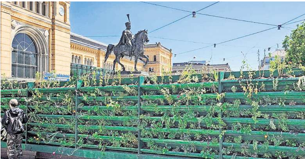
„Unterm Schwanz“ wird es grün: Vor dem Hauptbahnhof Hannover lädt der Bahnhofsgarten wieder zu zahlreichen Veranstaltungen ein.