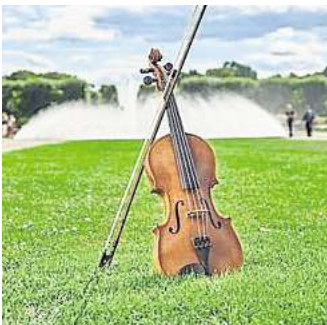
Barocke Spiele, Märchen und Musik sind in der „Sonntags“-Reihe im Garteneintritt enthalten.

los Kinderspiele funktionieren. Studierende der HMTMH präsentieren einstündige Konzerte auf der Probenbühne, jeweils ab 12 und ab 14 Uhr. Am 31. August ist ein Duo mit Gitarre und Flöten zu hören, am 14. September spielt mit „Bridges of Brass“ ein Blechbläser-Ensemble, und am 28. September treffen sich E-Piano und Trompete. RED