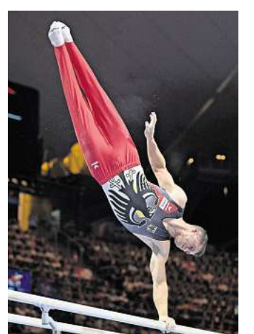
Körperbeherrschung pur: Lukas Dauser in Aktion.

Die Tourneedaten für Hannover: 31. Dezember 2025; 17 Uhr; ZAG Arena / 17. Januar 2026; 14