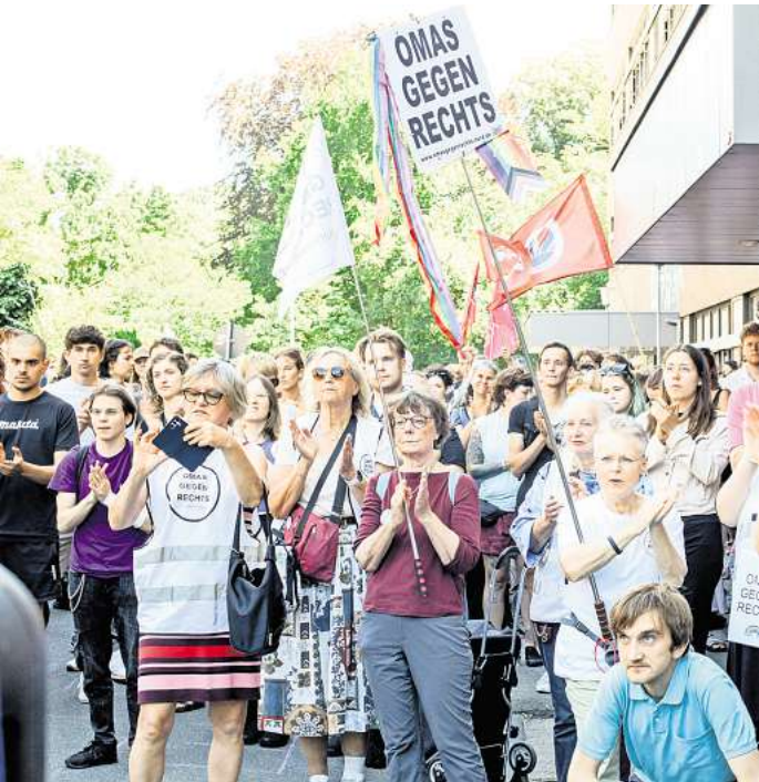
Die Unileitung hat den ASTA kurzfristig aufgefordert, den Elchkeller zu räumen. Zu einer Solidaritätsbekundung kamen rund 300 Personen zu einer eilig organisierten Demonstration zusammen.

Die Uni hat die Kellerräume in den Siebzigerjahren dem ASTA