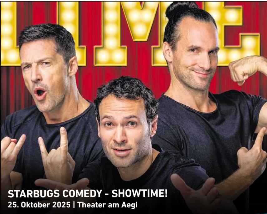
STARBUGS COMEDY - SHOWTIME! 25. Oktober 2025 | Theater am Aegi