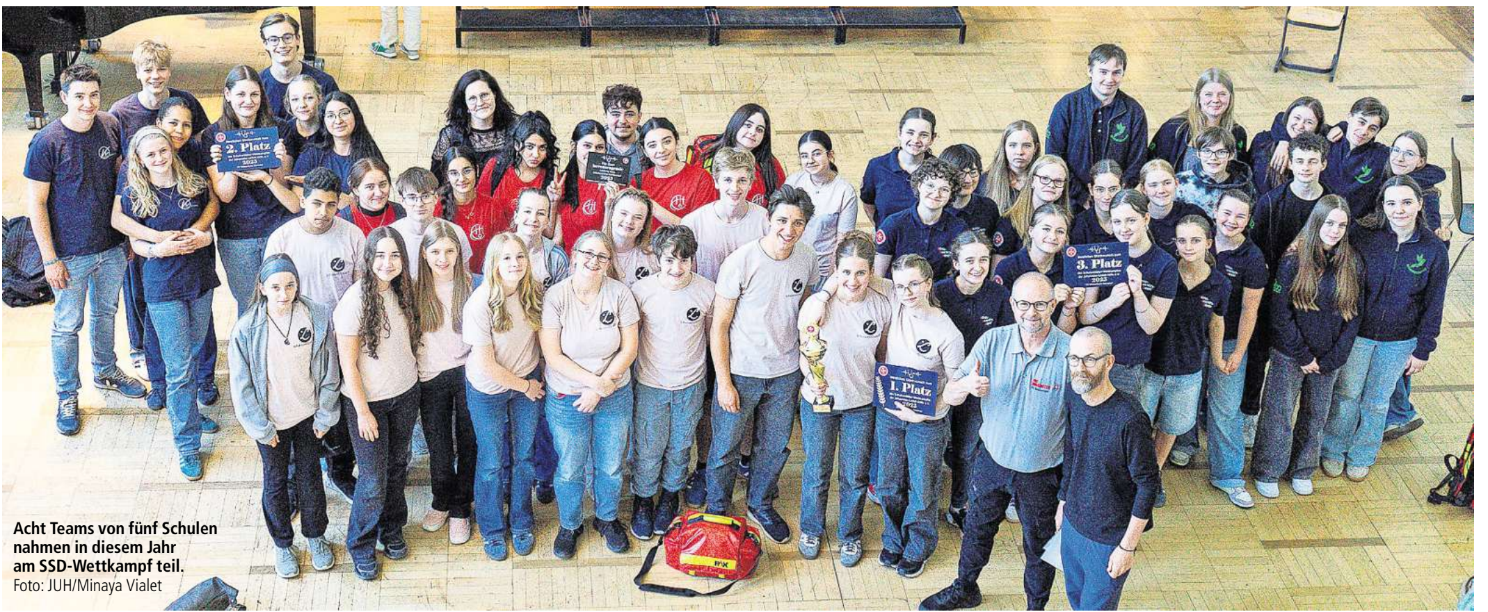
Acht Teams von fünf Schulen nahmen in diesem Jahr am SSD-Wettkampf teil.