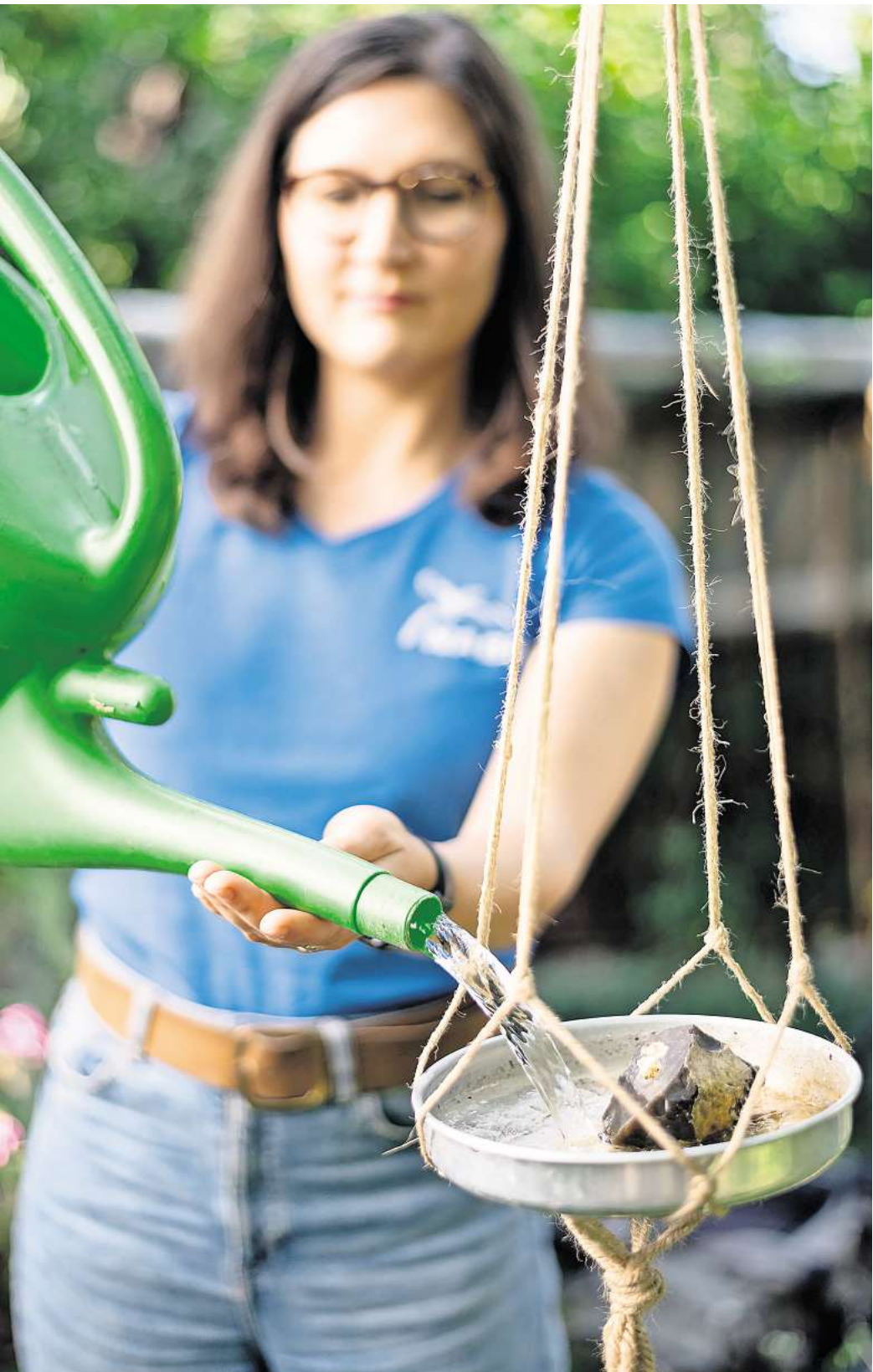
Naturnah Gärtnern: Wasserstellen sollten Tieren Ausstiegsmöglichkeiten geben, zum Beispiel kleine Steine.

Mit diesen einfachen Maßnahmen lässt sich schon auf kleinstem Raum ein wichtiger Beitrag leisten, damit heimische Tierarten die heißen Sommerwochen unbeschadet überstehen. Jeder Quadratmeter zählt – ob Balkon, Terrasse oder Garten – um in Zeiten zunehmender Trockenheit neue Oasen für die Natur zu schaffen.