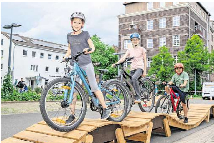
Die Region schult Hunderte Grundschulkinder im Fahrradfahren.