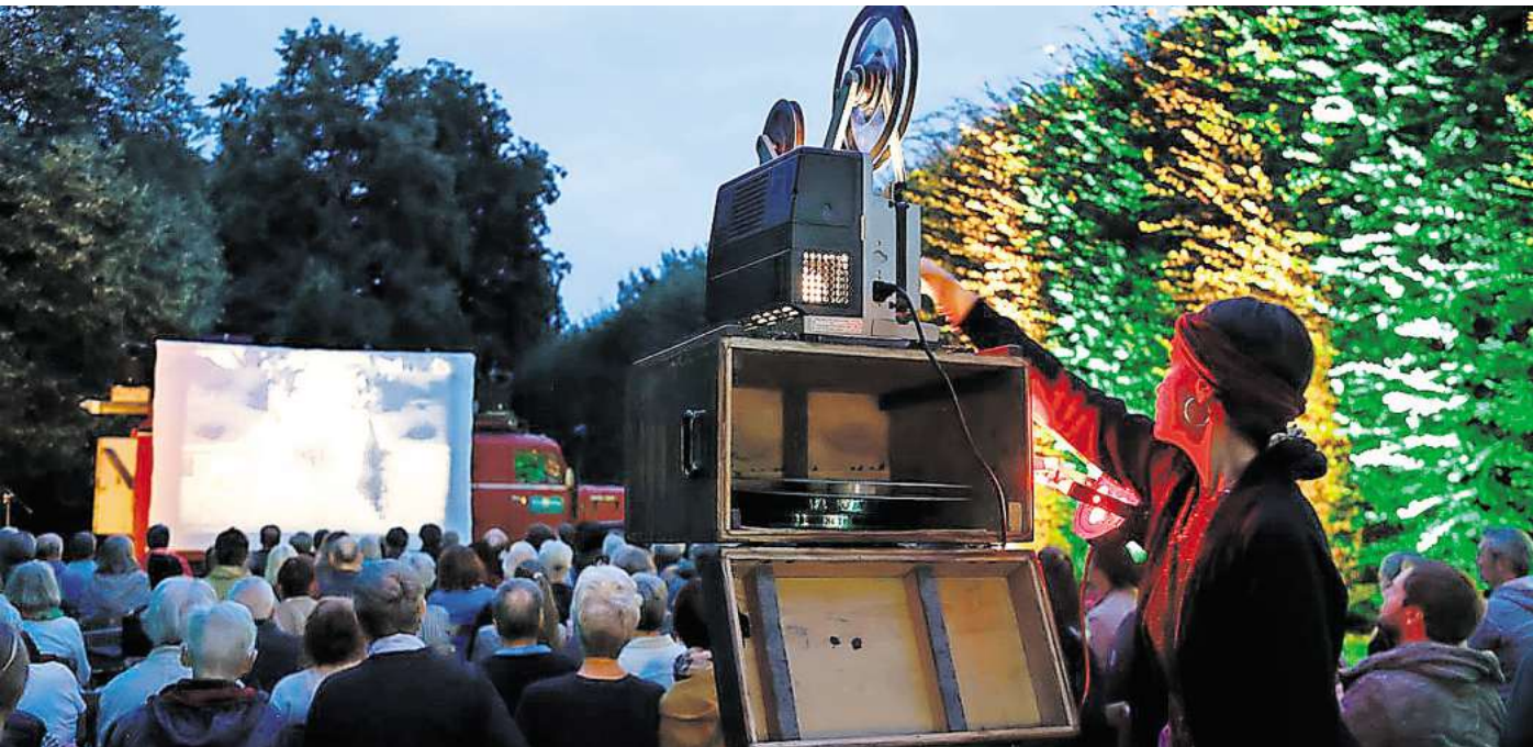
Wanderkino unter freiem Himmel: Am Schloss Landestrost werden Stummfilme gezeigt.