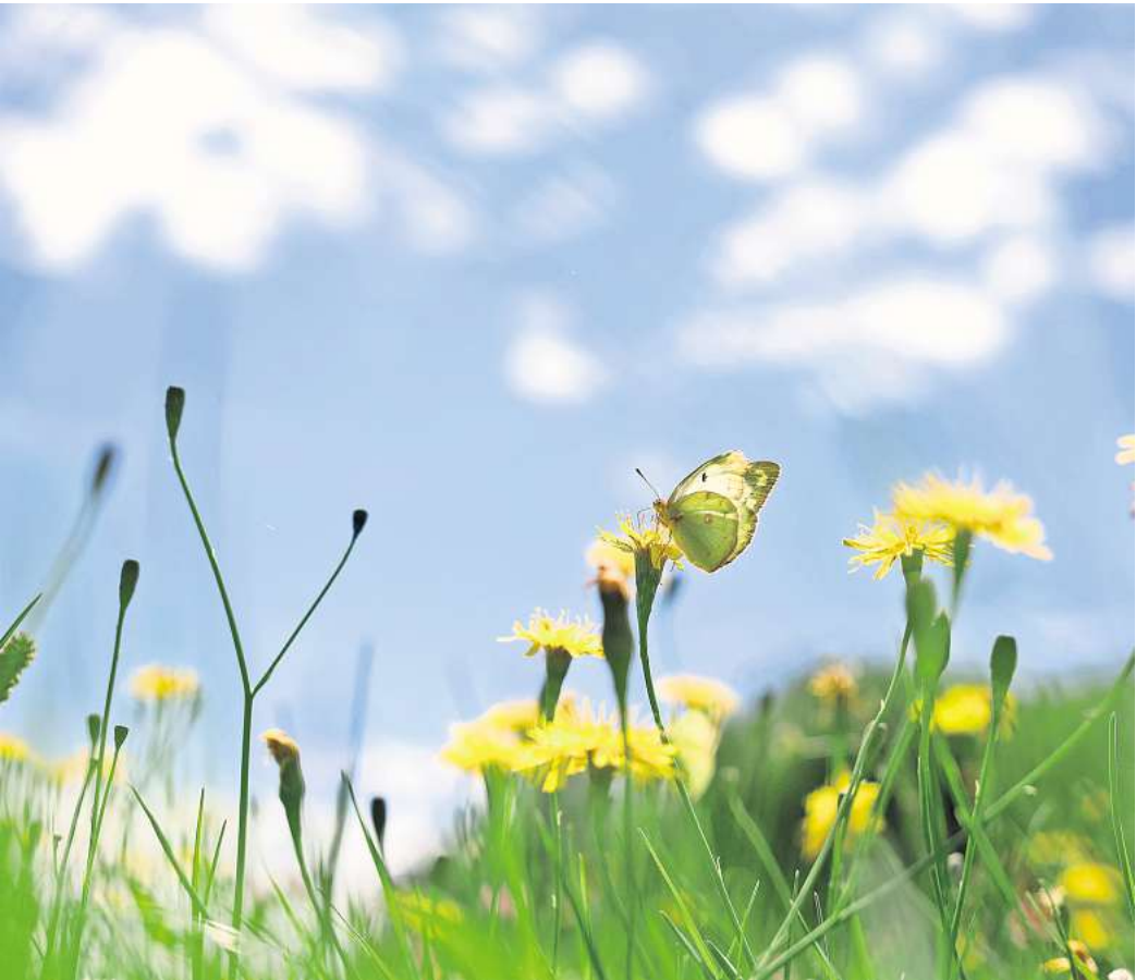
Ein Weißklee-Gelbling sitzt auf einer Blumenwiese auf einer Blüte.

Und noch einen Vorteil haben Wiesen mit hohem Gras: Sie speichern Feuchtigkeit besser und schützen den Boden vor dem Austrocknen. So fühlen sich Regenwürmer, Springschwänze und Asseln wohl, was die Bodenqualität verbessert. Und dadurch müssen Gartenfreunde seltener gießen.