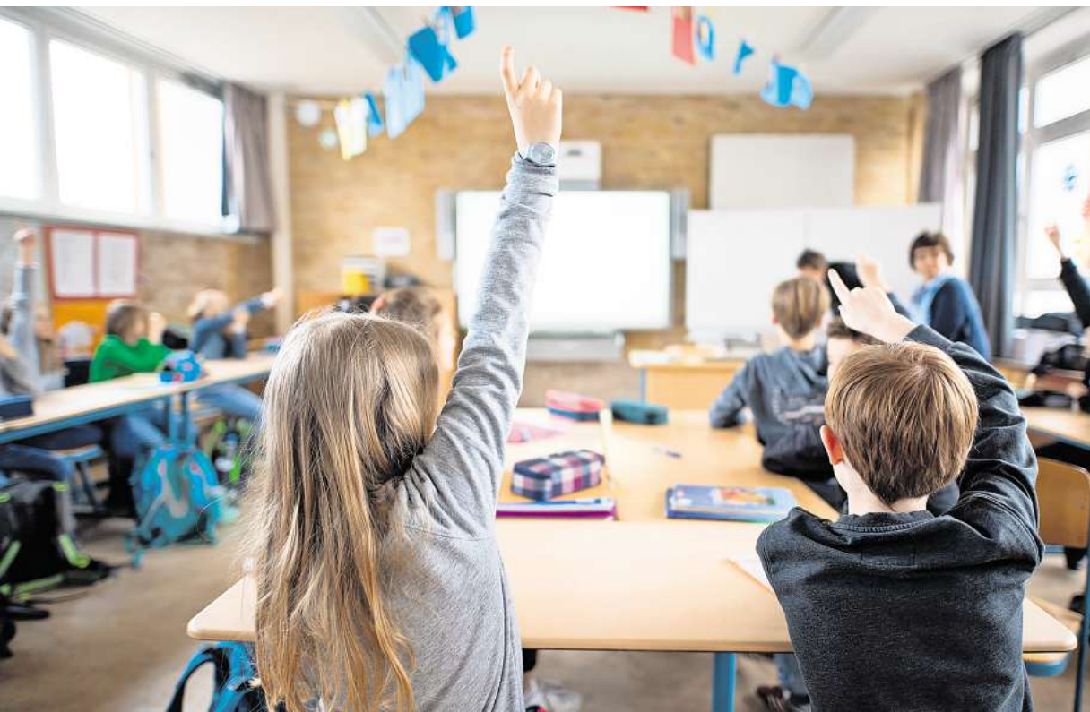
Die 62 städtische Grundschulen, der Primarbereich an der Integrierten Gesamtschule (IGS) Roderbruch, der Glockseeschule und der Südstadtschule bieten Platz für bis zu 22.100 Schülern.

Aber in Not kommt die Stadt nicht, denn die 62 städtische