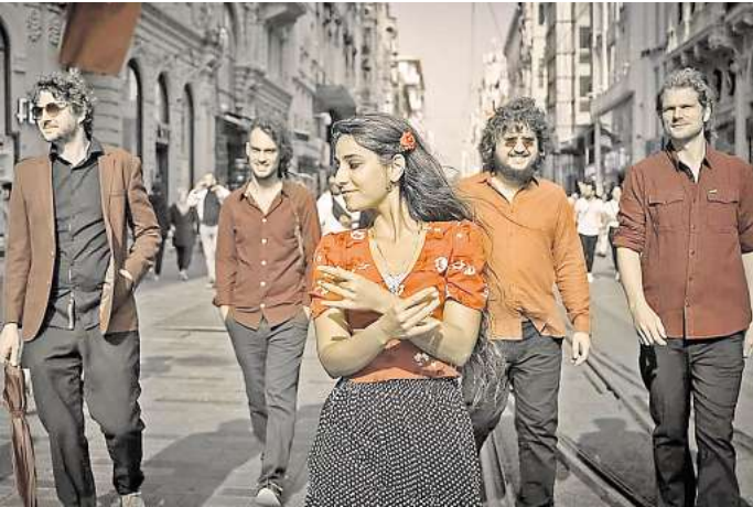
Light In Babylon treten am 29. Juni auf.