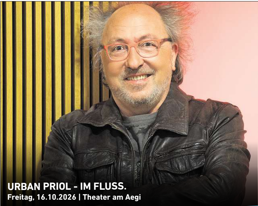
URBAN PRIOL - IM FLUSS. Freitag, 16.10.2026 | Theater am Aegi