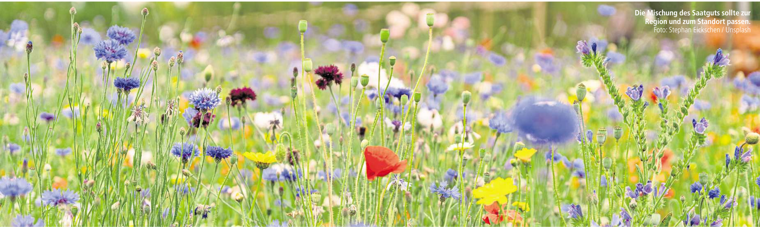
Die Mischung des Saatguts sollte zur Region und zum Standort passen.