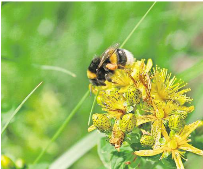
Eine blühende Wiese bietet Insekten Nahrung.

von Jahr zu Jahr dichter. Überhandnehmende Arten kann man dann etwas ausdünnen. Die Wiese sollte man ansonsten möglichst nicht betreten. Nur einmal im Jahr muss man sie mähen – am besten im Frühjahr mit einer Sense statt mit einem Rasenmäher.