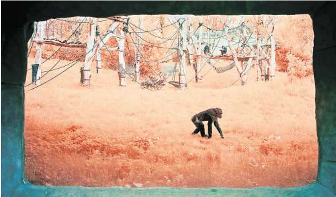
Tom Wesse fotografierte für „Natur /Konstrukt / Mythos“ unter anderem im Leipziger Zoo.

Geöffnet ist die Ausstellung in der GAF, Seilerstraße 15 d, täglich von 12 bis 20 Uhr. Der Eintritt ist frei. RED