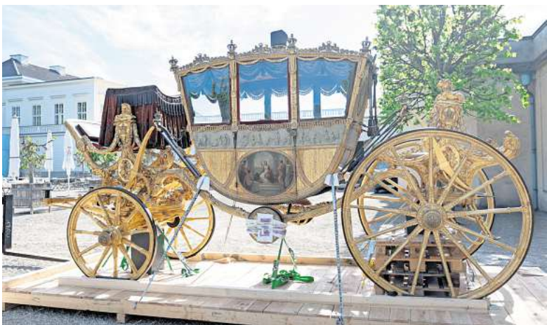
Die goldenen Kutschen, stets von vielen Besuchern in der großen Kutschenhalle des Museums bewundert, zeigt die Stadt künftig im Schlossmuseum Herrenhausen.

Eines der beliebtesten Ausstellungsstücke des Museums wird in etwa drei Wochen der Öffentlichkeit präsentiert. Die goldenen Kutschen, stets von vielen Besuchern in der großen Kutschenhalle des Museums bewundert, zeigt die Stadt künftig im Schlossmuseum Herrenhausen. Vor einigen Wochen sind die Prachtkarossen der Welfen in einem Lastwagen von der Altstadt nach Herrenhausen transportiert worden.