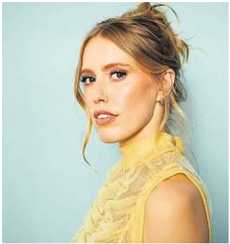
LEA gastiert heute auf der Waldbühne Northeim.

Tickets gibt es unter www.livingconcerts.de . Zur Waldbühne fährt ein Shuttlebus vom Bahnhof Northeim.