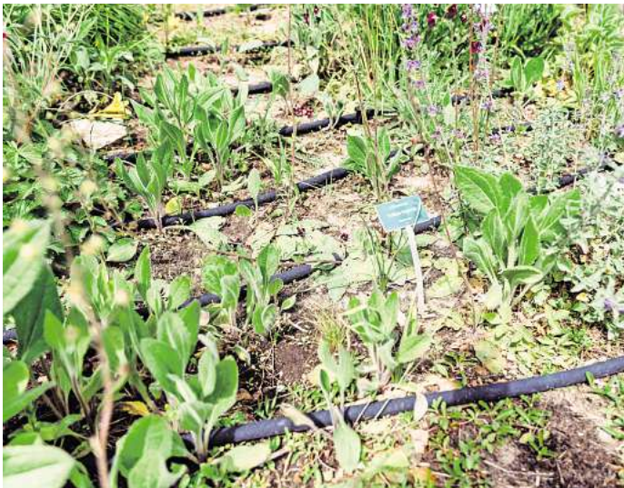
Tröpfchenschläuche bewässern gezielt am Boden, ohne Wasser zu verschwenden.

Doch nicht nur auf die richtige Bewässerung kommt es an. „Sonne und Wind sind die größten Feinde“, betont Guldner. „Der offene Boden trocknet schnell aus.“ Eine dichte Bepflanzung oder Rindenmulch auf der Erde könne dagegen helfen – auch im Garten zu Hause. „Die Pflanze schützt den eigenen Boden“, erklärt der Gärtnermeister.