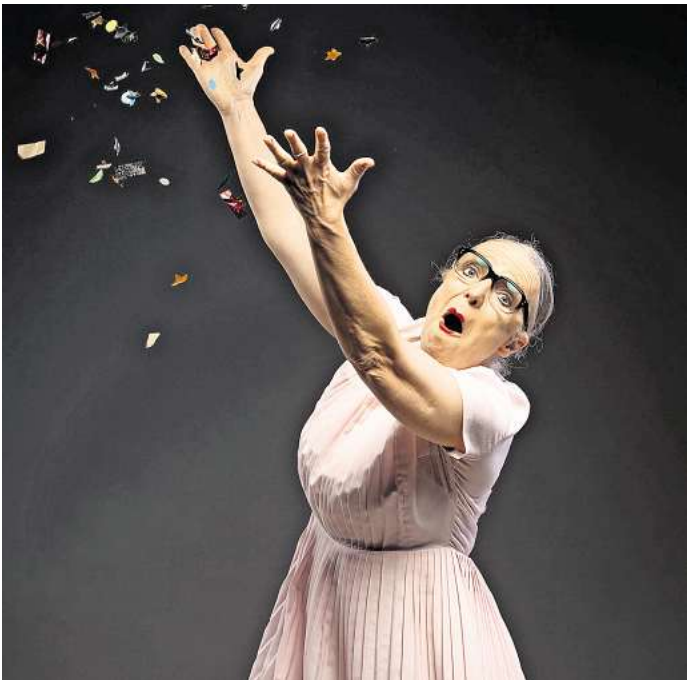
Rosemie ist "die pure Lebensfreude".

Die Tourneedaten für Hannover: 31. Dezember 2025; 17 Uhr; ZAG Arena / 17. Januar 2026; 14 und 19 Uhr; ZAG Arena. Weitere Infos und Tickets: www.feuerwerkderturnkunst.de