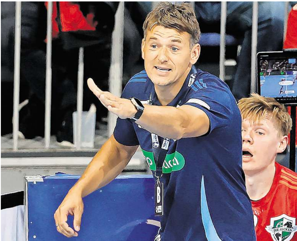
Gestikulierte von der Seitenlinie aus und gibt die Richtung vor: Recken-Coach Christian Prokop.

Nein, wir haben schulpflichtige Kinder und meine Frau ist Lehrerin. Wir bleiben erstmal in Hannover und werden kleine Ausflüge planen. Ich freue mich auf die Gartenarbeit. (lacht) Ob es dann zu Ferienstart eventuell nach Südtirol oder Portugal geht, steht noch nicht ganz fest.