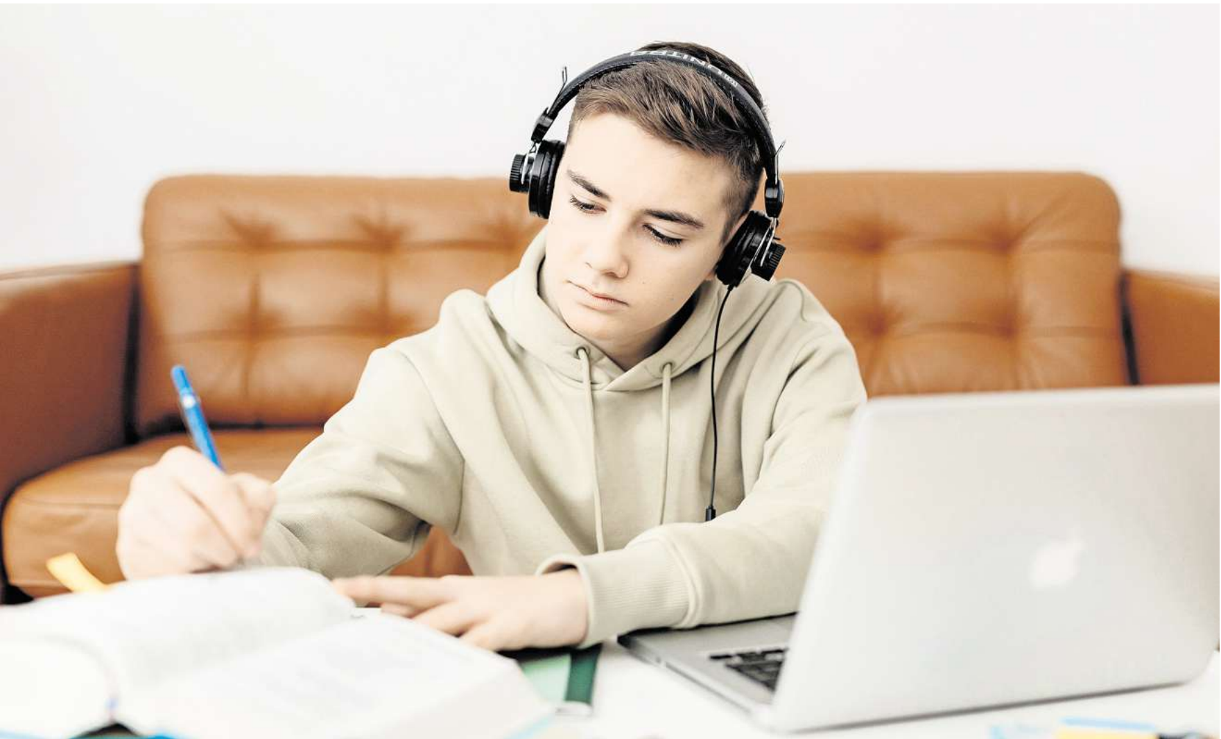
Jeder zweite Jugendliche lernt mit YouTube für die Schule.