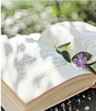
Im Großen Garten findet wieder das Lesepicknick statt.

hochgeladen werden. Anschließend werden sie online von Fachleuten geprüft. Die besten Beiträge werden im September vom Verband Botanischer Gärten ausgezeichnet. So ist es nicht nur ein spielerischer Wettbewerb, sondern soll dazu beitragen, das Bewusstsein für die Vielzahl an Lebewesen zu schärfen, die mit