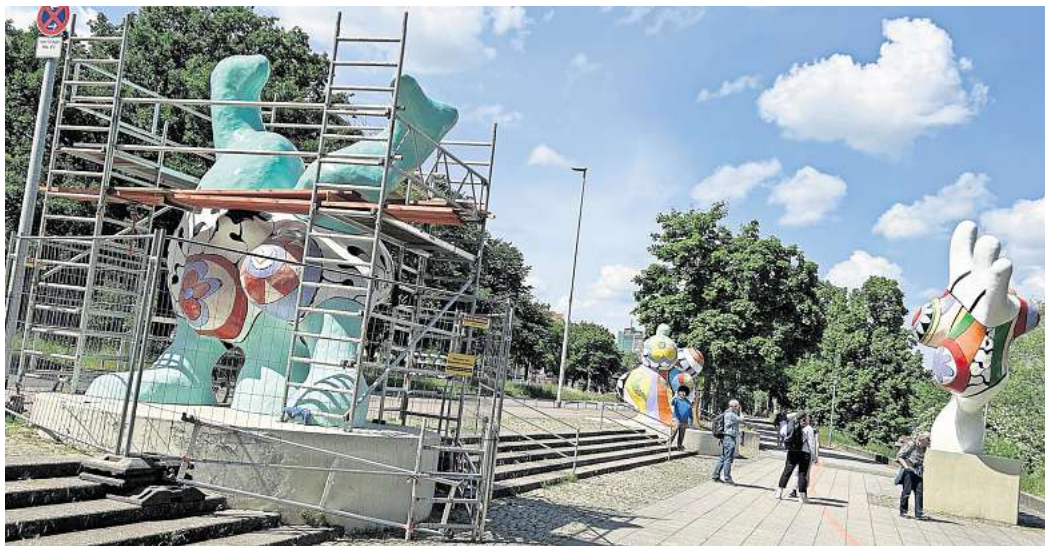
Die Stadt macht die Nanas am Hohen Ufer wieder hübsch.

Die Dauer der Arbeiten sind nach Angaben der Stadt abhängig nach Aufwand und sind abhängig von der Witterung. „Bis Ende Juni sollten die Arbeiten aber abgeschlossen sein“, so die Stadt. Die Gesamtkosten belaufen sich auf rund 35.000 Euro.