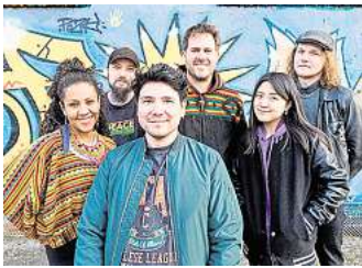
Live: Peace Development Crew

Energie und mitreißenden Büh-nepresenz bringt sie den karibi-schen Groove mit viel Bass und Elektronik in die Stadt. Gesungen und gerappt mit deutschen, eng-lischen und spanischen Texten, liefert die Band tanzbaren Roots Reggae ab, der gerne auch mal durch Ska, Jungle, Dub, Hip Hop, Latin und Dancehall schweift. Der letzte Standort für Mobi Rick ist dann vom 19. bis 22. Juni, jeweils von 15 bis 18 Uhr, auf dem Dor-mannplatz. Der Eintritt ist frei, die Teilnahme ohne Anmeldung möglich. R/H/R