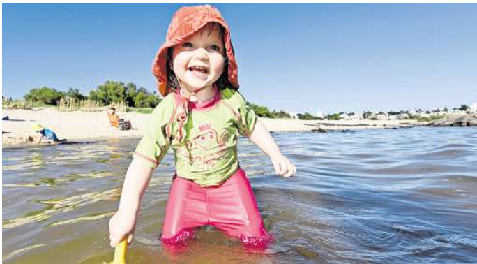
Vorsicht ist alles: Eltern sollten sich bei der Aufsicht ihrer Kinder nie ablenken lassen.

Wasser fällt. Selbst das wenige Zentimeter tiefe Wasser am Ufer eines Sees kann dann lebensgefährlich sein. „Kinder können auch in einem kleinen Gartenteich oder in einem Pool mit 20 Zentimetern Wassertiefe ertrinken, wenn sie mit dem Gesicht