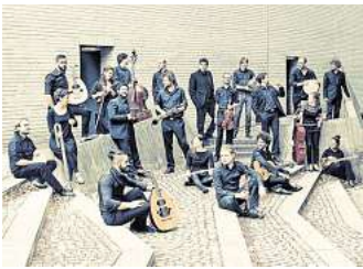
Asamura Ensemble

Friedrich Händel. Im Hofsaal präsentiert das Flex Ensemble Werke von Mozart und Brahms, danach gibt es unter anderem vierhändiges Klavierspiel nach Samuel Barber vom Duo Ion-Yilmaz und Bach-Interpretationen der Hannoverschen Hofkapelle (20 Uhr). „Transkulturelle Bach-Neudeutungen zu Klangmosai-ken“ stehen auf dem Programm des Asamura Ensemble, das Klassik weiterdenkt und unter Berücksichtigung kultureller Zugehörigkeit und Diversität neu und innovativ erlebbar machen