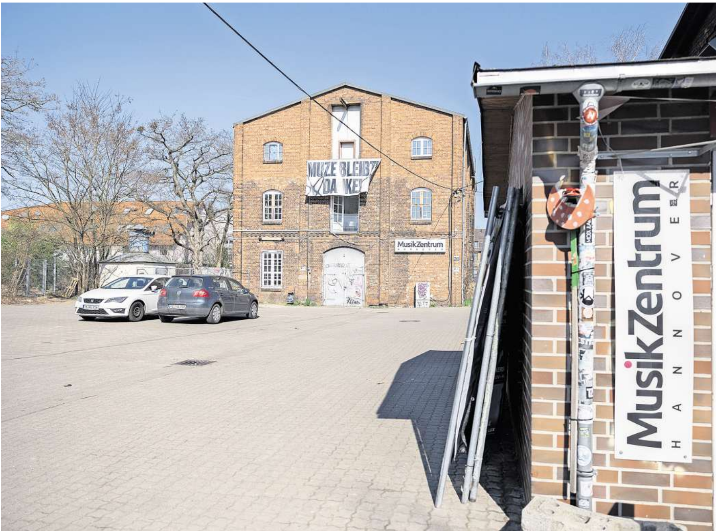
Gewerbe, Kultur und Wohnungen: So will die Stadt das Quartier rund ums Musikzentrum voranbringen Eine Studie im Auftrag der Stadt beschreibt, wie das Areal rund um das Musikzentrum entwickelt werden kann.

► 4. Leben im Quartier: Für Studierende gibt es ein Wohnheim