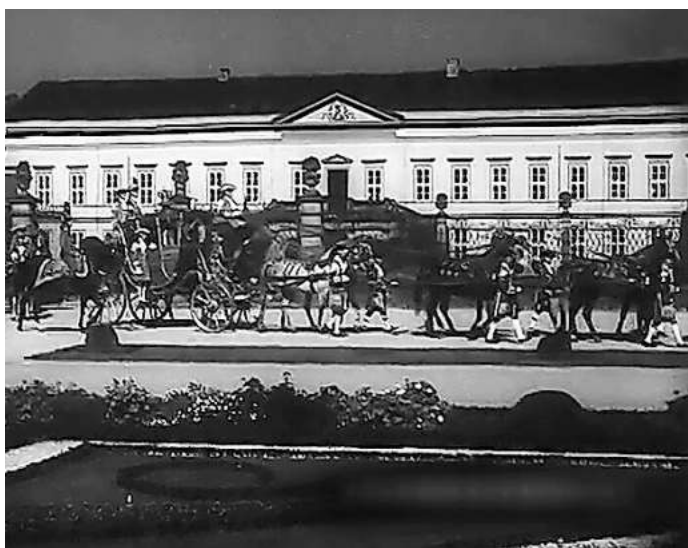
Vor dem Schloss: Welfenkutschen rollen durch Herrenhausen.

Karten für den Herrenhausen-Filmabend gibt es im Kino im Künstlerhaus in der Sophienstraße. Präsentiert werden die drei Herrenhausen-Filme dort am 28. Mai um 18 Uhr von Peter Stettner.