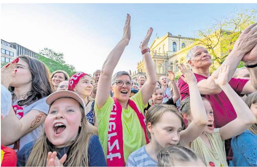
Fröhlicher Kirchentag: Hannover sammelte als guter Gastgeber Punkte.

Dieses Gefühl spiegelt einen Lokal-, vielleicht eher noch Fatalpatriotismus, der einen hin- und herreißt zwischen Provinzfürstentum und Metropolenselbstverständnis, zwischen Kleinstadtenthusiasmus („Komm schnell, wir sind im Fernehen!“) und Landeshauptstadtlässigkeit („Wir haben immer gewusst, dass wir es können“). Symptome: mitfiebern, wenn einer aus Uetze bei Günter Jauch auf dem Quizstuhl sitzt. Feiern, wenn Popstars wie Tokio Hotel öffentlich Lüttje Lage trinken oder wie Phil Collins vor 20 Jahren 96-Jacken auf der Bühne tragen. Und dann ist da dieses ständige Zittern vor Vergleichslisten. Den sogenannten Städterankings. Die gibt es in seriösen und auf repräsentativen Umfragen oder verlässlichen Daten basierend, die gibt es aber auch zusammengelahen aus „Usermeinungen“, wie heute etwas beschönigend das Wiederkäuen