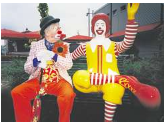
Jeremy Deller, Performance: „Has The World Changed or Have I Changed?“, Expo2000, Hannover

nähern. In allen Beiträgen ist das Spielerische zentral. Francis Alys dokumentiert Kinderspiele weltweit. Peter Fischli und David Weiss präsentieren mit „Der Lauf der Dinge“, ursprünglich für die documenta 8 gedreht, eine humorvoll inszenierte Kettenreaktion, die zu einem Meilenstein der Videokunst des 20. Jahrhunderts wurde. Während Ryan Gander eine animatronische Maus herumknabbern lässt, erschafft Rivane Neuenschwander