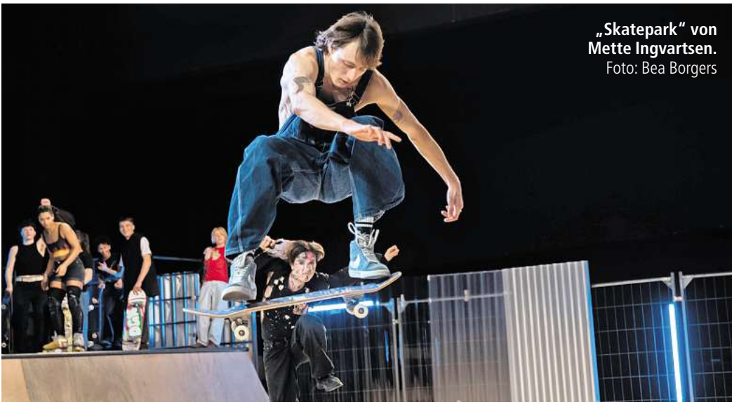
„Skatepark“ von Mette Ingvartsen.

rin Elisabeth Klinck. Zusammen lassen sie sphärischen Soundlandschaften zwischen Klassik und Pop entstehen. Gotopo (7. Juni, 21 Uhr) werbt in ihrer Musik und ihren provokanten Shows folkloristische Saiteninstrumente mit techno-inspirierten Jams.