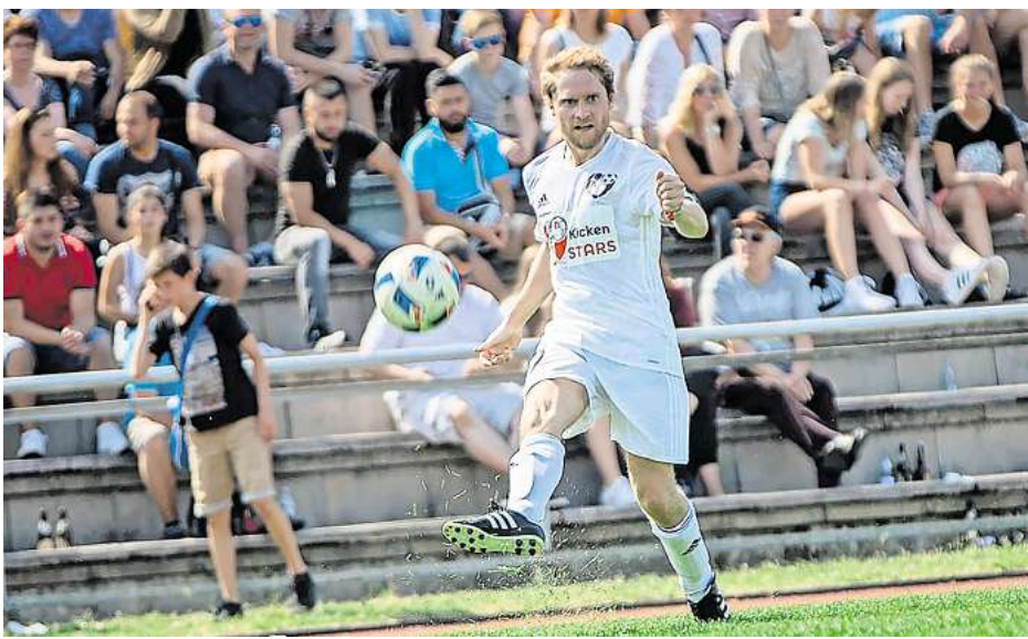
Musiker Johannes Oerding beim Kicken mit Stars 2016 in Holzminen.