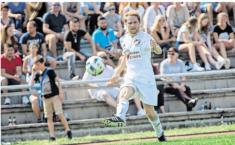
Musiker Johannes Oerding beim Kicken mit Stars 2016 in Holzminden.