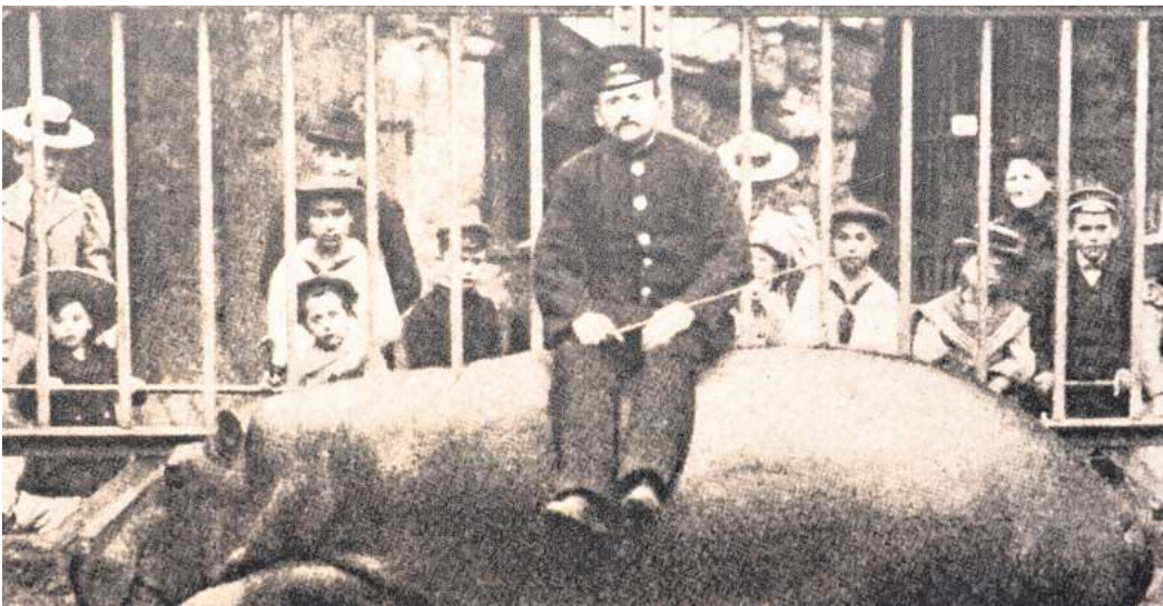
Eine Ausstellung beleuchtet die Geschichte des Zoos.

Im Ausstellungsgebäude des Zoos ist außerdem fortlaufend die Bilderschau „160 Jahre Zoo: gestern-heute-morgen“ zu sehen. Dort erfahren Interessierte allerlei Wissenswertes – zum Beispiel, dass es anfangs in dem Tierpark eine „Verlobungsbrücke“ gab. Auf der konnten sich Liebespaare laut Casdorff „offiziell oder auch heimlich“ das Eheversprechen geben.