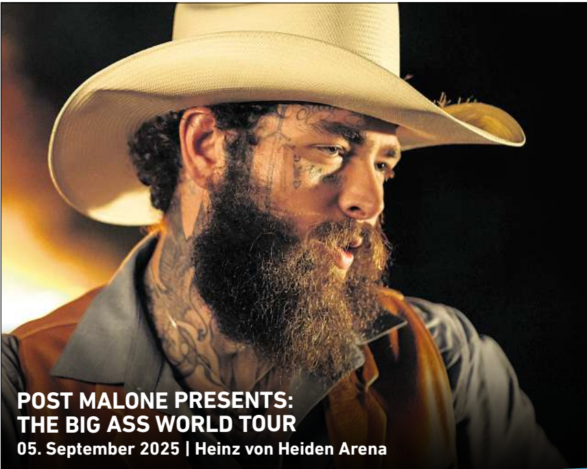
POST MALONE PRESENTS: THE BIG ASS WORLD TOUR 05. September 2025 | Heinz von Heiden Arena

HANNOVER. Der Große Garten, Alte Herrenhäuser Straße 1, wird wieder stimmungsvoll beleuchtet. Zur einstündigen Illumination erklingt die „Wassermusik“ von Georg Friedrich Händel, während Hecken und Figuren in einem anderen Licht erstrahlen und die Fontänen sprudeln. Die nächsten Termine sind am Sonnabend, 10. Mai, ab 22 Uhr, und 20./21. Juni, ab 22 Uhr. Einlass ist ab jeweils ab 20 Uhr, der Eintritt kostet 6 Euro, ermäßigt 4 Euro.