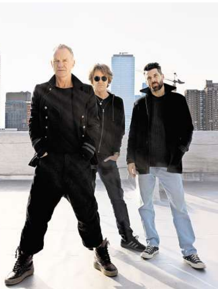
Weltstar Sting kommt zum Plaza Festival Kombitickets kosten 116,99 Euro. Je nach Art der Ticketbestellung (VVK-Stelle, Telefon, Internet) können zusätzliche Gebühren für Bearbeitung und Versand hinzukommen. Die Tickets berechnen zur Nutzung der öffentlichen Verkehrsmittel an den Veranstaltungstagen im Bereich des Großraum-Verkehrs Hannover (GVH). Kinder von 3 bis 6 Jahren erhalten freien Eintritt.