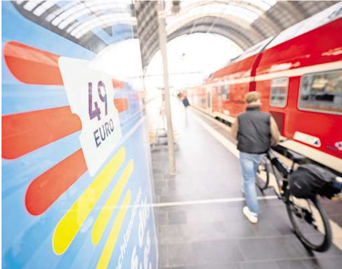
Erfolgsmodell 49-beziehungsweise jetzt 58-Euro-Ticket: Mindestens 13,5 Millionen Menschen nutzen derzeit das Ticket, das als Nachfolger des erfolgreichen 9-Euro-Tickets im Mai 2023 für 49 Euro an den Start ging.