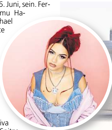
Badmómzjay ist bei der N-Joy Starshow dabei.

vals am Freitag, 6. Juni, sein. Ferner werden Samu Haber, Bosse, Michael Schulte, Alice Merton und Sophie Grey mit kompletten Sets dabei sein. Das Future Bass DJ-Duo „The Chainsmokers“ und Deutschlands Superstar Ayliva stehen an der Spitze der N-JOY Starshow am Samstag, 7. Juni. Zudem komplettieren Badmómzjay, Sophia, Esther Graf sowie der N-JOY Resident-DJ „Alle Farben“ das Line Up am Samstag. Tagestickets für das NDR 2 Plaza Festival am Freitag, 6. Juni, und die N-JOY Starshow sind jeweils für 67,49 Euro bei Hannover Concerts (0511/12 12 33 33, hannover-concerts.de ), www.eventim.de und an allen Vorverkaufsstellen zu haben.