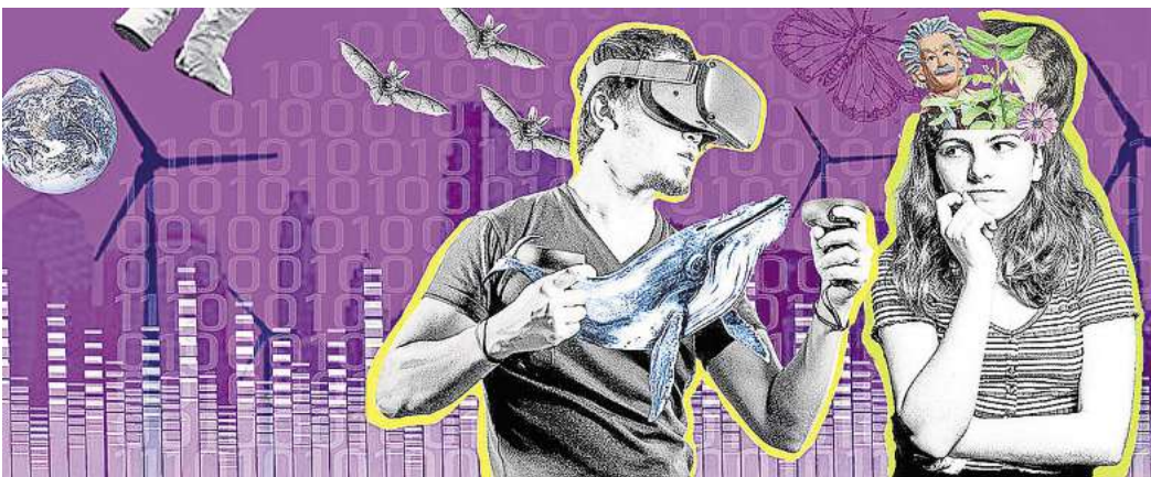
Mitforschen, mitdenken, mitgestalten: In zahlreichen wissenschaftlichen Projekten können sich im Rahmen der Citizen Science Bürgerinnen und Bürger einbringen. Grafik: LUH

Für das Forschungsprojekt „Hollywood Memories: Remaking und die Konstruktion globaler Filmgenerationen“ am Englischen Seminar der LUH werden Filmbegeisterte gesucht, die mit Hilfe eines Fragebogens und gegebenenfalls im Rahmen eines Gruppeninterviews über ihre Filmereinerungen sprechen möchten, über ihre