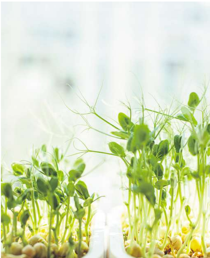
Microgreens: Kleine Vitaminpakete, die auch auf der Fensterbank wachsen.

Square-Foot-Gardening: Eine beliebte Technik ist unter anderem das Square-Foot-Gardening: Hier wird das Beet in