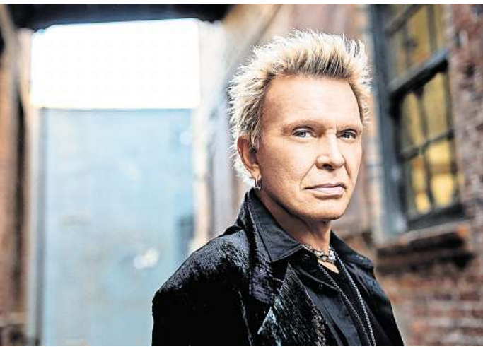
Billy Idol rockt am 18. Juni auf der Waldbühne Northeim