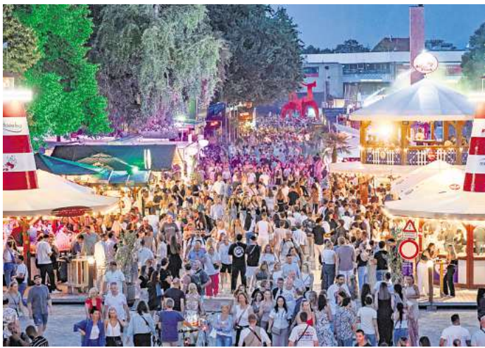
Die großen Gastronomen der Maschseefeste bis 2027 stehen fest.

Das „Belmondo“: Es bietet französische Küche in einem mediterranen Ambiente – eine Mischung zwischen Pariser Größen und Charme der Côte d’Azur, so die HVG. Auf der Speisekarte stehen zum Beispiel