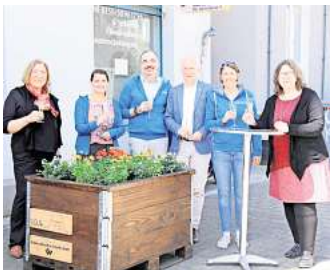
Die erste Pflanzkiste der IDG wurde aufgestellt.

zept der Pflanzkisten wurde als am schnellsten und einfachsten umzusetzen bestimmt. Die Kisten sind mobil auf Europaletten installiert und werden von der Vahrenheider Werkstatt gebaut, die eine Tischlerei und eine Gärtnerei unterhält. Als Aufstellflächen bieten sich gepflasterte Vorgärten privater Hand an, nun sucht die I.D.G. nach weiteren Plätzen für die Pflanzkisten in Döhren, verbunden mit einer Partnerschaft für die Bepflanzung und Bewässerung. Eine Bepflanzung ist individuell möglich und gewünscht, Partner und Sponsoren können mittels Plakette auf der Kiste verewigt werden. Interessierte können unter ido@hannover.de Kontakt aufnehmen. Die I.D.G. hofft, dass die Pflanzkiste von den Döhrenern als eine Art Initiator wahrgenommen wird und daraus weitere Ideen und Initiativen entspringen. RED