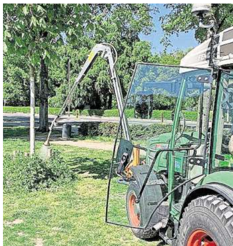
Mit der neuen Gießtechnik können in kürzerer Zeit mehr Stadtbäume bewässert werden.

Neben der Gießtechnik wurde auch das gesamte Bewässerungsmanagement optimiert und digitalisiert: Zu den gärtnerischen Erfahrungen über die Bewässerung kommen auch Daten von etwa 420 Bodenfeuchte-Sensoren und Wettervorhersagen zum Einsatz. Diese Daten dienen als Steuerungsinstrument, um die Bewässerung gezielt und ressourcen-