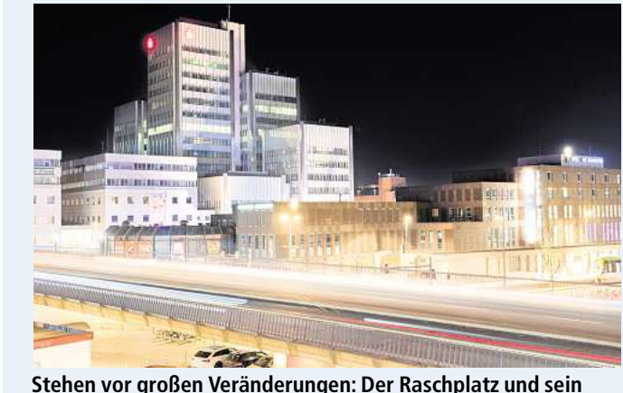
Stehen vor großen Veränderungen: Der Raschplatz und sein Umfeld.