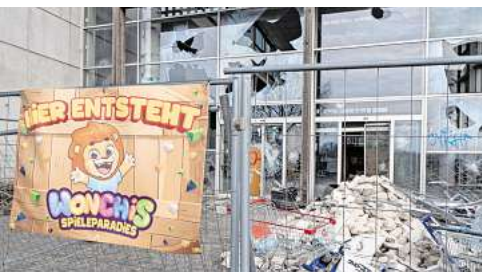
Auf dem Expo-Gelände soll im maroden türkischen Pavillon „Wonchis Spieleparadies“ entstehen.

Nun bekommt das Expo-Gelände einen Indoor-Spielplatz für Kinder. Für den Pächter offenbar