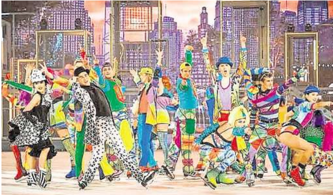
Holiday on Ice zeigt „Horizons“.

Alle Termine und Tickets: holidayonice.com/de/