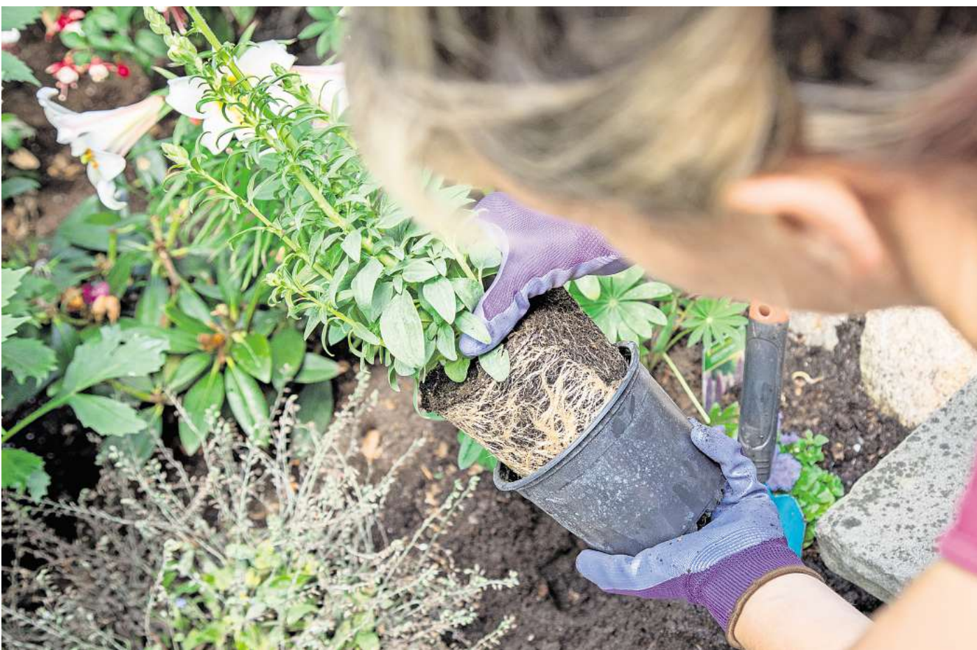
Der Kontakt mit Pflanzen und Erde lenkt vom Alltagsstress ab – und Erfolgserlebnisse erhöhen das Wohlfühlgefühl.

Mit allen fünf Sinnen im gegenwärtigen Moment präsent zu sein, entspannt nicht nur, es sorgt auch für beeindruckende Umbaumaßnahmen im Gehirn. Schon nach wenigen Wochen achtsamer Praxis schrumpft das Angstzentrum, die Amygdala. Dafür wachsen jene Areale, die für Gedächtnis, Mitgefühl und Kreativität zuständig sind. Nicht umsonst kommen einem beim Jäten manchmal schöne Erinnerungen oder die allerbesten Ideen. Diese kognitiven Effekte können sogar vor dem geistigen Abbau im Alter schützen. Eine