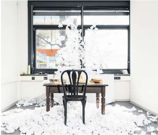
Rauminstallation der Künstlerin Saki Mizukoshi in der Ausstellung „Relikt“.

Sie sind im Gebäude „Seilbahn“ (1. OG rechts) der Hochschule Hannover, Lissabonner Allee 1, zu sehen. Geöffnet ist am Wochenende von 12 bis 18 Uhr, am Montag von 14 bis 19 Uhr bei freiem Eintritt. Am Montag, 14. April, gibt es ab 14 Uhr einen Rundgang durch die Ausstellung mit den Studierenden und der Kulturlissenschaftlerin Dr. Carolin Scheler. RED