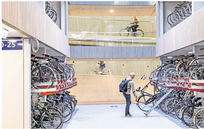
Mögliches Vorbild: ein unterirdisches Fahrradparkhaus in Utrecht, Niederlande, mit über 13.000 Stellplätzen.

Ob tatsächlich ein riesiges Fahrradparkhaus unter dem Raschplatz errichtet wird, ist nicht sicher. Baudezernent Vielhaber findet die Idee „super“. Denkbar sei aber auch, dass unter dem Deckel Räume für den Einzelhandel entstehen. Öffentliche Flächen sollte es dort aber nicht geben.