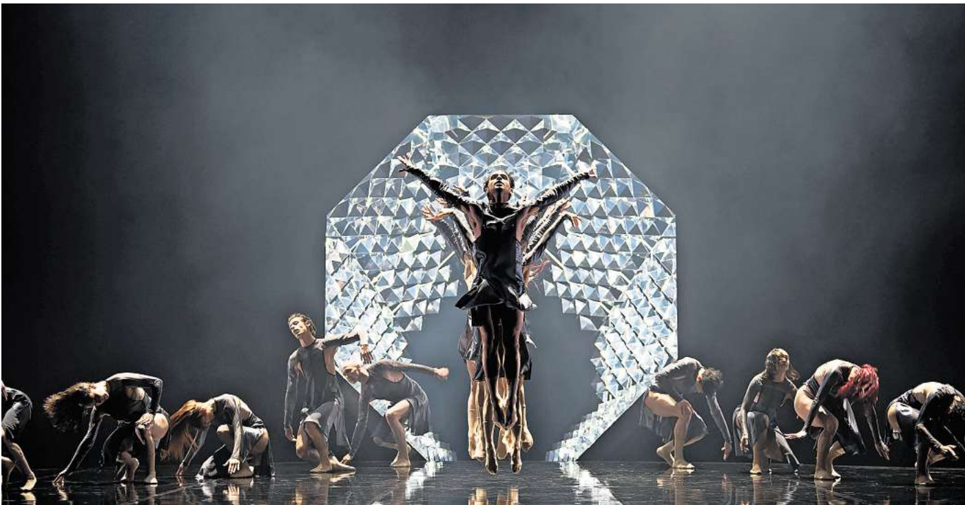
Das Staatsballett Hannover zeigt „Ikarus“.