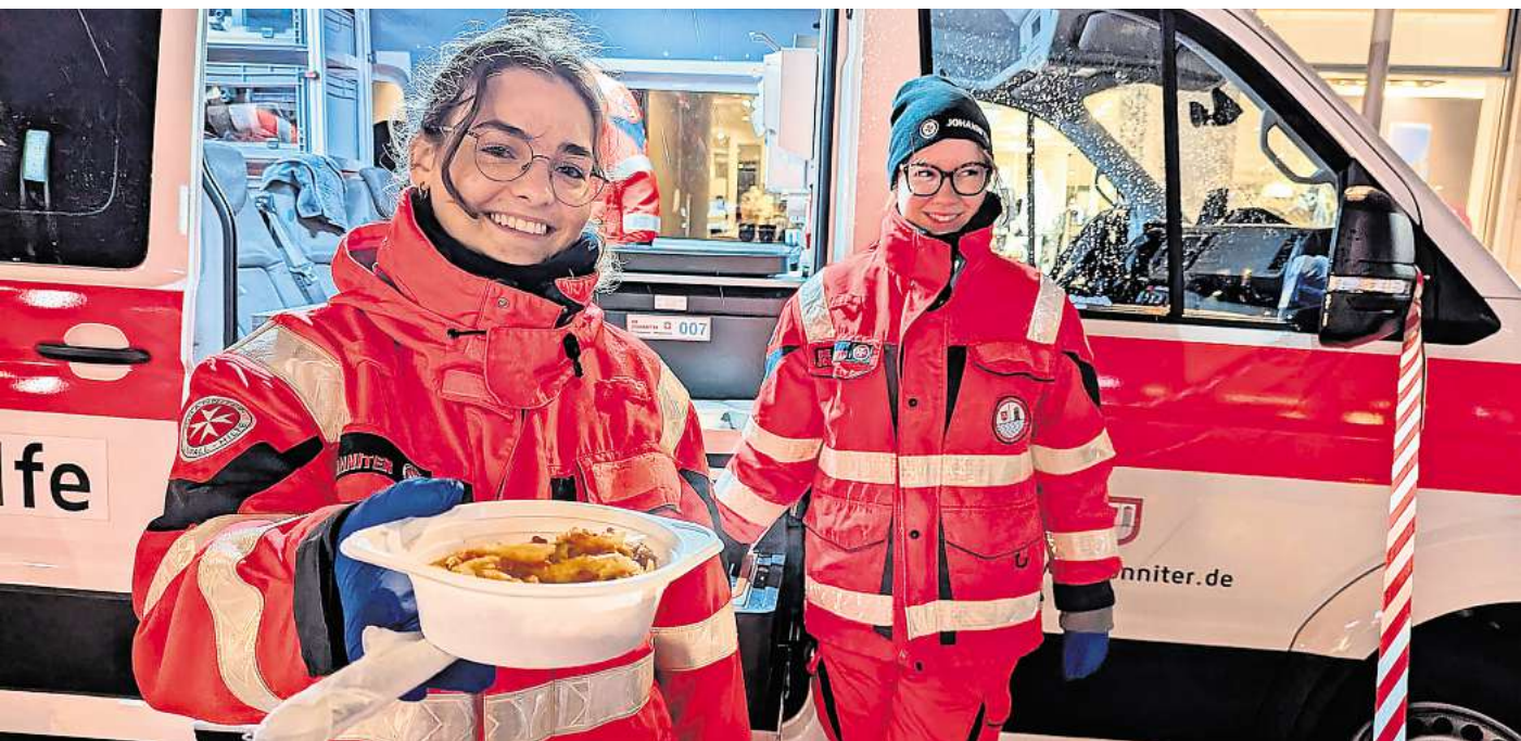
Überreichen eine warme Mahlzeit: die ehrenamtlich Helfenden der Johanniter-Kältehilfe.