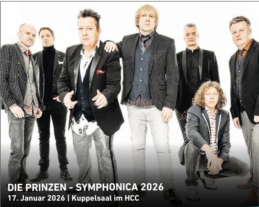
DIE PRINZEN - SYMPHONICA 2026 17. Januar 2026 | Kuppelsaal im HCC

HANNOVER. „Wir feiern Ostern!“ heißt es am Dienstag, 15. April, in der Stadtbibliothek, Hil-desheimer Straße 12 (1. Etage). Kinder ab vier Jahren sind von 16 bis 18 Uhr willkommen bei Spielen in entspannter Atmosphäre und Kreativ-Aktionen. Die Teilnehmenden können lustige Fotos mit dem Greenscreen aufnehmen, und natürlich wird fleißig gebastelt. Der Eintritt ist frei. RED