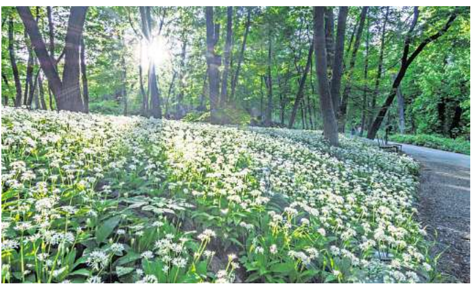
Blühender Bärlauch: Die beliebte Pflanze hat giftige Doppelgänger.

Je nach Region wuchert eher die eine oder andere Pflanze. „Bärlauch braucht kalkige Böden“, sagt Martina Merz, Autorin eines Wildkräuter-Kochbuchs. „Dagegen wächst Wunderlauch auch dort, wo kein Kalk ist.“ Allerdings: die leckeren Blätter dürfen nicht mit ihren giftigen Doppelgängern verwechselt werden, die parallel sprießen. Beim Bärlauch sind das Aronstab, Herbstzeitlose und Maiglöckchen. Die Blätter des Wunderlauchs wiederum ähneln denen des Blausterns.