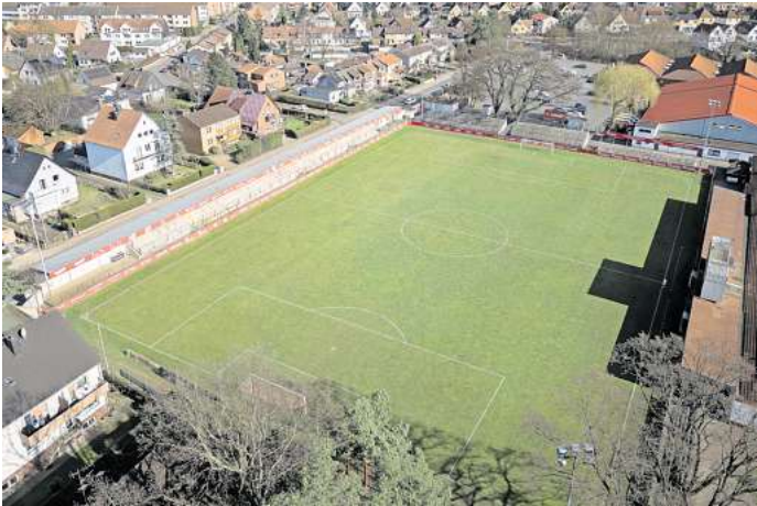
Das Wilhelm-Langrehr-Stadion soll für 10 Millionen Euro tauglich für die 3. Liga gemacht werden.