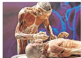
Ein Herzchirurg bei der OP.