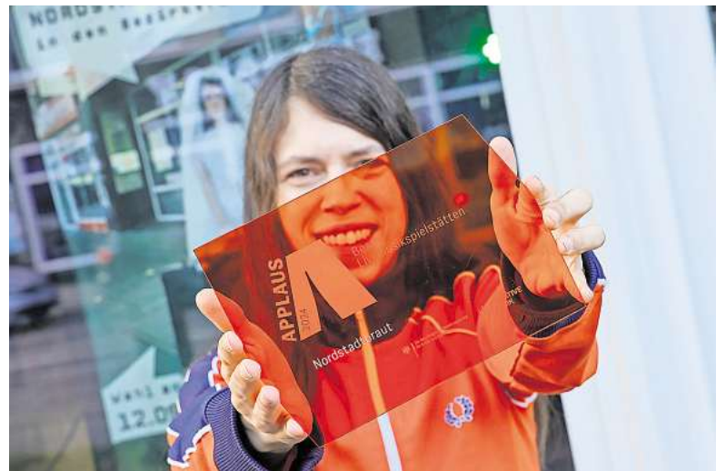
Da war die Welt noch in Ordnung: Die Nordstadtbraut gewinnt im November 2024 den mit 30.000 Euro dotierten Applaus Award für die Beste Livemusikspielstätte. Doch drei Monate später erfolgte die Kündigung.

► Wer Hinweise auf mögliche Räumlichkeiten in der Nordstadt hat, in denen auch Livemusik gespielt werden kann, kann sich gerne unter clemens.niehaus@wochenblaetter.de melden.