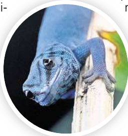
Neu im Zoo: Himmelblauer Zwerggecko

stützt“, erzählt Mitglied Christian Wagner. Um auf die weltweit bedrohliche Situation für die kleinen Reptilien aufmerksam zu machen, wurde der Gecko 2024 zum Zootier des Jahres ernannt. Für den Zoo Hannover war das der Anstoß, Vertreter dieser Art zu beschaffen. Die Tiere stammen von einem privaten Halter. In Zukunft sollen die Geckos Teil eines Zuchtprogramms sein und dabei helfen, Besucher des Zoos für die Bedrohung der Geckopopulation zu sensibilisieren.