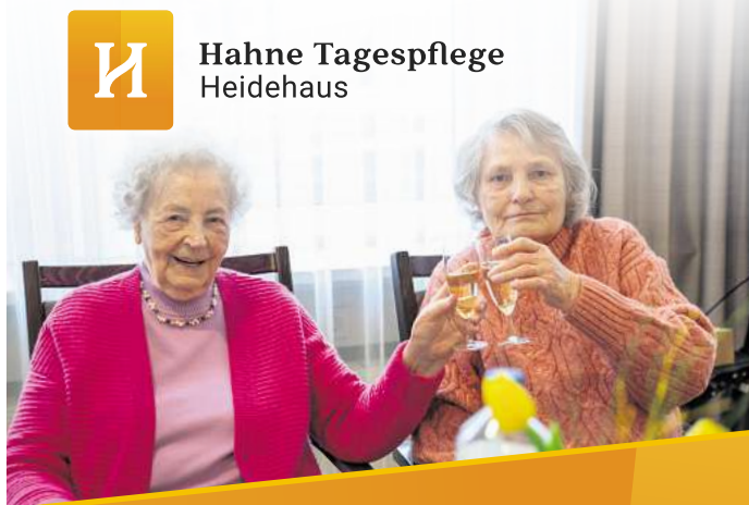
H Hahne Tagespflege Heidehaus

Das varierende Line-up der Schlagnacht des Jahres sowie alle Termine können über die Webseite www.schlagnacht.de , die zugehörigen Social-Media-Kanäle als auch über die Schlagnacht-APP abgerufen werden.