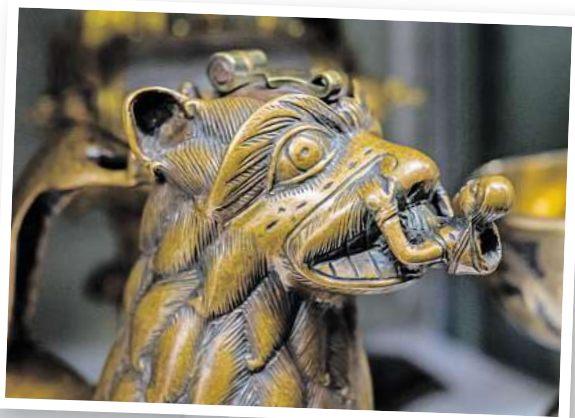
Ein Türzieher aus der Marktkirche.