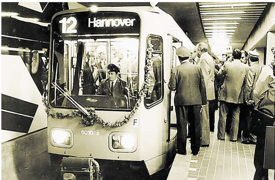
26. September 1975: Die Station unter dem Hauptbahnhof wird feierlich eröffnet.

Die Ursprünge des Großen Gartens reichen ins Jahr 1675 zurück. Herzog Johann Friedrich wollte den Gutshof seines Vaters zu einer Sommerresidenz umwandeln. Entstanden war zunächst ein Lustgarten. Weiterentwickelt wurde er dann während der Amtszeit von Kurfürst Ernst August. Seine Frau, Kurfürstin Sophie, gestaltete den Garten. Orientierung boten dabei holländische Barockgärten. Die Kurfürstin hatte ihre Jugend in Holland verbracht. Bis 1714 entwickelte sich so der Große Garten in seiner heutigen Form und Größe: Ein regelmäßiges Rechteck begrenzt durch einen künstlichen Wassergraben und Baumreihen. Erst 1936 wurde der Garten von der Stadt Hannover erworben und so der Öffentlichkeit zugänglich.