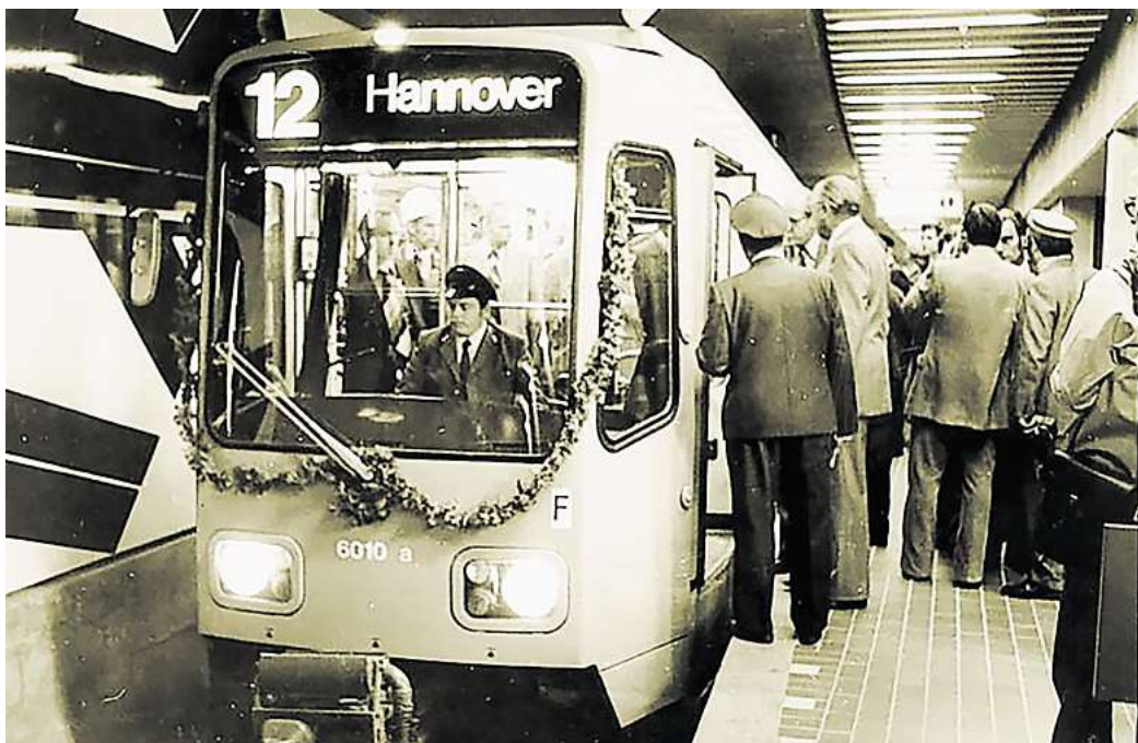
26. September 1975: Die Station unter dem Hauptbahnhof wird feierlich eröffnet.

Die Ursprünge des Großen Gartens reichen ins Jahr 1675 zurück. Herzog Johann Friedrich wollte den Gutshof seines Vaters zu einer Sommerresidenz umwandeln. Entstanden war zunächst ein Lustgarten. Weiterentwickelt wurde er dann während der Amtszeit von Kurfürst Ernst August. Seine Frau, Kurfürstin Sophie, gestaltete den Garten. Orientierung boten dabei holländische Barockgärten. Die Kurfürstin hatte ihre Jugend in Holland verbracht. Bis 1714 entwickelte sich so der Große Garten in seiner heutigen Form und Größe: Ein regelmäßiges Rechteck begrenzt durch einen künstlichen Wassergraben und Baumreihen. Erst 1936 wurde der Garten von der Stadt Hannover erworben und so der Öffentlichkeit zugänglich.