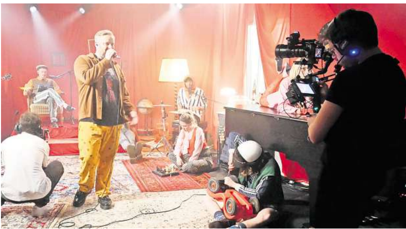
Aufwendige Produktion: Rapper Fatoni (Mitte) bei der Hidden Videosession im Badenstedter Magic Mile Studio.

Sounds, die an Ultravox und OMD denken lassen. Eigentlich schon ein bisschen zu groß(artig) für kleine Clubs. ► 14 Jules the Fox: „Orion Nebulae“ „The world ist not all crazy“ – was für eine hoffnungsvolle Chorus-Zeile: Der Song „Orion Nebulae“ von Jules the Fox unterstreicht deren Außergewöhnlichkeit als Sängerin, Komponistin, Arrangeurin und Produzentin – wofür sie in diesem Jahr eine hochverdiente Auszeichnung als „Self Producing Artist“ von Sony Music und Women in Music Germany erhalten hat. ► 13 Chicago Lane: „Lick it“ Vier Jungs eignen sich den Achtziger-Hairspray-Metal à la Poison kulturell an. Wären sie nur schrill, wär’s eine Karikatur. Weil sie aber richtig gut sind, ist es eine Hommage. Songs wie „Lick it“, Stirnband und Nietengürtel haben sie zum Landessieger des Local-Heroes-Wettbewerbs gemacht. ► 12 Jeanie: „Inner child“ Als Künstlerin hat Jeanie schon mehrere Häutungen hinter sich. „The Voice of Germany“, Deutschpop unter dem Namen Celina, jetzt wieder Jeanie: Indie-Neo-Soul mit Vintage-Appeal. Wenn der Alltag wie ein Pancake ist, dann ist „Inner child“ der Ahornsirup darauf. ► 11 Michèl von Wussow: „Mitte 20 im Arsch“ Der Hype um Michèl von Wussow war 2023 größer. Jetzt führt die Emanzipation vom Newcomer zum etablierten Artist über ein steiniges Wegstück. Da-