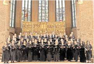
Der Bachchor Hannover singt weihnachtliche Musik in der Marktkirche.

HANNOVER. Vier Typen und vier Mikrofone, das fünfte Weihnachtsalbum im Gepäck, und nach über 20 Band-Jahren noch immer voller frischer Ideen: Maybeop bringen ihr Weihnachtskonzert zum Album „Schöner Schein“ auf die Bühne im Theater am Aegi. Das A-cappella-Quartett entstaubt dabei Klassiker wie „Heidschi Bumbeidschi“ oder „Carol of the Bells“ und kleidet die festlichen Melodien in ein neues Gewand. Und auch Eigenkompositionen fehlen nicht, wie immer mit Augenzwinkern, vom tragikomische Tango „Der Tod des Weihnachtsmanes“ bis zur Deutsch-Rap-Parodie „KNG of LightZ“, in der klargestellt wird, wer die Hütte mit dem höchsten Bling-Bling-Faktor hat. Drei Termine für die Konzerte stehen noch an: Sonnabend, 21. Dezember, ab 19 Uhr, und Sonntag, 22. Dezember, ab 14 Uhr und ab 19 Uhr.