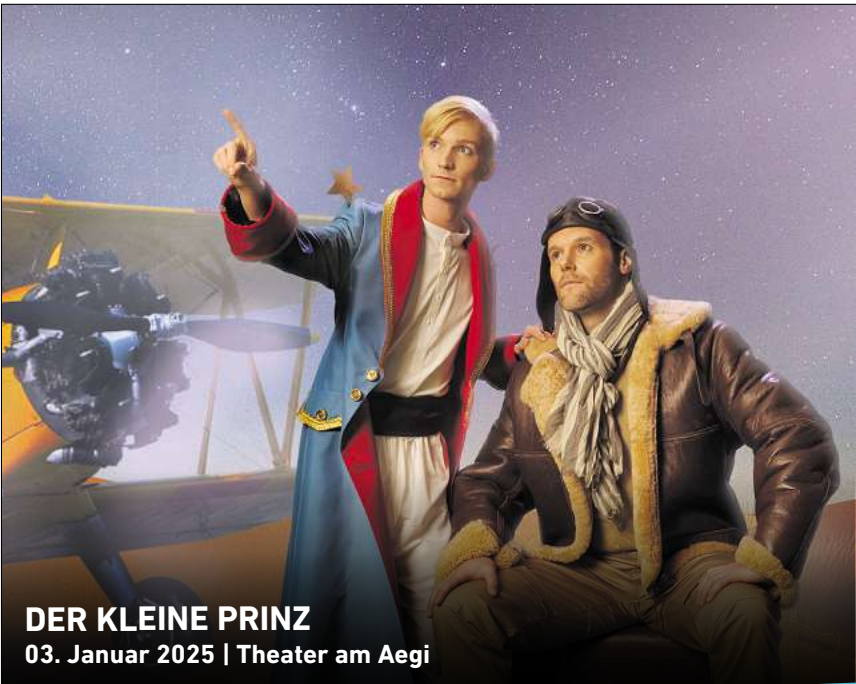
DER KLEINE PRINZ 03. Januar 2025 | Theater am Aegi

Ihr persönlicher Ticketservice der HAZ & NP