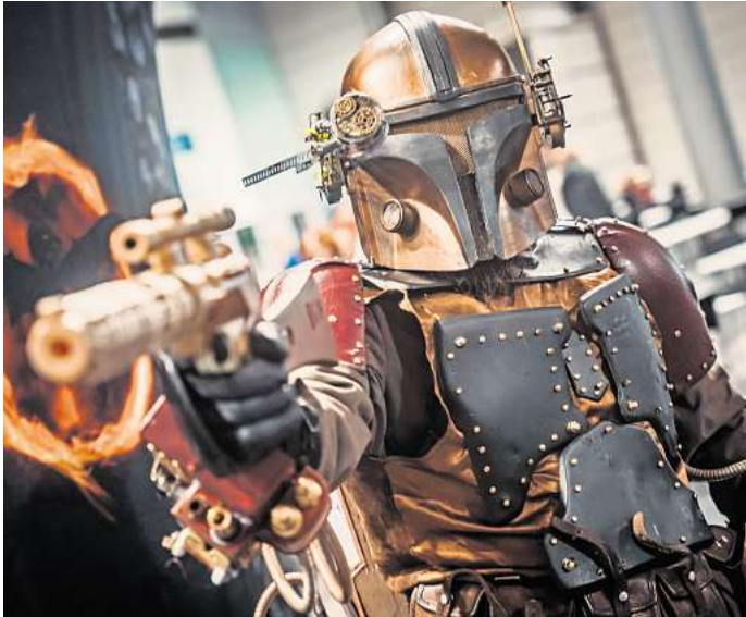
Scienc-Fiction-Sets, Cosplay und jede Menge Spielspaß warten auf dem Messegelände.

Austausch mit der Community. In Miniaturschlachten kann man sich beim Tabletop-Treff Hannover stürzen und dabei gleich in Workshops lernen, wie man Figuren bemalt. Der Verein Dragon Legion e.V. bietet One-Shots für verschiedene Rollenspiele an – perfekt, um neue Systeme kennenzulernen oder in die Welt des Pen & Paper einzutauchen. Außerdem dabei: die Macher des YouTube-Formats „Keep on rolling“. Also: Würfel rausgeholt und auf ins Abenteuer! Geöffnet ist am Sonnabend von 10 bis 20 Uhr und am Sonntag von 10 bis 18 Uhr. Tickets gibt es ab 20 Euro.