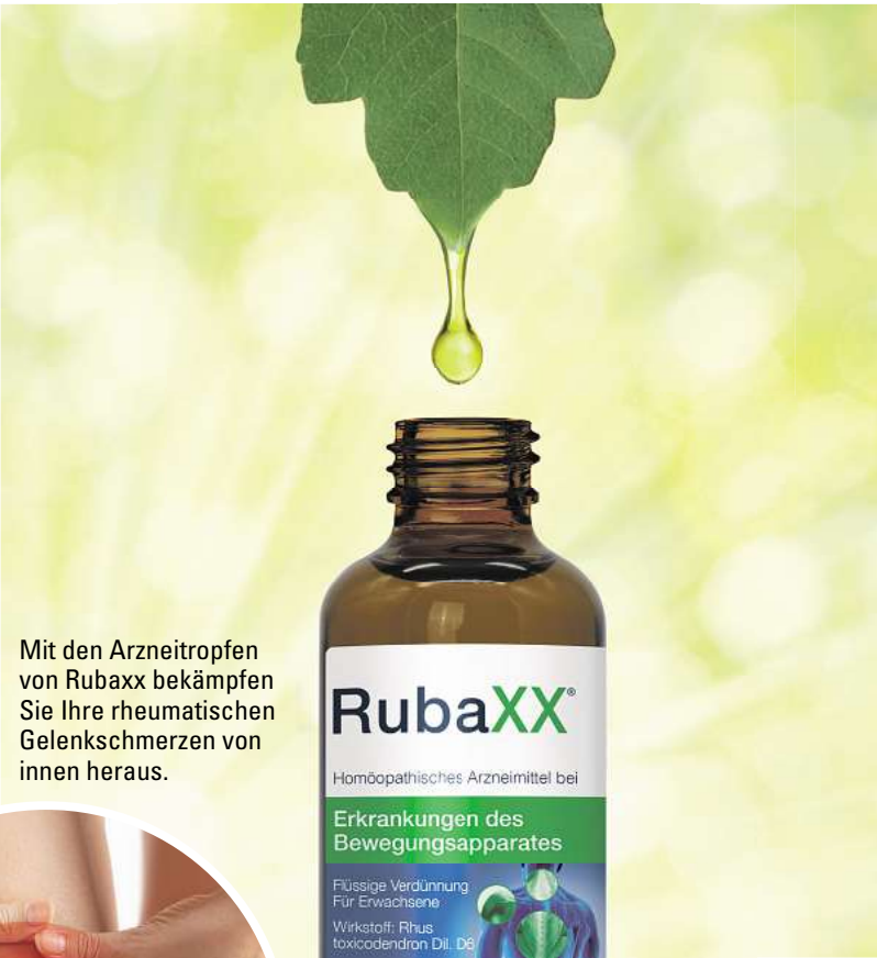
Mit den Arnzeitropfen von Rubaxx bekämpfen Sie Ihre rheumatischen Gelenkschmerzen von innen heraus.

Wirkung ohne Umwege Durch die Darreichungsform als Tropfen wird der Wirkstoff in Rubaxx direkt über die Schleimhäute aufgenommen. Die schmerzlindernde Wirkung kann sich so ohne Umwege entfalten. Tabletten dagegen müssen zunächst im Magen zersetzt