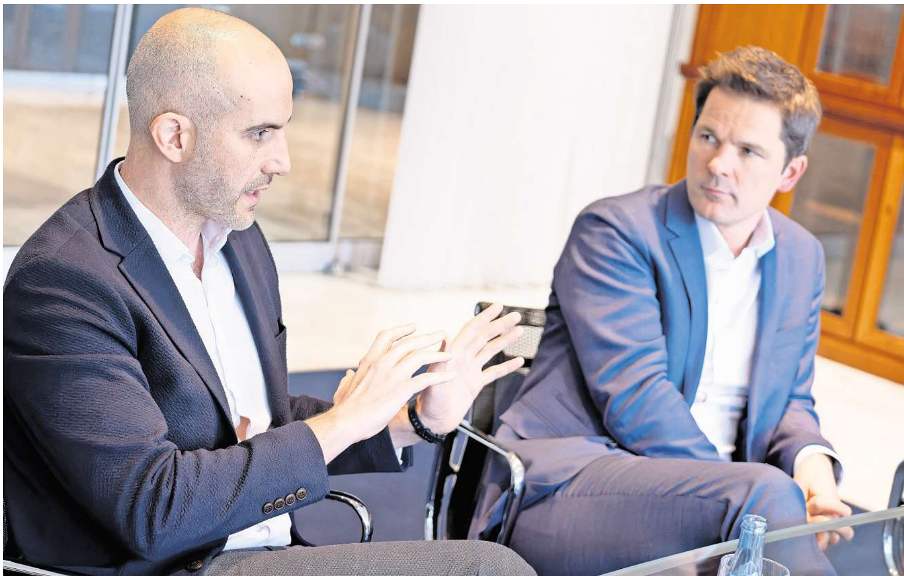
Stehen unter Druck: Hannovers Oberbürgermeister Belit Onay (links) und Regionspräsident Steffen Krach haben angekündigt, den Autoverkehr deutlich zu reduzieren. Bis-

Krach: Wenn ich einen Wunsch hätte, ist es, dass wir auch 2034 noch einen bezahlbaren ÖPNV haben. Dafür ist das Deutschlandticket essenziell. Es ist unerschäm, dieses Infrastruktur zu stellen. Und wenn ich noch eine Vision äußern darf: Wir bräuchten eine S-Bahn-Ringlinie, die um die Landeshauptstadt herum durch die Region führt. Das ist aber eine Vision, die über zehn Jahre hinausgeht.