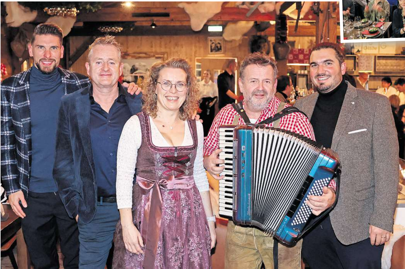
Eröffnung Baracca Hannover Fondue Chalet mit Schweizer Alpenflair, an der Parkbühne, Übersicht,