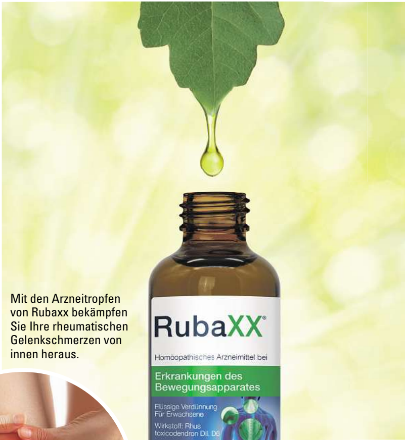
Mit den Arnzeitropfen von Rubaxx bekämpfen Sie Ihre rheumatischen Gelenkschmerzen von innen heraus.

Wirkung ohne Umwege Durch die Darreichungsform als Tropfen wird der Wirkstoff in Rubaxx direkt über die Schleimhäute aufgenommen. Die schmerzlindernde Wirkung kann sich so ohne Umwege entfalten. Tabletten dagegen müssen zunächst im Magen zersetzt