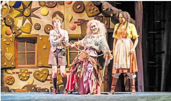
Hänsel und Gretel: Märchenspiel von Engelbert Humperdinck nach dem Märchen der Brüder Grimm.

Die nächste Aufführung ist am Sonntag, 24. November, ab 16 Uhr im Opernhaus. Am 8. und 16. Dezember finden die beliebten