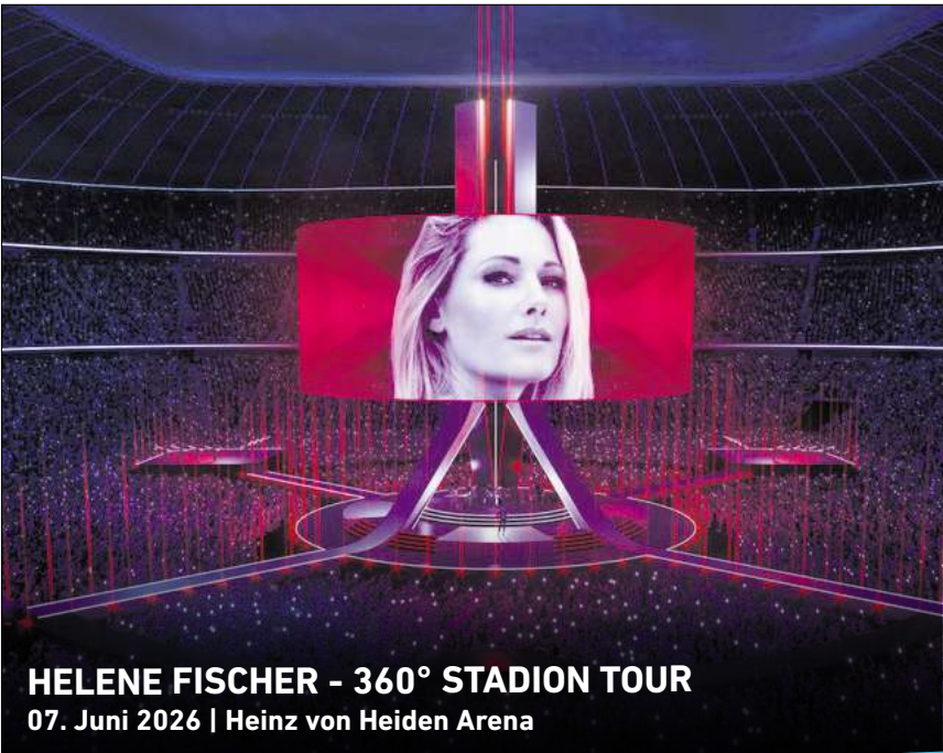
HELENE FISCHER - 360° STADION TOUR 07. Juni 2026 | Heinz von Heiden Arena

HANNOVER. Apokalypse oder Prinzip Hoffnung? Welche Chancen und Risiken bestünden, wenn eine unbeschönigte Klimakommunikation stattfinden würde, diskutieren Vertreter aus Wissenschaft, Politik, Journalismus, Aktivismus und Kunst am Sonnabend, 23. November, von 14 bis 21 Uhr in der Reihe „Herrenhausen Extra“ zum Thema „Jenseits von 1,5°C“ im Schloss Herrenhausen, Herrenhäuser Straße 5. Der Eintritt zu Vorträgen, Workshops am Nachmittag und Podiumsgespräch ist frei. Um Anmeldung wird gebeten unter klimakommunikation.eventbrite.de. Die Veranstaltung kann auf volkswagenstiftung.de im Livestream verfolgt werden. RED