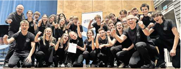
Die KKS Bigband

renommierte Multihornist und Komponist Arkady Shilkloper wird zusammen mit verschiedenen Ensembles der Schule musizieren. Beteiligt werden neben der überregional bekannten, preisgekrönten KKS Big Band, die Käthe Concert Band sowie die Musikzweiklassen des 6. und 7. Jahrgangs sein. Sie werden die Ergebnisse mehrerer Workshops unter der Anleitung von Arkady Shilkloper in diesem Konzert präsentieren. Karten für das Konzert kosten 2,50 Euro. Kartenreservierungen sind über das Sekretariat der Käthe-Kollwitz-Schule möglich: unter gy-kks@schulen-hannover.de , 0511-16848163. Einlass und Abendkasse ab 18 Uhr.