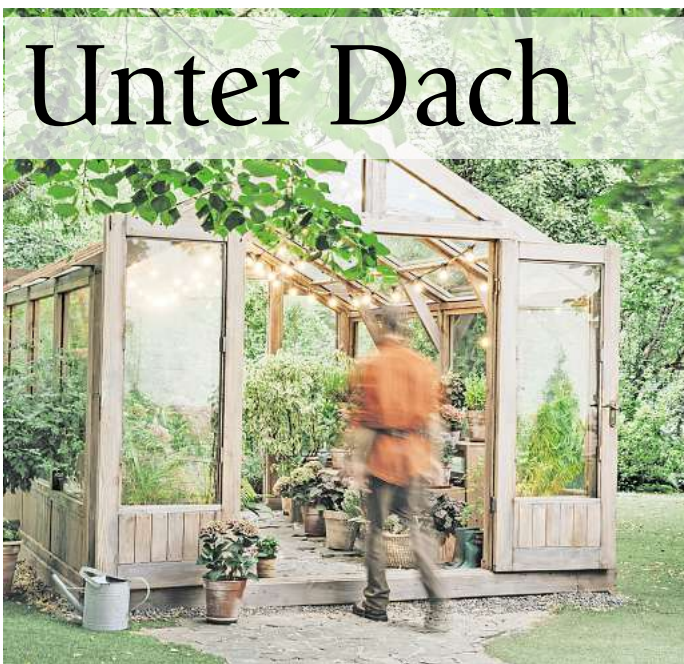
Glashäuser brauchen einen soliden Unterbau.

Eine günstige und leicht aufzubauende Variante ist ein Folien- oder Gewächshaus. Darüber hinaus hat Folie den Vorteil, dass sie Nässe zuverlässig abhält. Allerdings gibt Haage zu bedenken: „Folie