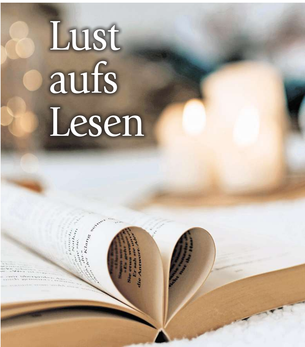
Lesestoff für gemütliche Winterabende gesucht? Dafür hält die BuchLust 2024 viele Ideen bereit.