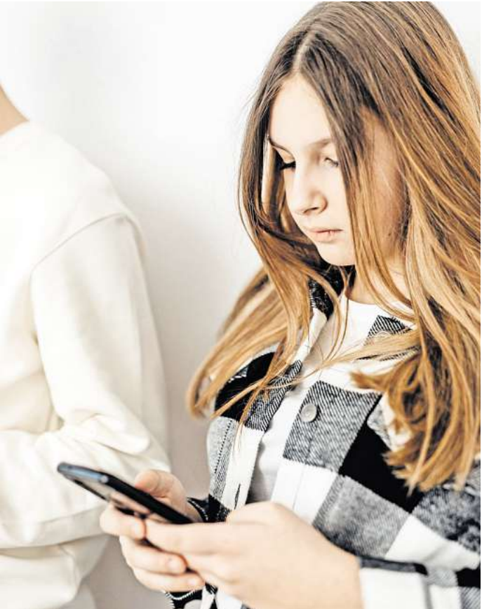
Teenager im Alter von 14 bis 17 Jahren sind besonders betroffen von Cybermobbing.

tigung im Netz informiert. Auch Lehrkräfte nehmen den Daten zufolge eine verschärfte Lage wahr. 84 Prozent erklärten, in den letzten zwölf Monaten mindestens einmal mit Cybermobbing an ihrer Schule in Berührung gekommen zu sein – das waren 17 Prozentpunkte mehr als noch 2022. 8 Prozent gaben an, sogar selbst schon Opfer von Cybermobbing geworden zu sein. Die Auswirkungen auf Schülerinnen und Schüler sind nach den Aussagen der Lehrer vielfältig: 81 Prozent nehmen eine bedrückte Stimmung wahr, 58 Prozent beobachteten ein häufiges Fernbleiben vom Unterricht und ebenfalls mehr als die Hälfte (56) registrierte einen Leistungsabfall.