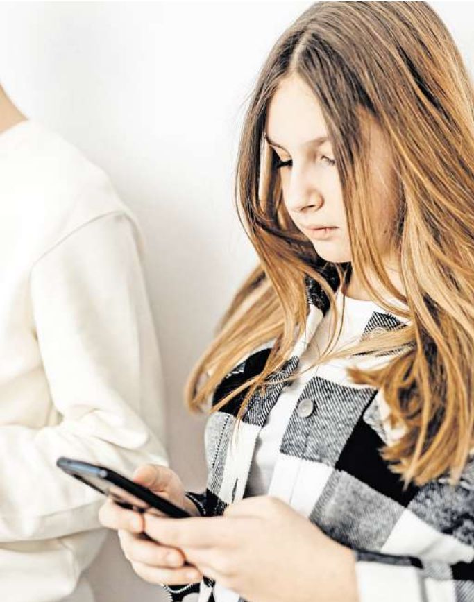
Teenager im Alter von 14 bis 17 Jahren sind besonders betroffen von Cybermobbing.

tigung im Netz informiert. Auch Lehrkräfte nehmen den Daten zufolge eine verschärfte Lage wahr. 84 Prozent erklärten, in den letzten zwölf Monaten mindestens einmal mit Cybermobbing an ihrer Schule in Berührung gekommen zu sein – das waren 17 Prozentpunkte mehr als noch 2022. 8 Prozent gaben an, sogar selbst schon Opfer von Cybermobbing geworden zu sein. Die Auswirkungen auf Schülerinnen und Schüler sind nach den Aussagen der Lehrer vielfältig: 81 Prozent nehmen eine bedrückte Stimmung wahr, 58 Prozent beobachteten ein häufiges Fernbleiben vom Unterricht und ebenfalls mehr als die Hälfte (56) registrierte einen Leistungsabfall.