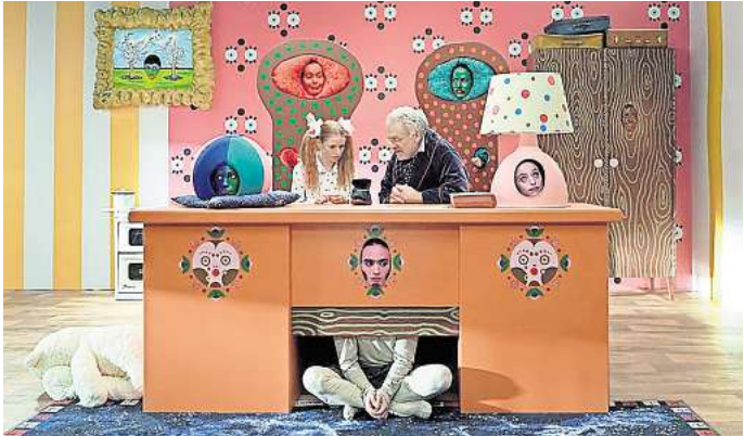
Roe Rosen: „Kafka for Kids“, Videostill, 2022.