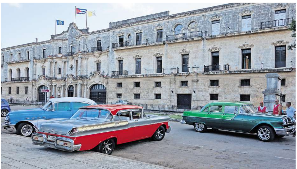
Kuba: ein faszinierendes Land zwischen Nostalgie und Nichts geht mehr.

Die 30. Buchmesse Buchlust lädt am 23. und 24. November von 10 bis 18 Uhr ins Literaturhaus Hannover ein. Dieser runde Geburtstag wird groß gefeiert, und so präsentieren 30 unabhängige Verlage ihre kunstvoll und liebevoll gestalteten Druckwerke. Besucher der Messe können sich auf spannende und vielfältige Bücher freuen, unter anderem von den Verlagen Matt-