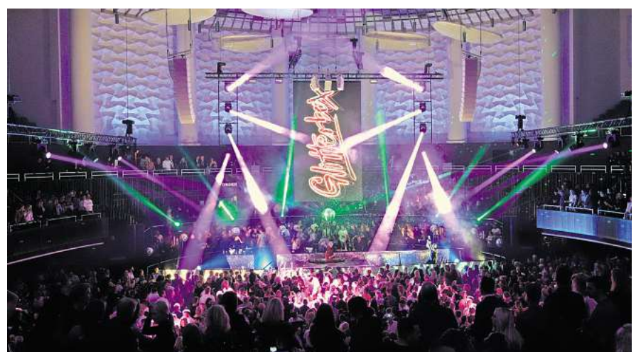
Ausgelassene Stimmung bei der Glitterbox.

„Es war ein Experiment, wir haben das Potenzial sogar unterschätzt. Deswegen kommen wir jetzt zum fünften Mal nach Hannover“, so Mousse T. „Es ist nicht nur ein gutes Stadtmarketing – wir wollen mit dem Format Hannovers Nachtleben nicht nur für