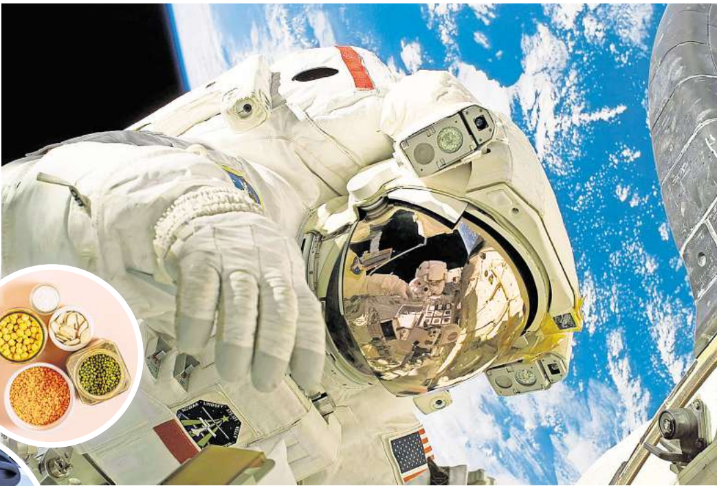
Hannovers Hochschulen beleuchten das Thema Nachhaltigkeit aus unterschiedlichen Perspektiven. So ghet es unter anderem um Raumfahrt, klimafreundliche Ernährung sowie Mobilität und Logistik.

Erfahrungen aus Praxis und Forschung der urbanen Klimaanpassung werden am 12. November in der Ringvorlesung „Wie gelingt uns die Blau-Grüne Transformation?“ geteilt. Prof. Dr. Antje