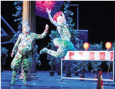
Sommernachts Traum in der Staatsoper.