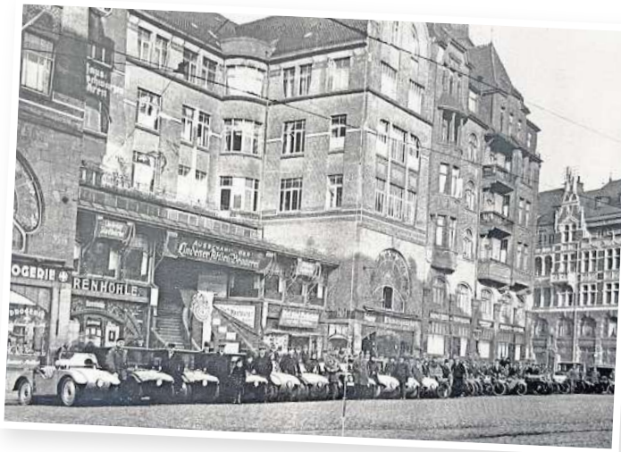
Am Schwarzen Bären: Treffpunkt des Lindener Motorrad- und Automobil-Clubs in den 1920er-Jahren.

BEKO Miele GRUNDIG BOSCH SIMEG AEG LIEBHERR