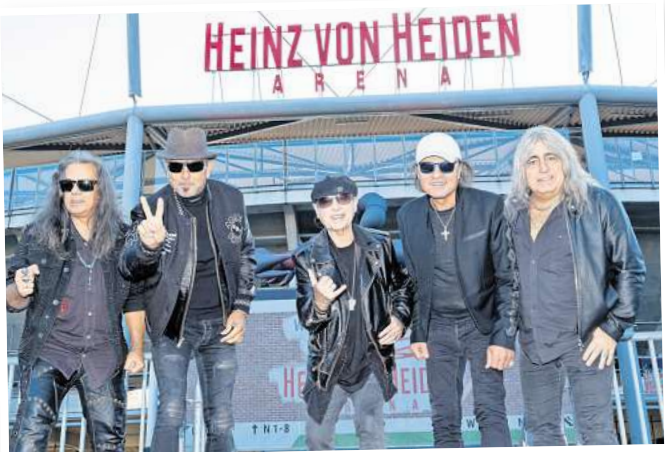
„Hometown“ ist das Motto für die Show zu der sich die Scorpions Pawel Maciwoda (von links), Rudolf Schenker, Klaus Meine, Matthias Jabs und Mikkey Dee auch unter anderem Judas Priest eingeladen haben.

Der Vorverkauf hat begonnen. Karten gibt es bei Eventim und den bekannten Vorverkaufsstellen. Tickets kosten zwischen 78,75 und 151,75 Euro.