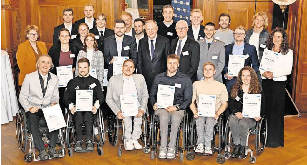
Gruppenbild mit Ministerpräsident: Niedersachsens Teilnehmerinnen und Teilnehmer der Olympischen und Paralympischen Spiele bei Stephan Weil im Gästehaus der Landesregierung.