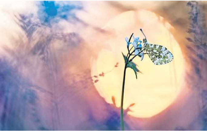
Finalist Henrik Spranz fotografierte für seinen IGPOTY-Beitrag „Aurora“ einen Orangenspitzenfalter vor aufgehender Sonne.

Öffnungszeiten und Preisübersicht: herrenhausen.de