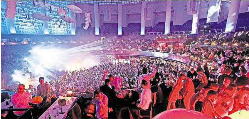
Silvester im HCC: Rund 4500 Menschen werden hier zusammen ins neue Jahr feiern.

Norddeutschlands größte Silvesterparty steigt jedes Jahr im Hannover Congress Centrum (HCC) – dieses Jahr feiert sie zehnten Geburtstag.