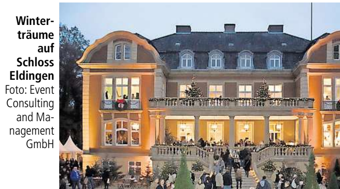
Winterträume auf Schloss Eldingen