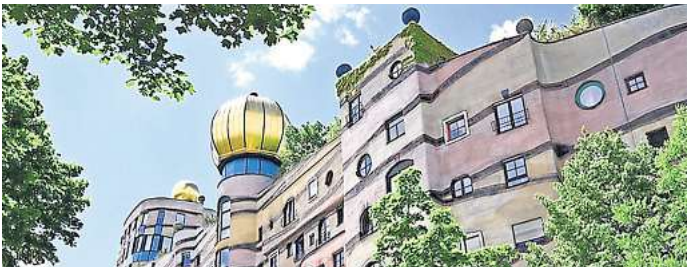
Architektur von Friedensreich Hundertwasser.

Architektur. Der Künstler und Aktivist gestaltete Plakate zu Ökologie-Themen, die in hohen Auflagen gedruckt und deren Verkaufserlöse an Umweltorganisationen gespendet wurden. Er pflanzte über 100.000 Bäume, legte Teiche und Wasser-Kläranlagen an, nutzte Sonnen- und Wasser-Energie und verwendete die Humus-Toilette an allen seinen Wohnorten. Die Ausstellung zeigt auf rund 20 großformatige Texttafeln gut ein Dutzend Bauvorhaben Hundertwassers, von denen sich einige zu wahren Publikumsmagneten entwickelt haben. Darüber hinaus werden seit