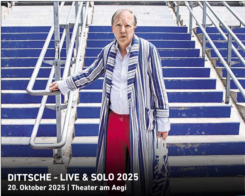
DITTSCHKE - LIVE & SOLO 2025 20. Oktober 2025 | Theater am Aegi

Ihr persönlicher Ticketservice der HAZ & NP