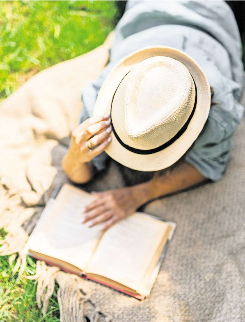
Je nachdem, welches Bedürfnis erfüllt werden muss, sind unterschiedliche Methoden der Erholung gefragt. Nach einem Tag voller anstrengender Telefonate kann dies zum Beispiel Entspannung in reizarmer Umgebung sein oder das Lesen eines Buches.

Um sich zu erholen, müsse man dann einfach das Gegenteil davon tun: „Wenn Sie den ganzen Tag in Zoom-Calls waren, haben Sie wahrscheinlich ein sensorisches Ruhedefizit und das Bedürfnis nach einer reizarmen Umgebung. Ein Buch zu lesen, könnte dann die richtige Er-