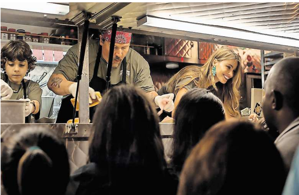
Wohlfühl-Komödie: Das Cinema del Sol zeigt „Kiss the Cook - So schmeckt das Leben“ unter freiem Himmel auf dem Andreas-Hermes-Platz.

Brad Pitt, Tom Cruise und Kirsten Dunst spitzen die Zähne als Blutsauger in „Interview mit einem Vampir“ am Montag, 9. September. Düster-romantisch und schwermütig geht es durch die Jahrhunderte und um die Frage, wann die Ewigkeit sinnlos wird.