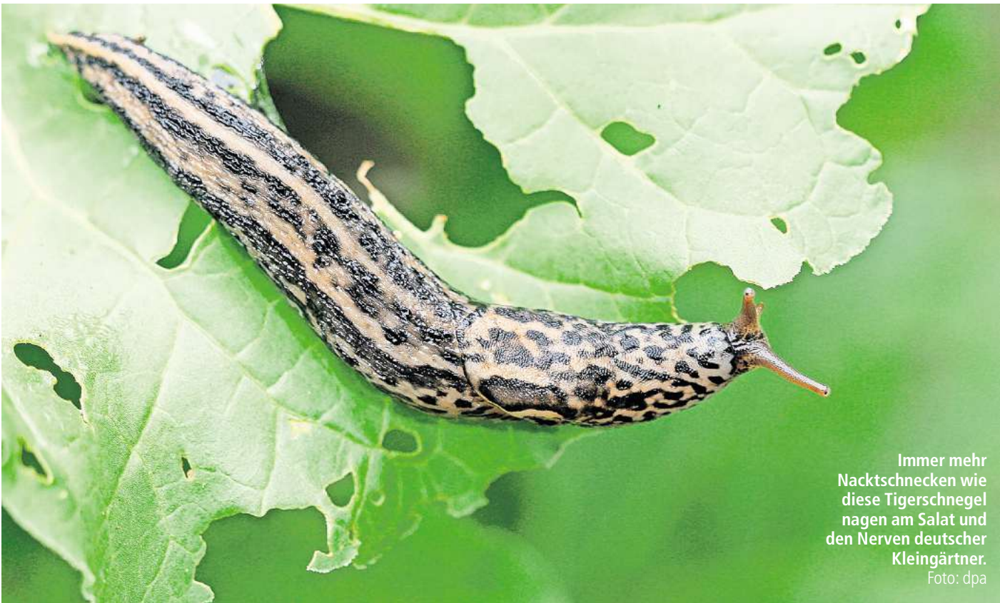
Immer mehr Nacktschnecken wie diese Tigerschnegel nagen am Salat und den Nerven deutscher Kleingärtner.

chemische Präparate oder Bierfallen nicht der richtige Weg, betont Wiese. „Der Kollateralschaden ist einfach zu groß und gefährdet die Gesundheit des gesamten Gartens.“ Auch von Nematoden, also Fadenwürmern, rät er ab. Oftmals richten die