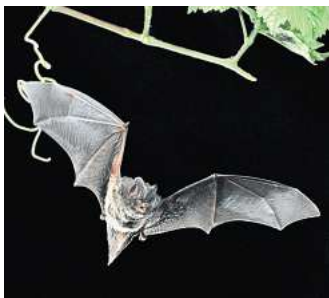
Nachtschwärmer: Fledermäuse sind faszinierende Tiere.

Der Eintritt zu der Veranstaltung ist frei, Spenden werden jedoch gern angenommen. R/H/R