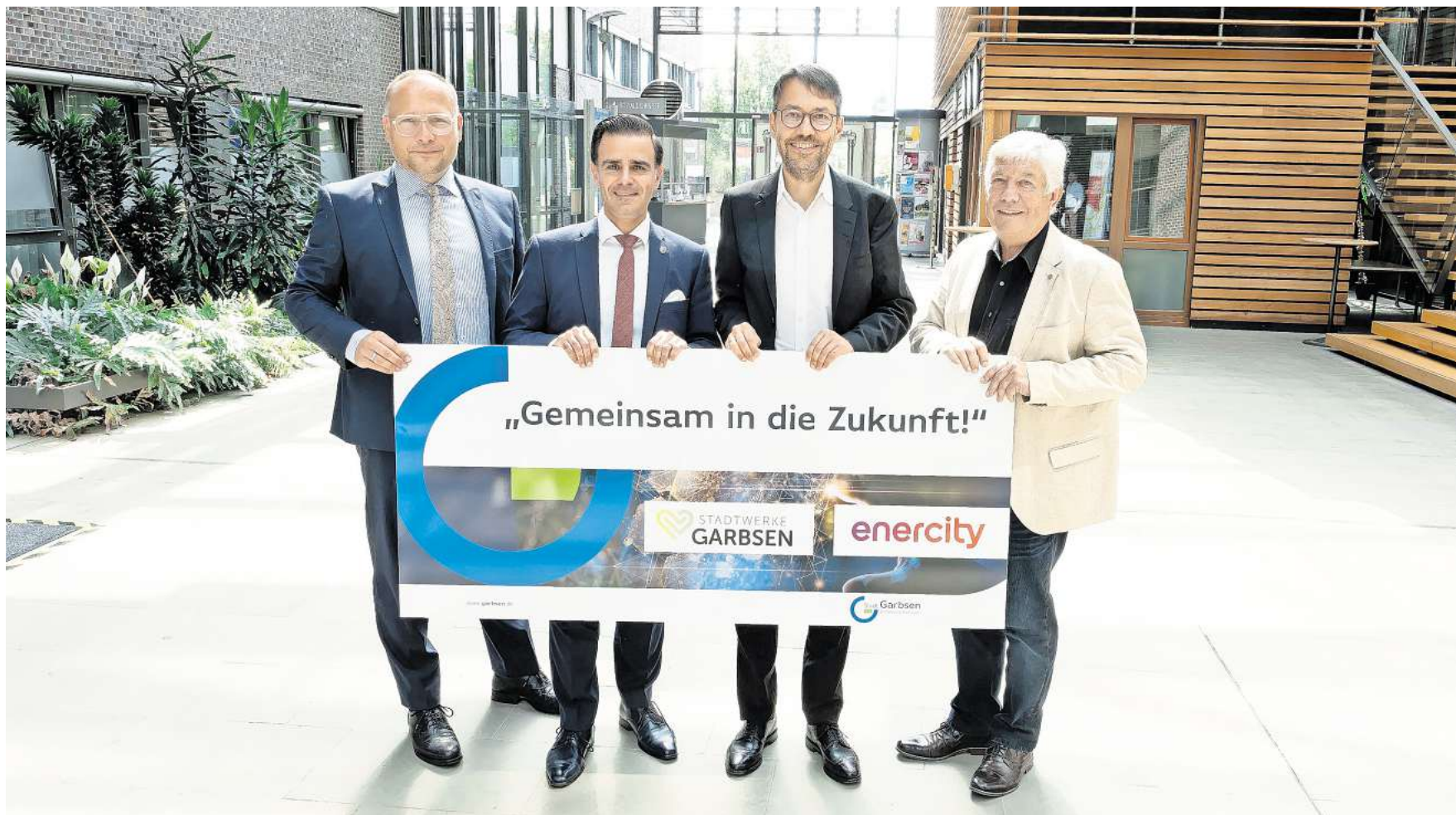
Der hannoversche Energieversorger Enercity übernimmt das Strom- und Gasnetz der Stadtwerke Garbsen und zahlt dafür einen mittleren zweistelligen Millionenbetrag.

Die hohen Investitionssummen in die vielerorts veraltete Infrastruktur muss dann der Konzern stemmen. Er wolle den Aufwand nicht verniedlichen, betonte Finanzvorstand Hansmann, aber das gehöre zum Standardgeschäft und man sei dafür gut gerüstet. Den Verkaufspreis bezeichneten die Parteien als „fair und marktüblich“.