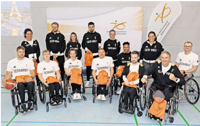
Greifen in Paris nach Medaillen: Niedersachsens Teilnehmer der Paralympischen Spiele wurden in Hannover verabschiedet.