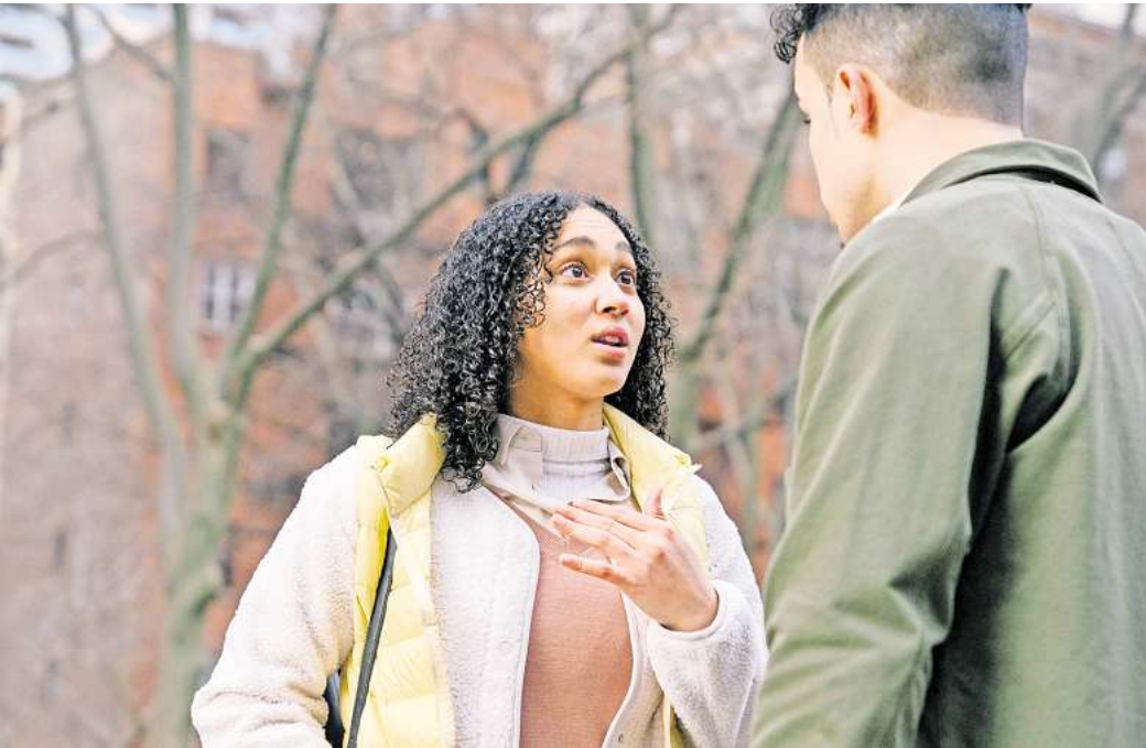
Konflikte gibt es in jeder Beziehung. Das muss nicht negativ sein, wenn man konstruktiv miteinander kommuniziert.

Die Basis für viele Gesprächsstrategien, die von Psychologinnen