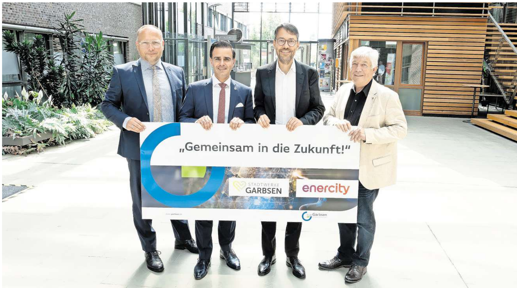
Der hannoversche Energieversorger Enercity übernimmt das Strom- und Gasnetz der Stadtwerke Garbsen und zahlt dafür einen mittleren zweistelligen Millionenbetrag.

Die hohen Investitionssummen in die vielerorts veraltete Infrastruktur muss dann der Konzern stemmen. Er wolle den Aufwand nicht verniedlichen, betonte Finanzvorstand Hansmann, aber das gehöre zum Standardgeschäft und man sei dafür gut gerüstet. Den Verkaufspreis bezeichneten die Parteien als „fair und marktüblich“.