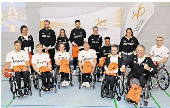
Greifen in Paris nach Medaillen: Niedersachsens Teilnehmer der Paralympischen Spiele wurden in Hannover verabschiedet.