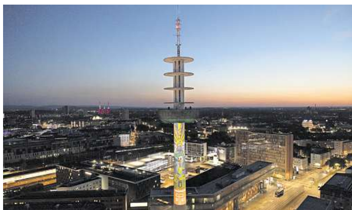
Bunte Lichter während des Sponsoreneinfangs der Turmretter auf der 22. Etage des Bredero-Hochhauses.