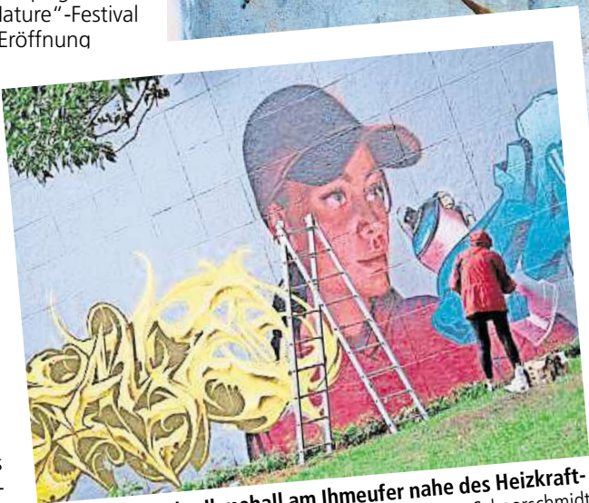
Die Wände an der Ihmehall am Ihmeufer nahe des Heizkraftwerks werden neu gestaltet.

Das „Urban Nature“-Festival wurde mit der Eröffnung der Ihmehall, einem Bereich am Ihmeufer, an dem legal die Wände mit bunter Street-Art besprüht und bemalt werden dürfen, im Jahr 2018 vom Graffiti-netz Hannover zum ersten Mal entwickelt und veranstaltet. Seitdem findet es jährlich als Kooperationsveranstaltung mit dem Kulturbüro statt. Es ist Teil des Kulturentwicklungsplans (KEP) 2030. Doch die Stadt wird nicht nur am Ihmeufer farbenfroher. Bereits seit dem 19. August verschönern Kunstschaffende für das Event „Hola Utopia!“ drei Fassaden in der Nordstadt und in