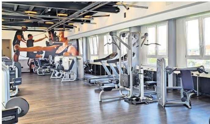
Die neue Fitnessanlage erstreckt sich über 5.000 Quadratmeter und über mehrere Etagen.

therapie Praxen, welches vorher in der Davenstedter Straße 100 seinen Sitz hatte. Ab dem 18. Mai stand den Mitgliedern die Trainingsfläche in der zweiten und dritten Etage der neuen Fitness Stadt wieder zur Verfügung. Die Kursräume, einschließlich eines etwa 200 Quadratmeter großen Yoga-raums, sowie die Bereiche für Kardiotraining und Muskelaufbau sind fertiggestellt. Der Betrieb des neu installierten Aufzugs wurde aufgenommen. Die große Wellness- und Saunalandschaft „Die Stadt Sauna“ ist eröffnet und wird als Highlight eine großflächige innenliegende Terrasse bekommen, die als zusätzlicher Ruhebereich dient. Im Erdgeschoss ist ein Gastronomiebereich mit kleinen Speisen und Getränken eingerichtet, der auch externen Besuchern offen steht. TRAINIEREN MIT PANORAMABLICK Die Trainingsfläche befindet sich auf der dritten Etage, von wo man während des Trainings durch die große Fensterfläche einen wunderbaren Ausblick auf den Benthof, den Lindener Hafen oder in Richtung Herrenhausen/Stöcken genießen kann.