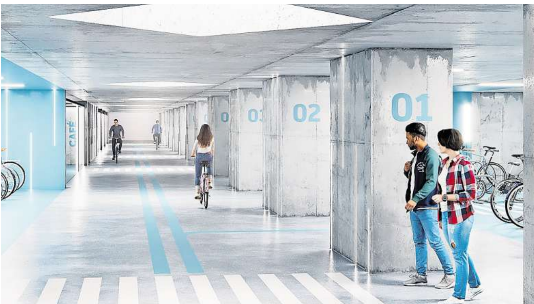
Illustration: So soll die Fahrradgarage unter dem Hauptbahnhof aussehen.

Derzeit ist geplant, dass Radfahrer über langgezogene Rampen in den Untergrund gelangen. Die Zufahrten würden den Ernst-August-Platz zerteilen. Dem Vernehmen nach wünschen sich SPD, CDU und FDP im Rat eine technische Lösung für die Zufahrt zur Fahrradtiegarage, etwa über Fahrstühle. „Im Grunde könnte man den Transport der Räder von der Oberfläche nach unten auch automatisieren“, heißt es aus den drei Parteien.