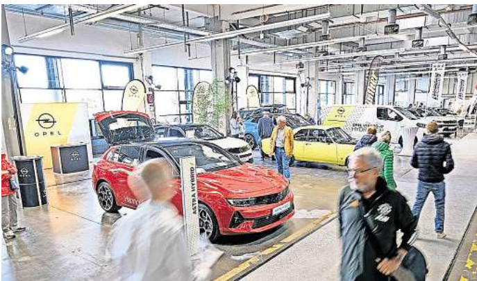
Alle Spielarten der Elektromobilität: Bei den E-Days auf dem Firmengelände der Madsack Mediengruppe können Besucher E-Autos und E-Bikes ausprobieren.

nover präsentieren die Fahrzeuge, unter anderem das Autohaus Ahrens sowie die Autohäuser Günther und Kahle.