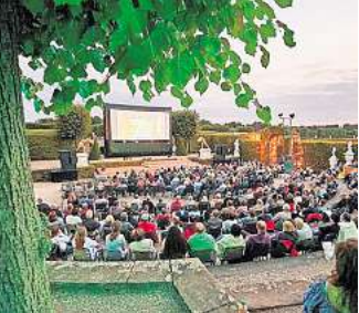
Kino unter freiem Himmel.

Am Sonnabend, 17. August, feiert „Bob Marley: One Love“ das Leben und die revolutionäre Musik der Reggae-Legende. Ab 20 Uhr gibt es Live-Musik, der Film läuft ab 21.30 Uhr. Von den Clubs in Camden zum Weltruhm, vom kometenhaften Aufstieg bis zum tiefen Absturz berührt die Biographie der Ausnahme-Sängerin und Musikerin Amy Winehouse in „Amy Winehouse: Back to Black“ am Sonntag, 18. August,