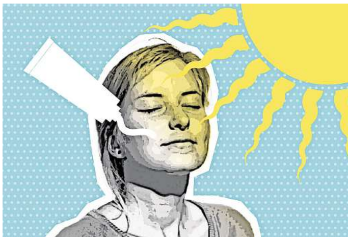
Sonne-Creme-VitD Die Sonne hilft dabei, Vitamin D zu bilden. Die Sonne kann aber auch Hautkrebs auslösen.

Wird dann gar kein Vitamin D mehr gebildet? Der Sonnenschutz verlängere zwar den Zeitraum, erklärt Baldermann, doch: „Kein Sonnenschutz kann komplett verhindern, dass UV-B-Strahlung die Haut trifft. Die Vitamin-D-Produktion wird immer angetriggert.“ Einen Sonnenbrand vermeiden, das sei wirklich das Allerwichtigste. Denn die Haut vergisst nicht.