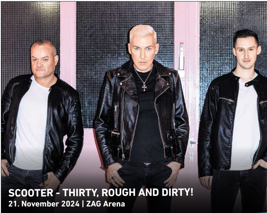
SCOOTER - THIRTY, ROUGH AND DIRTY! 21. November 2024 | ZAG Arena

HANNOVER. Das solare Wanderkino Cinema del Sol zeigt am Mittwoch, 7. August, auf dem Platz an der Lutherkirche in Hannovers Nordstadt den Film „Sultanas Traum“ (FSK 16 / 86 Minuten) im Original mit deutschen Untertiteln. Die junge Künstlerin Inés stößt in einer indischen Buchhandlung auf „Sultana’s Dream“, einen Science-Fiction-Band, der vor mehr als hundert Jahren von einer Frau namens Rokeya Hos-sain geschrieben wurde. Fasziniert von den kühnen Visionen einer Unbekannten begibt sich Inés auf eine hypnotische Reise quer durchs Land – auf der Suche nach dem sagenumwobenen „Ladyland“ und ihren verloren geglaubten Träumen. Filmbeginn ist gegen 21 Uhr mit einbrechender Dunkelheit, bei sehr schlechtem Wetter findet die Veranstaltung nicht unter dreiem Himmel, sondern in der Kirche statt. Sitzgelegenheiten sind vor Ort vorhanden. Der Eintritt ist frei, Spenden sind willkommen. Kontakt und Anmeldung: Nicole Bock, n.bock@elm-mission.net , Telefon (0511) 1215293. RED