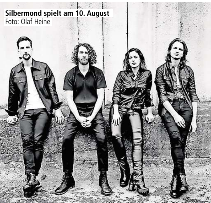
Silbermond spielt am 10. August

Wer lieber mit Weltstar Tom Jones zu Hits wie „Delilah“, „What’s New Pussycat?“, „She’s A Lady“, „Help Yourself“ oder „Green Grass Of Home“ feiern möchte, der ist am 14. August goldrichtig. Das Konzert ist eines von nur fünf Deutschland-Shows und sicherlich ein absolutes Highlight für Fans des Tigers. Am 16. und 17. August werden dann PUR im Rahmen ihrer diesjährigen Open-Air-Tour unter dem Motto „Persönlich – Unter freiem Himmel“ mit Hits wie „Lena“, „Hör gut zu“, „Wenn Du da bist“ und natürlich „Abenteuerland“ ganze zwei Tage lang das Publikum begeistern. Beide Shows sind leider schon ausverkauft. Weiter geht es am 21. August mit Jan Delay & Disko No. 1. Der