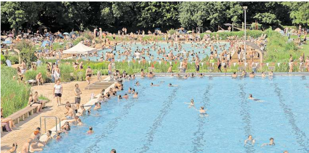
„Wir haben hier noch nicht ein einziges Mal Hausverbot erteilen müssen in dieser Saison“: Blick auf die beiden Becken des Ricklinger Bades.

Am Sprungturm dagegen ist Energieabbau angesagt. Abude und Artiom (beide 12) wagen „Körper vom Dreier“, Manaf (10) will sogar einen Backflip vorführen, ein Rückwärtssalto aus fünf Metern Höhe. „Den kann ich seit zwei Jahren“, sagt er stolz, und dass er jetzt in den Sommerferien zweimal pro Wo-che hier sei.