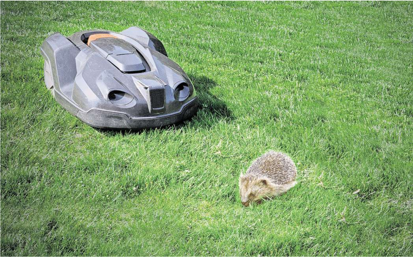
Tödliche Gefahr: Immer mehr Igel werden durch Mähroboter schwer verletzt oder getötet.

und verletzt ihn mit seinen messerscharfen Klängen“, sagt Berger. Der Igel könnte vor dem Rasenschneidegerät weglaufen, schnell genug wäre er, in den meisten Fällen tut er das aber nicht. „Auch bei Igeln gibt es die Forschenden und die Schützenden, aber beide Persönlichkeitstypen reagieren ähnlich bei Mährobotern: Sie bleiben starr sitzen und warten ab, sie igeln sich ein“, sagt Berger. Lediglich beim Alter habe man Unterschiede festgestellt können, wenn auch marginal. „Die jungen Igel waren etwas neugieriger, die älteren eher scheu.“ Sitzen bleiben sie in den meisten Fällen trotzdem – egal ob jung oder alt.