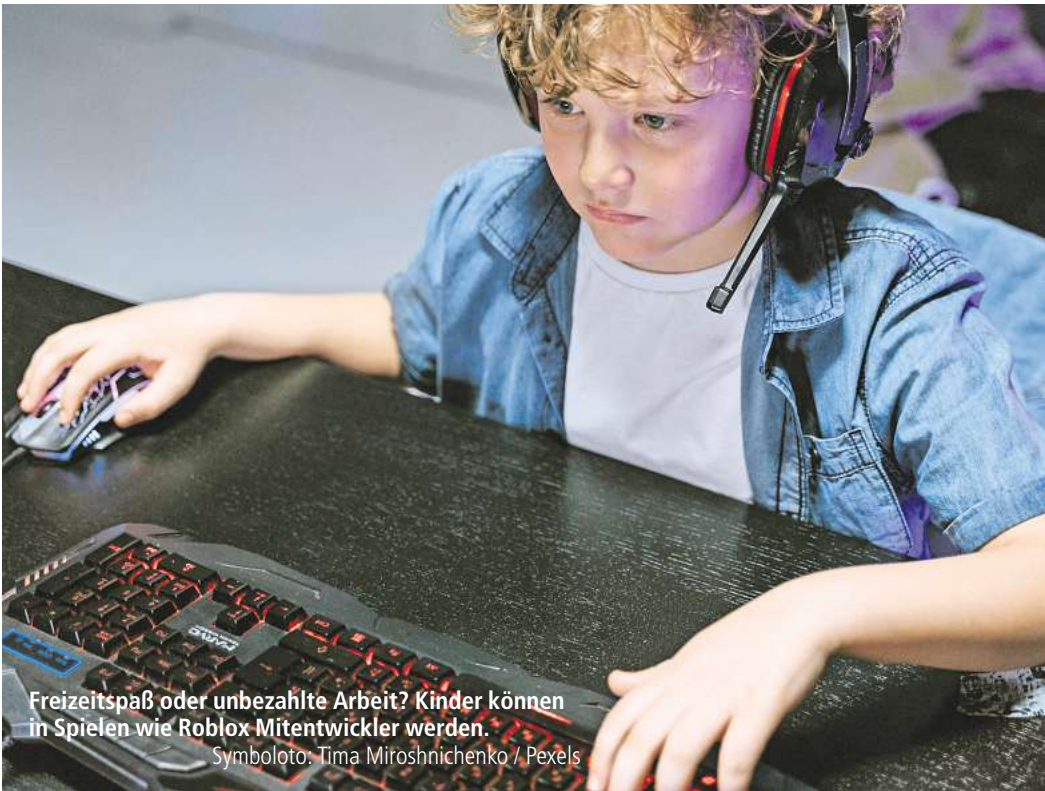
Freizeitspaß oder unbezahlte Arbeit? Kinder können in Spielen wie Roblox Mitentwickler werden.