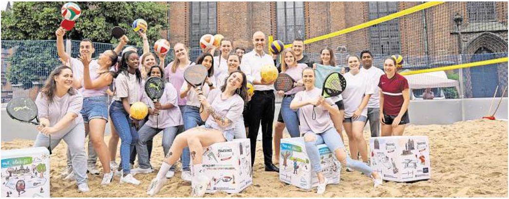
Eröffnung an der Marktkirche: Oberbürgermeister Belit Onay (Mitte) sieht in dem kostenlosen Sportangebot eine Möglichkeit, die Innenstadt neu zu beleben.