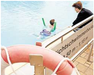
Einzeltraining: Für Kinder ohne Wassererfahrung nehmen sich die Trainer besonders viel Zeit.

Kinder lernen schnell in einem solchen Schwimmkursus, wenn Eltern ihren Nachwuchs früh an Wasser gewöhnen, mit ihnen