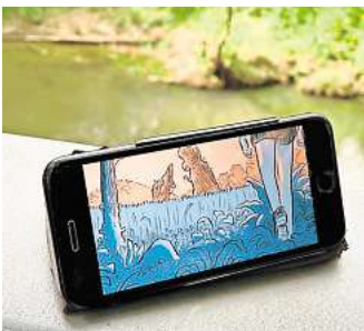
Unfollow now: Wanderung, Hörspiel-Animations-Theater und Graphic Novel.

paket. Das künstlerische Material darin begleitet die Wandernden über ihr eigenes Smartphone. Neben einem Hörspiel und Animationen der Graphic Novel bietet es viele philosophische bis biologische Anregungen und Gedankenströme, sich mit der Erde und dem Einfluss des Menschen zu befassen. Denn darum geht es in Jüligers „Unfollow“: Ein siebenjähriger Junge mit Erinnerungen an die Entstehung der Erde