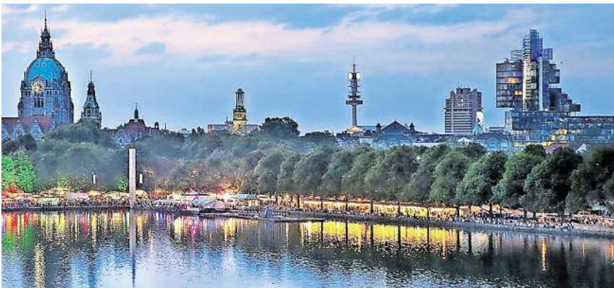
Blick auf Hannovers Skyline beim Maschseefest: Bei der Seesause wird der Bereich am Geibeltreff jetzt neu geordnet.