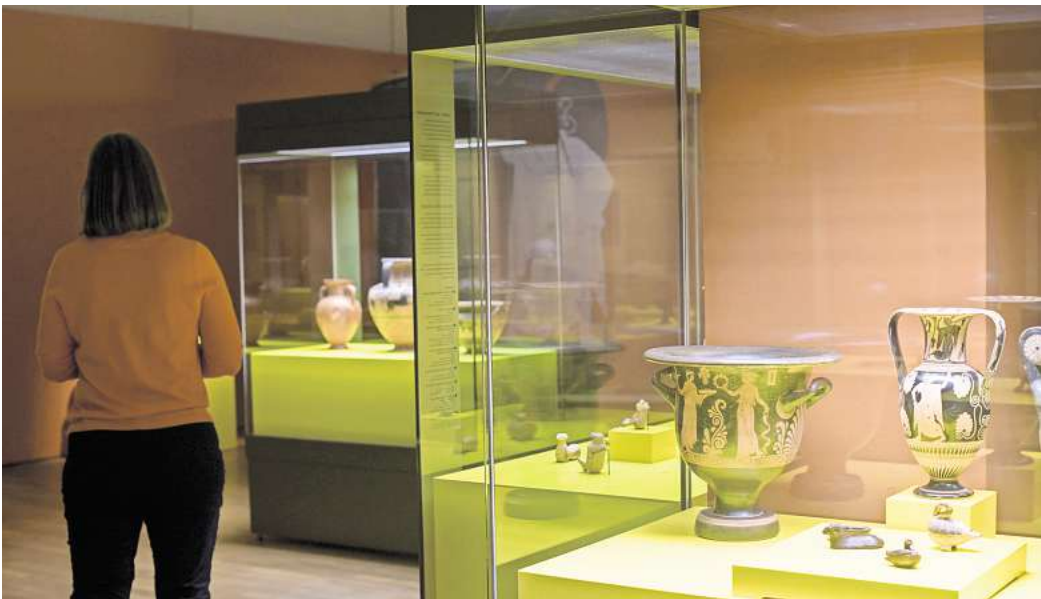
Das Landesmuseum zeigt aktuell etruskische Schätze aus der Villa Giulia. Zur Nacht der Museen gibt es ein familienfreundliches Rahmenprogramm.

Kreative Angebote von Buch und Papier, interessante Blicke hinter die Kulissen und Reisen in virtuelle Bücherwelten gibt es in Stadtbibliothek Hannover, Hildesheimer Straße 12. Neben einer Büchermeile und Workshops zur Buchbinderei und Journals gibt es ein umfangreiches Veranstaltungsprogramm. Unter anderem kann mit Roboter HANNO gebastelt werden und es geht auf eine Reise in virtuelle Welten mit der VR-Brille. Von 18 bis 20 Uhr sorgt Clownerin Barbalotta für Zauberverhaftes, es entstehen Schnappschüsse vor dem Green Screen, und unter dem Motto „Queer Library – meine Lieblings-