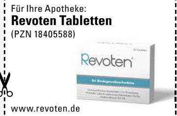
Abbildung Betroffenen nachempfunden REVOTEN. Wirkstoffe: Acidum silicicum Trit. D4, Calcium carbonicum Hahnemannii Trit. D4. Die Anwendungsgebiete entsprechen den homöopathischen Arzneimittelbildern. Dazu gehört: Bindegewebsschwäche. www.revoten.de • Zu Risiken und Nebenwirkungen lesen Sie die Packungsbeilage und fragen Sie Ihre Ärztin, Ihren Arzt oder in Ihrer Apotheke. • Remitan GmbH, 82166 Gräfelfing

So können unschöne Anzeichen von Bindegewebsschwäche wie schlaffe Haut und Cellulite natürlich von innen bekämpft werden.