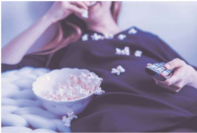
Zeit mit Unterhaltungssendungen verbringen, die man eigentlich gar nicht mag: „Hate Watching“ wird für manche Menschen zur Gewohnheit.

fühl. Wenn beim „Hate-Watching“ viele Menschen etwas schauen, um sich online oder im Gespräch darüber lustig zu machen, wirkt das verbindend. Oliver Kalkofes Fernsehreihe „SchleFaZ“ (kurz für: Die schlechtesten Filme aller Zeiten) lebt seit Jahren von diesem Mechanismus.