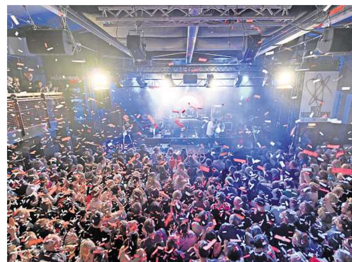
Das Musikzentrum bleibt für Konzerte bestehen.