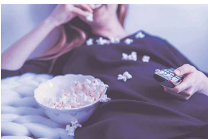
Zeit mit Unterhaltungssendungen verbringen, die man eigentlich gar nicht mag: „Hate Watching“ wird für manche Menschen zur Gewohnheit.

fühl. Wenn beim „Hate-Watching“ viele Menschen etwas schauen, um sich online oder im Gespräch darüber lustig zu machen, wirkt das verbindend. Oliver Kalkofes Fernsehreihe „SchleFaZ“ (kurz für: Die schlechtesten Filme aller Zeiten) lebt seit Jahren von diesem Mechanismus.