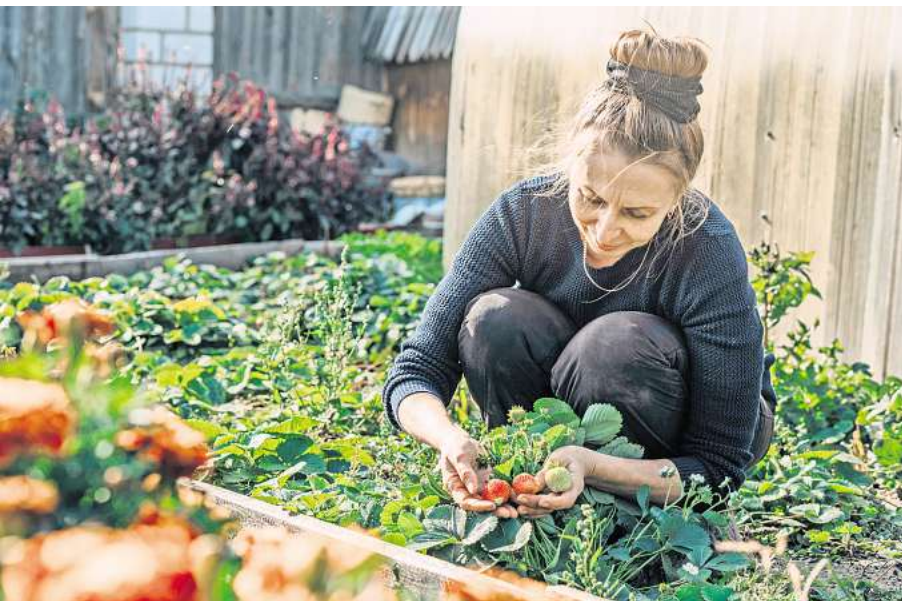
Im Garten lassen sich die ersten Erdbeeren ernten.

HANNOVER. Bäume und Sträucher wurden entweder schon gepflanzt oder Sie verschieben diese Aufgabe auf den Herbst. Derzeit könnten Sie das zwar ebenfalls erledigen, allerdings müssten Sie dann besonders viel und sorgfältig gießen. Konzentrieren Sie sich stattdessen doch lieber auf vergleichsweise einfache Arbeiten und kümmern Sie sich um jene Gewächse, die bereits im Garten wachsen. Einige belohnen Sie derzeit mit ihren Früchten: Erdbeeren haben im Juni Hochsaison und wandern meist direkt vom Beet in den Mund. Für das Konservieren als Marmelade sind die zumeist überschaubaren Mengen dieser zuckersüßen Köstlichkeiten viel zu schade. Anders sieht es bei vielen Kräutern aus: Melisse, Minze, Thymian oder Oregano liefern in diesem Monat so viele frische Blättchen, dass Sie wahrscheinlich gar nicht alles verarbeiten und einen Teil davon für den Vorrat schneiden und trocknen können. Dafür ist der Juni ideal: Kurz vor der Blüte schmecken diese Kräuter besonders aromatisch, und sie wachsen auch so schnell wieder nach, dass Sie den ganzen Sommer über weiterhin frische Blättchen ernten werden.