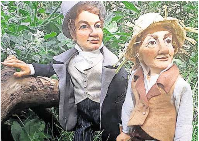
Auf Humboldts Spuren mit dem Figurentheater Neumond.