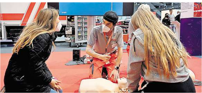
Erste Hilfe – so gehts: Am Johanniter-Stand können die Besucher ausprobieren wie eine Herz-Lungen-Wiederbelebung funtioniert.

Alle „Asselquasselwildniswalks“ lassen sich als Audiodateien auf das Smartphone laden. An den Wildnisflächen vor Ort findet man den Zugang dazu über einen QR-Code, der auf Informationsschildern an hölzernen Wildnistischen auf den Flächen angebracht ist. Im Internet auf hannover.de sind die neuen Angebote über den Suchbegriff „Wildnis zum Hören“ zu finden. RED