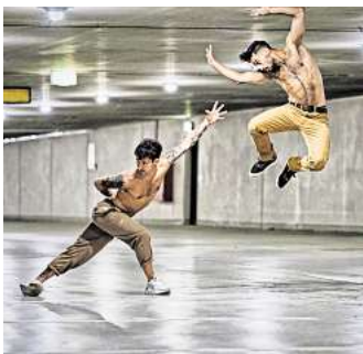
Choreographie „Meaningless“ von Diego de la Rosa

Tickets und Teilnehmende: choreography-hannover.de