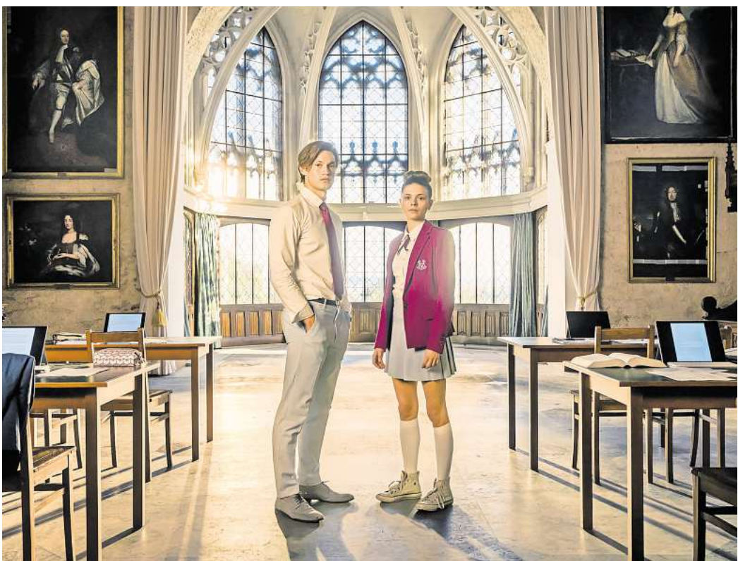
James Beaufort (Damian Hardung) und Ruby Bell (Harriet Herbig-Matten) in der Kulisse der Amazon-Serie „Maxton Hall“ auf Schloss Marienburg in Hannover.

► Die Zufahrt Ruby stammt aus einfachen Verhältnissen und muss im Gegensatz zu ihren Mitschülern und Mitschülerinnen mit dem Bus zur Schule fahren. Innerhalb der Serie tauchen deshalb auf Rubys Busfahrt oft die Landstraße zum Schloss Marienburg und die Zufahrt auf. In Folge vier holt James Ruby in der Zufahrt von der Bushaltestelle ab, und beide gehen zusammen zur Schule.