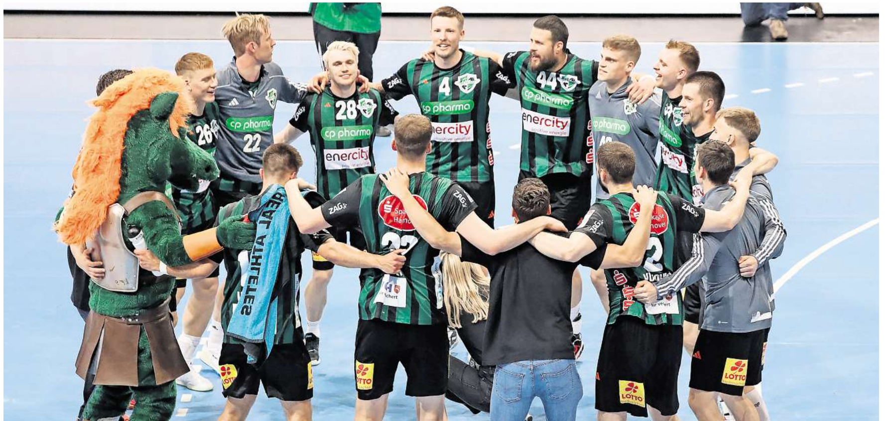
Tanzen noch einmal im Kreis: Die Recken nach dem Sieg am finalen Bundesliga-Spieltag gegen den HC Erlangen.

Saisonfazit der Handball- RECKEN : Fans und Nationalspieler in den Hauptrollen / Sie wollen zurück nach Europa