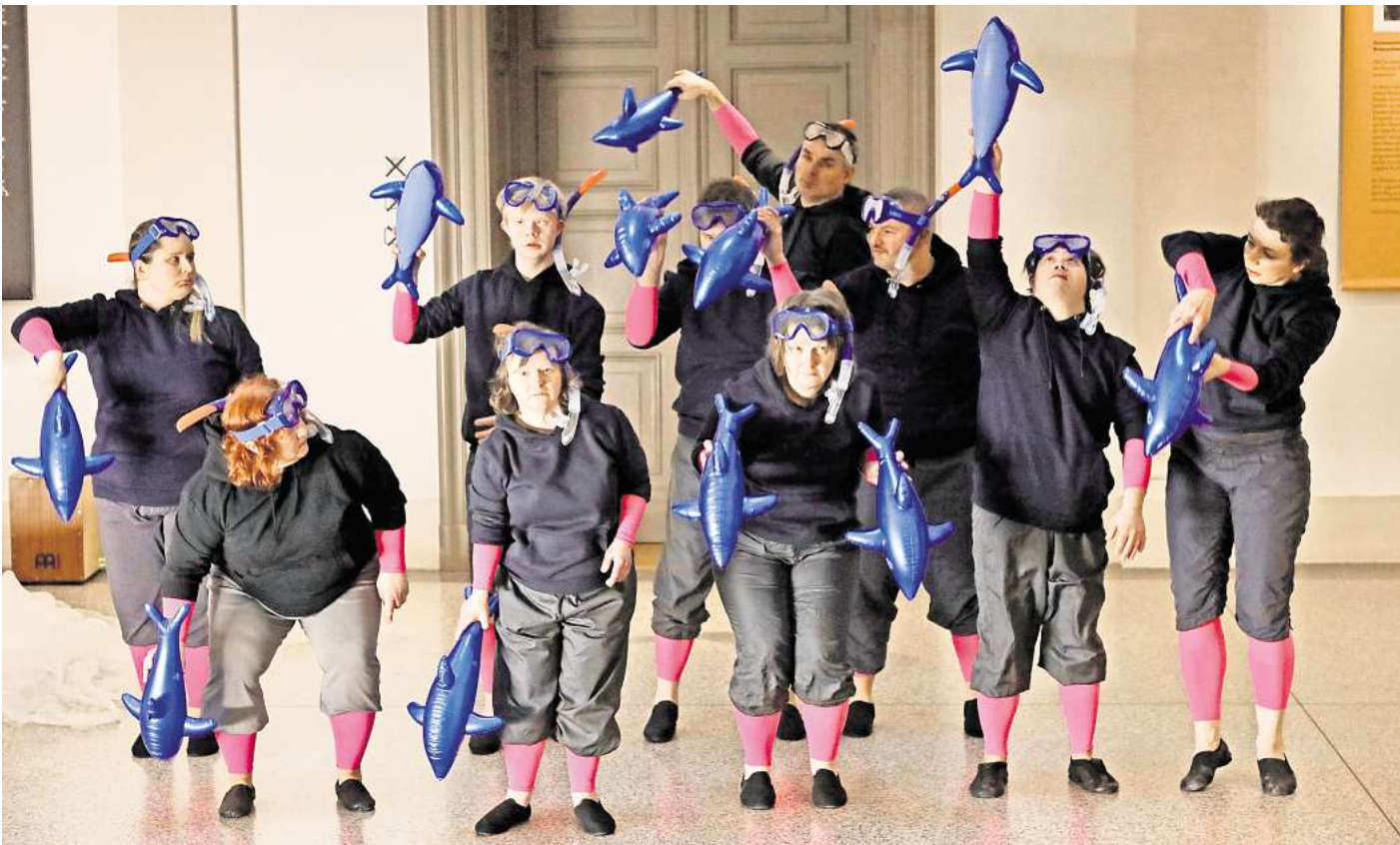
Die esisto!company der Lebenshilfe Braunschweig präsentiert ihr Tanztheater „In einem Atemzug“.

Den Auftakt macht am Montag, 3. Juni, der Chor der Grundschule auf dem Loh mit der Musikschule der Landeshauptstadt Hannover und ihrem Konzert „Spiegelin, Spiegelin hier – Wer ist das schönste Tier?“. Die Astrid-Lindgren-Schule und Schule am Wasserwerk aus Burgdorf tanzen ihr Programm „Kein Sommer ohne euch“ und die Freie Waldorfschule aus Hannover-Bothfeld zeigt ihr Musiktheater „Ronja Räubertochter“ nach der bekannten Geschichte von Astrid Lindgren. Ein inklusives Bandprojekt der Ilmási-Schule Garbsen und der Hochschule für Musik, Theater und Medien