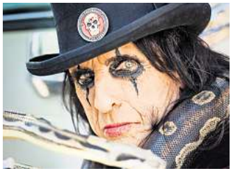
Alice Cooper rockt am 22. Juni auf der Waldbühne Northeim.

Ein Shuttlebus zur Waldbühne wird eingerichtet. Alle Infos dazu gibt es unter www.livingconcerts.de Tickets gibts im VVK für 70 Euro zzgl Gebühren an den bekannten VVK-Stellen und unter www.reservix.de