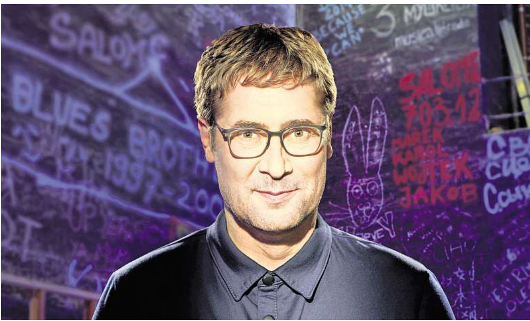
Letzte Show vor der Sommerpause: Desimo verzaubert mit „Klug und Trug“.

➤ Nähere Informationen zum Programm und Kartenvorverkauf: spezialclub.de