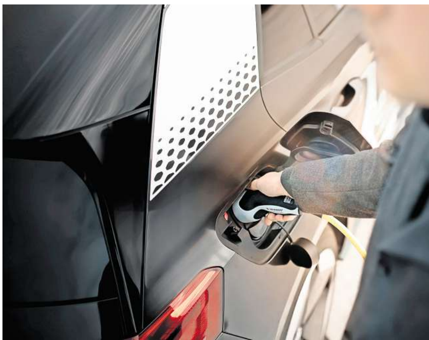
Die Technologie des bidirektionalen Ladens erlaubt es, dass ein Auto nicht nur Strom entnehmen, sondern auch zurückgeben kann.

Bei Vehicle-to-Load handelt es sich nur um ein lokales, geschlossenes Netz zwischen dem Zuhause und der Autobatterie. Das größere Potenzial – allein schon wegen der zunehmenden Zahl von E-Autos – liegt im Vehicle-to-Grid. Durch intelli-