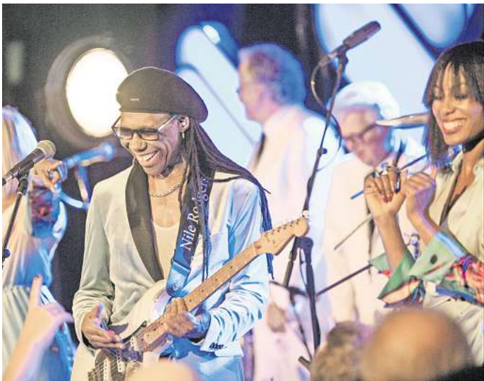
Nile Rodgers gastiert mit Chic auf der Gilde Parkbühne.

Am Sonntag, 30. Juni, ab 20 Uhr, gastiert Nile Rodgers mit Chic auf der Gilde Parkbühne. Tickets gibt es ab 71,25 Euro plus Gebühren an den bekannten VVK-Stellen sowie unter www.hannover-concerts.de oder www.myticket.de