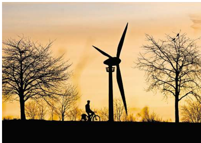
5940 zusätzliche Windräder sowie 480 Quadratkilometer Photovoltaikflächen, um klimaneutrale E-Fuels herzustellen?