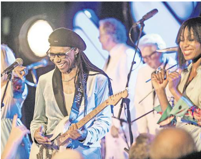
Nile Rodgers gastiert mit Chic auf der Gilde Parkbühne.

Am Sonntag, 30. Juni, ab 20 Uhr, gastiert Nile Rodgers mit Chic auf der Gilde Parkbühne. Tickets gibt es ab 71,25 Euro plus Gebühren an den bekannten VVK-Stellen sowie unter www.hannover-concerts.de oder www.myticket.de