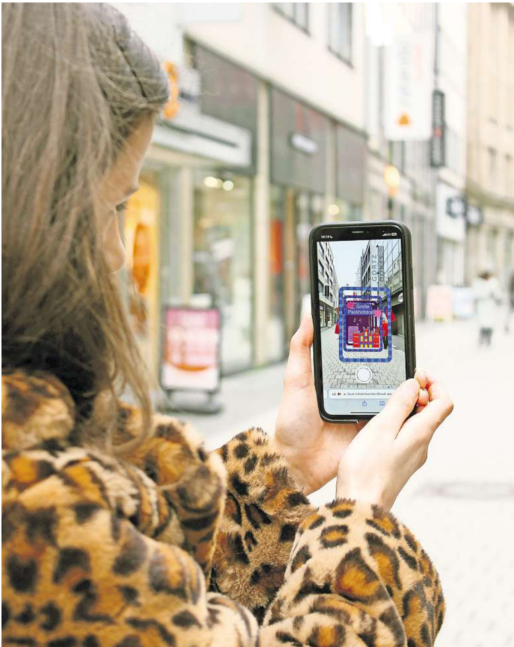
Die Straße lebt: 14 neue Augmented-Reality-Arbeiten, zu finden an ausgewählten Straßenschildern, lassen Hannovers Stadtgeschichte virtuell lebendig werden.