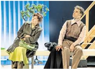
Harold und Maude: berührende Liebesgeschichte gegen alle Konventionen