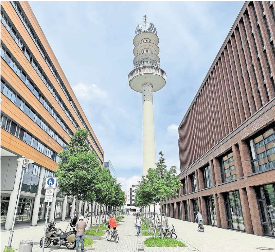
Blick aus der Rundestraße: Der ehemalige Fernsehturm Telemoritz hinterm Hauptbahnhof in Hannover, heute der VWN-Turm.

Dem Vernehmen nach könnte das Unternehmen bereit sein, einen Betrag in Höhe der Abrisskosten zum Turm dazugeben. Allerdings sollen die Sanierungskosten sehr deutlich über den