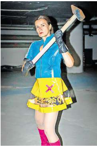
Mit dem Vorschlaghammer gegen Unterdrückung: Heldin SMASH geht auf die Straße - und lädt zu einer Hannover-Erkundung ein.

nenstadt und fragt dabei ganz eigene Weise nach Nachhaltigkeit. Die Teilnehmenden treffen sich um 14 Uhr am Künstlerhaus, Sophienstraße 2.