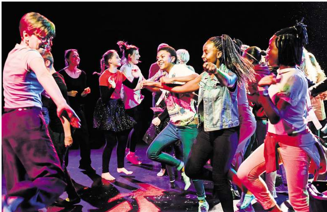
Theater, das verbindet: In insgesamt zwölf Vorstellungen zeigen rund 100 Jugendliche aus regionalen und internationalen Theatergruppen auf den Ballhof-Bühnen ihre Produktionen.

► „Secrets: Mission Black Cherry“, #sprachlernendesspiel-Projekt Goetheschule Hannover, 16.30 Uhr, Ballhof Zwei: Ein Filmteam besucht die Sprachlernklasse der Goetheschule, um eine Dokumentation zu drehen. Aber in der Klasse gibt es einige Geheimnisse. Wer verbirgt sich hinter dem Codename Black Cherry, und was ist überhaupt die Mission? ► Anschluss: „Es war einmal in Schiktitos Kiosk“, Außerschulisches #sprachlernendesspiel-Projekt Hannover: Der Kiosk um die Ecke ist vertraut, fast wie ein zweites Zuhause. Hier begegnen sich Menschen, haben eine eigene Geschichte und erleben jeden ihrer Tage anders. ► „The journey at Lampedusa“, Youth Developers Collaboration Theatre Blantyre (Malawi),