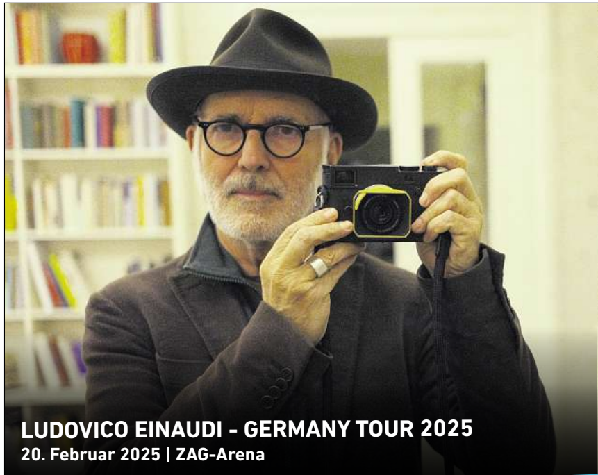
LUDOVICO EINAUDI - GERMANY TOUR 2025 20. Februar 2025 | ZAG-Arena

HANNOVER. Tauschen statt kaufen: Im Krokus, Thie 6, findet am Sonnabend, 25. Mai, von 14 bis 17 Uhr eine Kleidertauschparty statt. Maximal zehn saubere, gut erhaltene Kleidungsstücke und bis zu fünf Accessoires mitbringen und dafür bis zu 15 andere Teile mitnehmen! Anmeldung erwünscht unter STZ-KroKuS-Kultur@hannover-stadt.de oder (0511) 16834261. Am Freitag, 31. Mai, lädt dann am Krokus das große Nachbarschaftsfest zum 18. Tag der europäischen Nachbarschaft ein. Von 15 bis 19 Uhr gibt's Buffet, Musik, Spiele wie Gartenschach und VierGewinnt sowie Straßenkreiden-Malen bei freiem Eintritt. R/HR