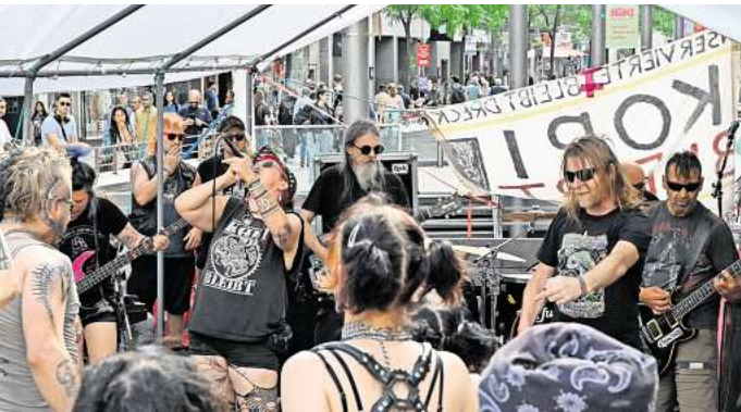
Musikalische Unterstützung: Die Band „Unwucht“ unterstützt den Protest gegen die Schließung des Punkertreffs „Kopi“ in Hannovers Nordstadt.

Das „Kopi“-Areal hatte die Stadt Hannover 1996 von der Deutschen Bahn gemietet und dem Verein gestellt. Das ist zum Problem geworden. Denn: Der Mietvertrag läuft aus und die Bahn will ihn nicht verlängern, weil das Unternehmen auf dem Gelände bauen will. Das Ringen um den „Kopi“-Erhalt dauert nun schon seit drei Jahren an. Der Ausgang ist offen.