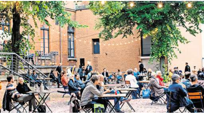
Schöner Schauplatz: Der Innenhof des Schauspielhauses und Kommunalen Kinos im Künstlerhaus (KoKi).

Der Raschplatz gilt als schwieriger Ort, da er bis vor Kurzem Treffpunkt von Drogen- und Dealerszene war. Im vergangenen Jahr hatte die Stadt zahlreiche Sport- und Musikangebote auf dem Platz eingerichtet und dadurch die Szene vertrieben. So soll es weitergehen. Nach der EM will die HVG zusammen mit dem Turn Klubb zu Hannover (TKH) ein Sportprogramm auf die Beine stellen. Ein Basketballfeld sowie ein Soccercourt – beides erfreute sich bei Jugendlichen großer Beliebtheit – sollen wieder aufgebaut werden. „Das kostenlose Sportprogramm, das über die Website ‚raschplatz-openair‘ gebucht werden kann, ist vom 18. Juli bis zum 20. September geplant“, heißt es in der Verwaltungsvorlage.