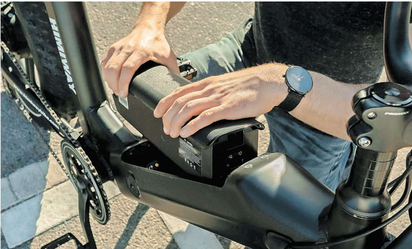
Die Reichweite des Akkus ist ein wichtiges Kriterium: Spontankäufe sollte man meiden, sondern überlegen, wofür man das E-Bike braucht und wie es ausgestattet sein soll.

Grundsätzlich sollte man sich im Vorfeld in Ruhe überlegen, wofür man das E-Bike braucht und wie es ausgestattet sein soll. Kriterien sind die Reichweite des Akkus, Power des Motors oder die Tragfähigkeit des Gepäckträgers. Von Spontankäufen raten Profis ab; ein gesundes Misstrauen empfehlen sie, ebenso wie einen Besichtigungstermin