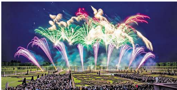
Feuerwerks-Choreografien in den Herrenhäuser Gärten

Informationen und Vorverkauf: visit-hannover.com/feuerwerk