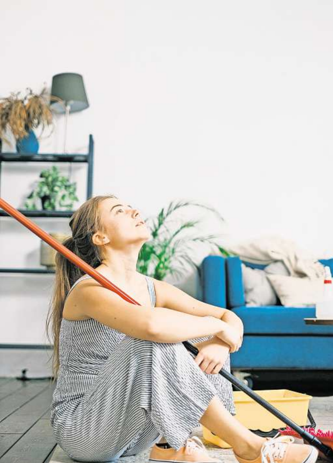
„Mein Mann war das schwierigste Kind“ – Immer mehr Frauen haben angeblich keine Lust mehr auf Partnerschaften, in denen sie sich neben ihrem Job alleine um Mann, Kinder, Haushalt und Familienmanagement kümmern müssen.