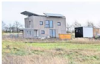
Projekt geplatzt: Das Ecovillage ist gescheitert – jetzt will die Stadt das Gelände zurückkaufen.

mung. „Für die Stadt ist dieses Gelände absolut wichtig, denn wir haben eine Reihe von Zielen beim Wohnungsbau“, sagte SPD-Fraktionschef Lars Kelich. Man habe sich verpflichtet, bis zum Jahr 2035 rund 17.000 neue Wohnungen zu schaffen – das gelinge nicht allein durch Innenstadtverdichtung. Das Areal am Kronsberg werde somit dem Wohnungsbau zugeführt, in Teilen auch für neue Kleingärten. „Auch hier werden Flächen benötigt“, so Kelich.