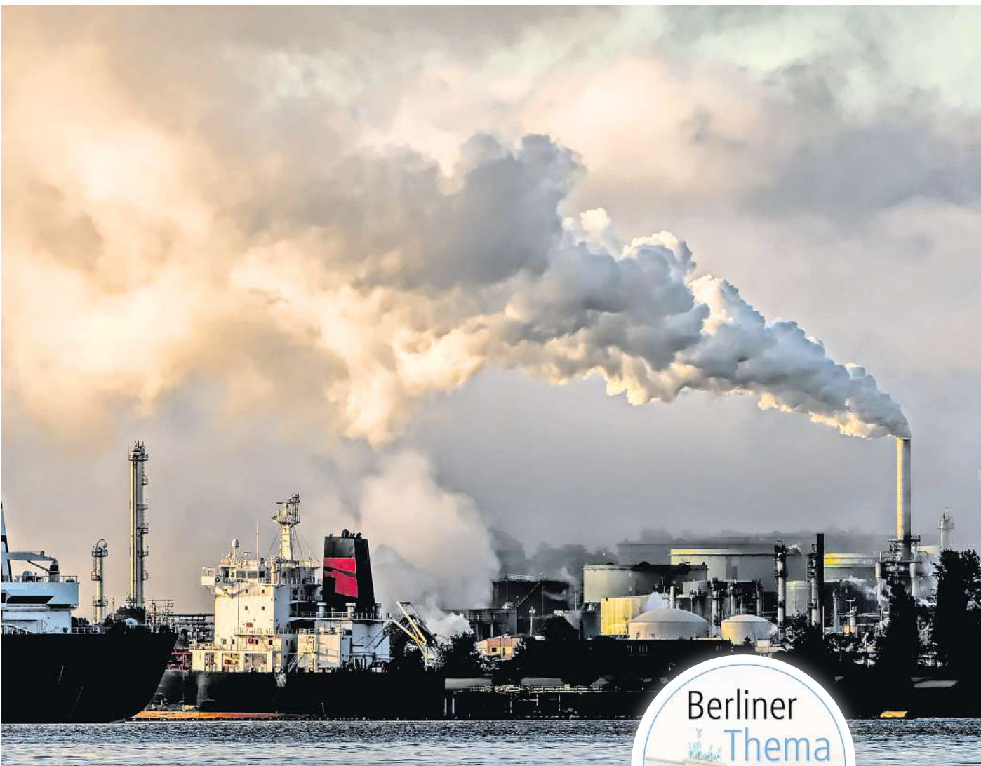
Die Produktion von CO2 ist einer der Hauptverursacher des Klimawandels.

Die unterirdische Speicherung des im industriellen Maßstab anfallenden Klimagas CO2 wird im Englischen „Carbon Capture and Storage“ ge-