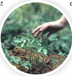
In der Führung geht es unter anderem um biologischen Pflanzenschutz.

Bei zu vielen Teilnehmenden kann es sein, dass nicht alle Wünsche berücksichtigt werden können, wofür die Mitarbeitenden um Verständnis bitten. Der Eintritt zu den Sonntagmorgen-Veranstaltungen ist grundsätzlich frei, eine Spende für das Schulbiologiezentrum ist jedoch willkommen. R/HR