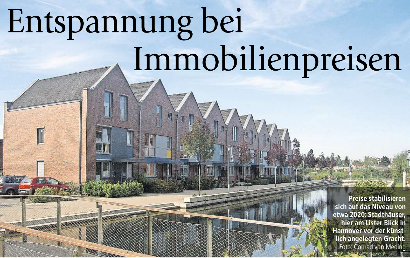
Preise stabilisieren sich auf das Niveau von etwa 2020: Stadthäuser, hier am Lister Blick in Hannover vor der künstlich angelegten Gracht.

Eigentumswohnungen: Bei den Eigentumswohnungen, im Stadtgebiet Hannover die am häufigsten gehandelte Immobilienklasse, ging der Preis pro Quadratmeter von 3260 auf 2890 Euro zurück. Im Umland sank er wegen des niedrigeren Preisniveaus etwas moderater von 2500 auf 2220 Euro pro Quadratmeter. Das Immobilienportal Immowelt, das im Gegensatz zu den Gutachterausschüssen nicht die wahren Verkaufspreise auswerten kann, sondern nur die von Verkäufern erhofften Preisangebote kennt, diagnostizierte Hannover am Donnerstag als die deutsche Großstadt mit den am stärksten gesunkenen Preisen bei Eigen-