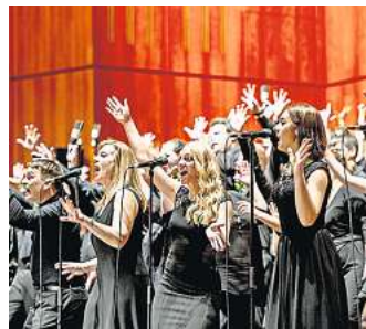
Mitmachen können alle, die Freude am Singen haben.

singOUT Hannover am 29. März 2025. Im Theater am Aegi Hannover präsentieren dann die 200 Stimmen eine Musikexplosion der Extraklasse. Um die Proben effektiver zu gestalten, erhalten die Sänger ein Songbook sowie Übungs-Dateien. Mitmachen können alle, die Freude am Singen haben sowie die Dynamik eines Mass-Choirs erleben möchten. Sei dabei! Anmeldung unter: hannover@singout-projekt.de