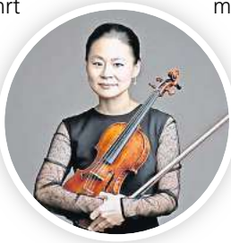
Violinvirtuosin Midori tritt bei Konzerten im NDR-Funkhaus auf.