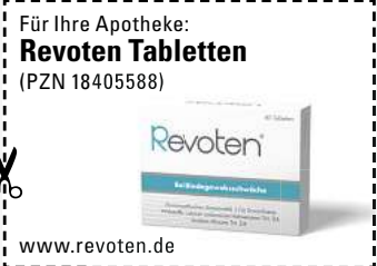
Abbildung Betroffenen nachempfunden. REVOTEN. Wirkstoffe: Acidum silicicum Trit. D4, Calcium carbonicum Hahnemannii Trit. D4. Die Anwendungsgebiete entsprechen den homöopathischen Arzneimittelbildern. Dazu gehört: Bindegewebsschwäche. www.revoten.de • Zu Risiken und Nebenwirkungen lesen Sie die Packungsbeilage und fragen Sie Ihre Ärztin, Ihren Arzt oder in Ihrer Apotheke. • Remitan GmbH, 82166 Gräfelfing

Oft stehen wir Frauen vor einem scheinbar unlösbaren Problem: Wie werde ich die schlaffe Haut, die lästigen Dellen und Falten los? Diese unschönen Erscheinungen entstehen durch ein schwaches Bindegewebe, also von innen. Wissenschaftlern ist es gelungen, ein Arzneimittel mit einem dualen Wirkstoffkomplex zu entwickeln (Revoten Tabletten, rezeptfrei, Apotheke), der von innen wirkt! Die zwei enthaltenen natürlichen Arzneistoffe dienen laut den Ergebnissen der Arzneiprüfungen und der Pharmakologie als Anregungs- sowie Heilmittel für die nachlassenden Stoffwechselvorgänge im Bindegewebe. So können unschöne Anzeichen von Bindegewebsschwäche wie schlaffe Haut und Cellulite natürlich von innen bekämpft werden.