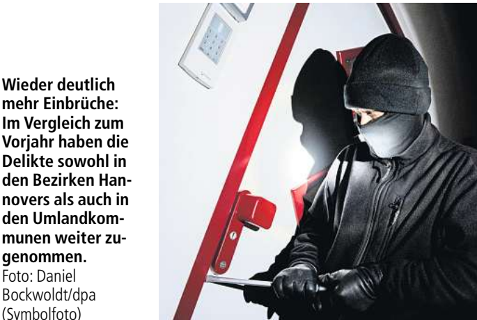
Wieder deutlich mehr Einbrüche: Im Vergleich zum Vorjahr haben die Delikte sowohl in den Bezirken Hannovers als auch in den Umlandkommunen weiter zugenommen. Foto: Daniel Bockwoldt/dpa (Symbolfoto)

Immerhin: Dort reicht der aktuelle Wert von 6,6 Taten immer noch für den dritten Platz (2022: 7,9). Zwischen Springe und Pattensen drängt sich in diesem Jahr allerdings Laatzen: Die Kommune verzeichnet 2023 bloß 6,1 Einbrüche je 10.000 Einwohner. Im Vorjahr lag der Wert mit 10,7 Delikten noch deutlich höher.