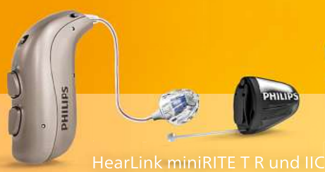
HearLink miniRITE T R und IIC

Überzeugen Sie sich von Philips HearLink Hörgeräten, die wir Ihnen sowohl als kleine Im-Ohr Hörgeräte als auch praktische, wiederaufladbare Hinter-dem-Ohr Hörgeräte auf Ihren Hörverlust anpassen.