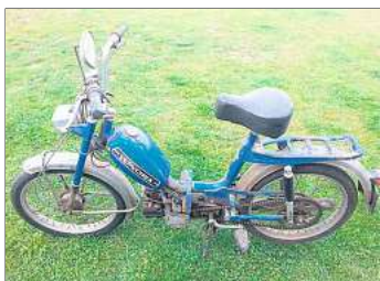
Suche altes Mofa Moped Motorrad auch defekt oder total verrostet ☎ (01 51) 11 52 02 65