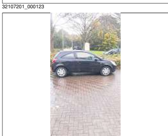
Gepflegter Opel Corsa S-D 138000 km, Benzin, TÜV 06/24: 3000 Euro, Tel. 0157/76009423 ☎ (01 76) 30 35 31 49