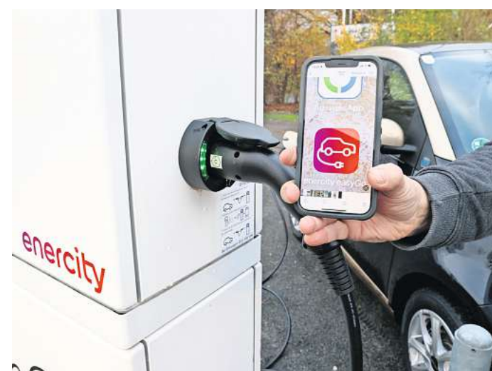
Enercity bietet seinen Kunden jetzt eine neue App für E-Autos.

Alle Wünsche indes könne Enercity nicht erfüllen. Dazu gehöre auch, dass nicht jeder Standort mit Grafik und Fotos dargestellt werden könne. „Unser Ziel ist es, dass auch Ortsunkundige die Ladepunkte schnell finden“, sagt der Sprecher. Deshalb arbeite Enercity mit Daten des Onlinedienstes Google Street View – allerdings eben nur im öffentlichen Verkehrsraum. „Wenn eine Ladesäule auf dem Parkplatz eines Supermarktes oder einer Bank steht, dann funktioniert das leider nicht.“