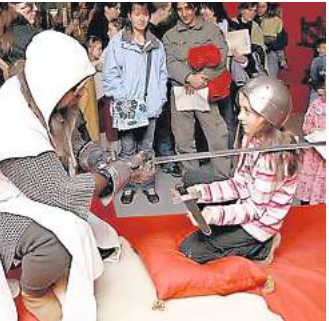
Ritterschlag? Gibt es im aufhof.

An zwei Terminen werden Siegel gegossen aus verschiedenem Material. Am 12. Dezember von 15 bis 18 Uhr entstehen in der Zeit von 15 bis 18 Uhr Seilsiegel und die Teilnehm-