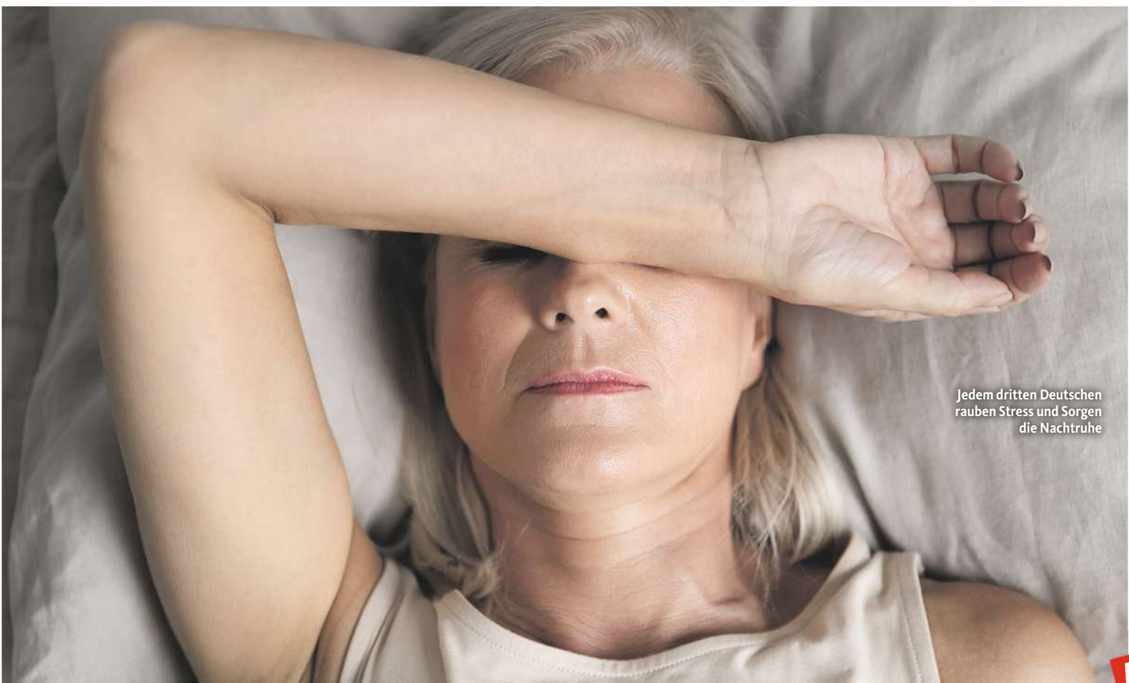
Jedem dritten Deutschen rauben Stress und Sorgen die Nachtruhe

Wer nachts schlecht schläft, hat oft einen zu geringen GABA-Spiegel. GABA (Gamma-Aminobuttersäure) gilt als körpereigener