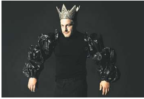
Das Schauspiel Hannover zeigt „Der kleine Prinz“.