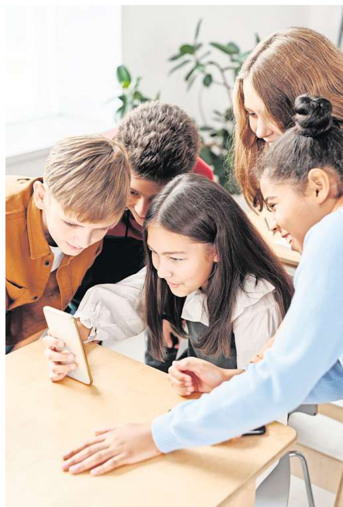
Und alle lesen mit: Kinder sollten darauf achten, was sie über sich in sozialen Netzwerken preisgeben.

1. Bilder sorgfältig überprüfen: Eltern können ihr Kind dazu ermutigen, sich nicht vom Zeitdruck irritieren zu lassen. Sie sollten zum Beispiel niemals freizügige Bilder posten, nur um innerhalb des Zeitlimits zu bleiben. Schließlich bleiben Bilder den ganzen Tag auf BeReal und können somit von allen gesehen werden, mit denen sie geteilt wer-