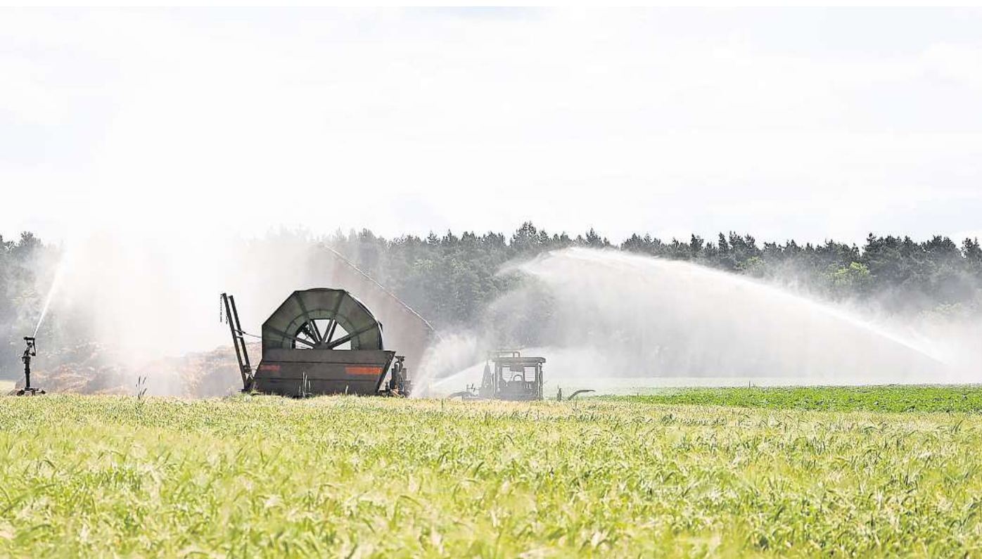
Wasserspiele: Die Beregnungskanonen laufen auf den Äckern in Uetze und Burgdorf rund um die Uhr. Das Grundwasser für die Beregnungskanonen wird mit dieselbetriebenen Aggregaten an die Oberfläche gepumpt.

Zwar habe der regenreichere Sommer in diesem Jahr dazu geführt, dass sich der Grundwasserkörper etwas erholen konnte. Das reiche aber nicht aus, um die Verluste der Vorjahre zu kompensieren. „Früher wurden die