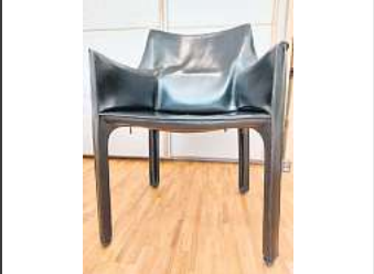
Cass Cup Sessel Leder Schwarz mit klei- nen Gebrauchsspuren 3 x Verfügbar.Preis pro Sessel 300€. Abholung Oststadt- Tel.01716235931

Dr. Fachbetrieb für Entrümpelung und Haushaltsauflösung mit Wertverrech- nung. ☎ (0511) 49 94 95