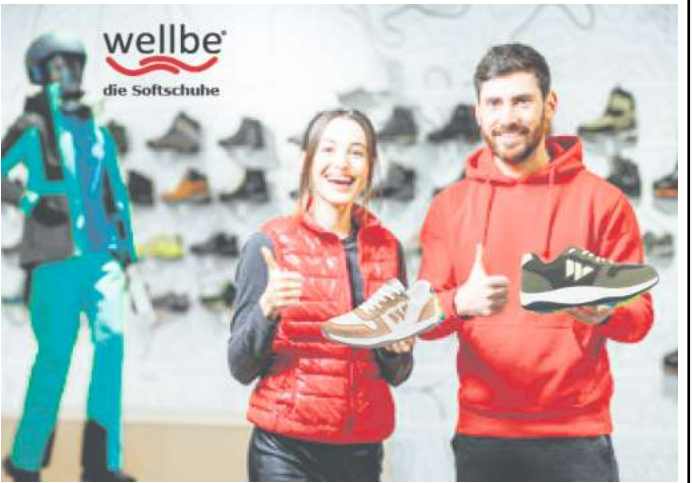
Das Team von ZOPICK, Walsroder Straße 41 in Langenhagen freut sich auf Ihren Besuch

wellbe die Softschuhe sind ultra leichte, weiche Komfortschuhe mit einfacher, sanfter Aktivität in