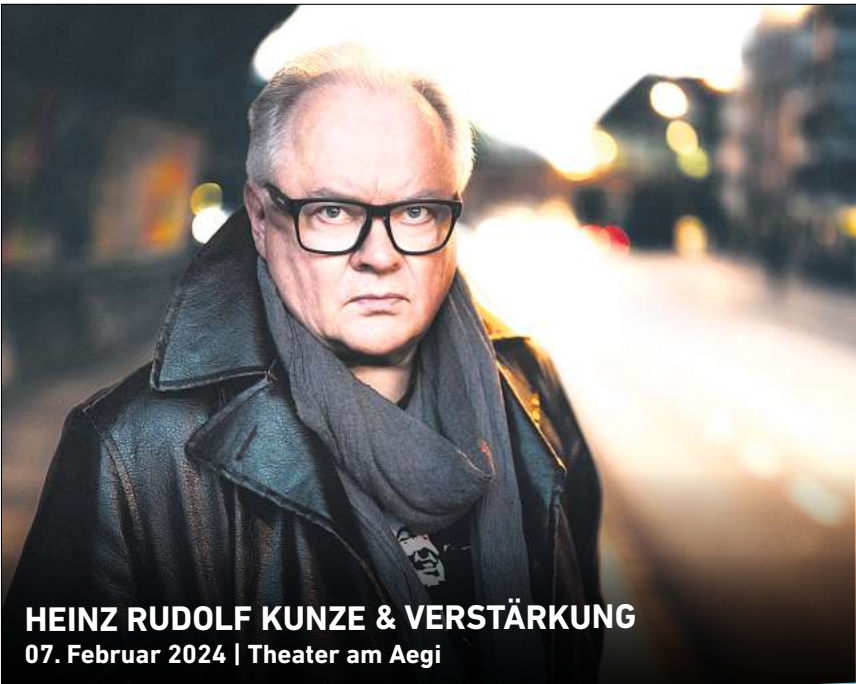
HEINZ RUDOLF KUNZE & VERSTÄRKUNG 07. Februar 2024 | Theater am Aegi

Ihr persönlicher Ticketservice der HAZ & NP