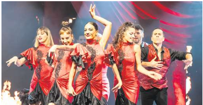
„Sentimientos“ im GOP läuft bis zum 5. November: Flamenco!

■ „Sentimientos“ läuft bis 5. November im GOP (Georgstraße 36), Vorstellungen dienstags bis sonntags. Tickets kosten 35 bis 49 Euro. Infos unter www.variete.de