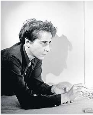
Mit den Hannah-Arendt-Tagen erinnert die Stadt Hannover an die 1906 in Linden geborene, international bekannte Politiktheoretikerin. Hannah Arendt, aufgenommen im Jahre 1944.