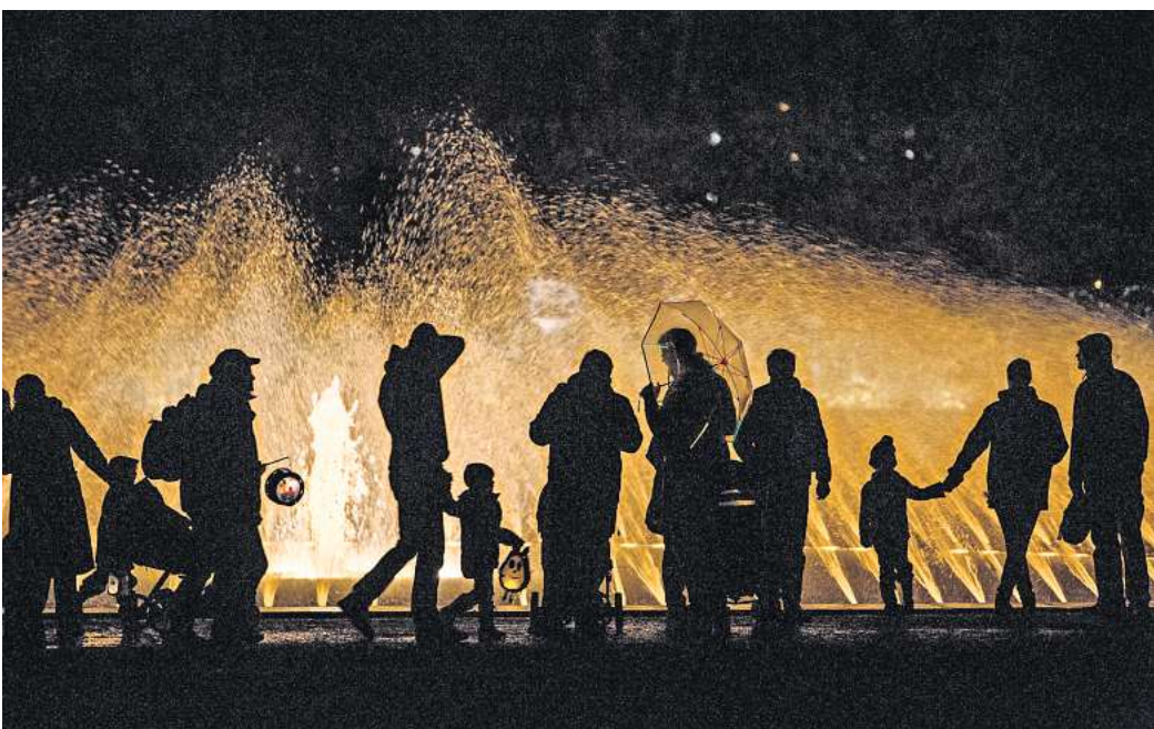
Beliebtes Herbst-Erlebnis: Illumination und Laternenumzug im Großen Garten.

Erwachsene zahlen 3 Euro, Kinder bis 14 Jahre (ohne Baumscheibe) 2 Euro Eintritt. Kinder bis sechs Jahre haben freien Eintritt.