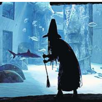
Im Sea Life sind die Hexen los.

HANNOVER. Der Vorverkauf für das beliebte Laternenfest im Großen Garten hat begonnen. Aufgrund der großen Nachfrage wird dringend dazu geraten, diesen zu nutzen, wenn man am Sonntag, 29. Oktober mit dabei sein möchte, wenn es mit Stelzenfiguren und Musikzügen durch den stimmungsvoll illuminierten Garten mit seinen Wasserspielen geht. Das Laternenfest findet an diesem Tag von 16.30 bis 19 Uhr statt. Mit der Illumination und dem Lichterglanz der Laternen verwandelt sich der Garten noch einmal in einen magischen Ort mit beeindruckender Atmosphäre. Eigene Laternen und Snacks dürfen wie immer mitgebracht werden. Einlass ist von 16.30 bis 18 Uhr über das Milchtor und das Prinzen-Tor. Der Eintritt kostet für Erwachsene und Kinder ab zwölf Jahren 5 Euro, Kinder unter