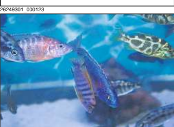
Aquaristikbörse in Hannover Samstag den 7.10.von 15-17 Uhr in der IGS Roder- bruch"Rotekreuzstr.23"Eintritt 2€ ver- schiedene Zierfische,Pflanzen und Zube- hör.

Gebrauchte Küche mit Geräten günstig abzugeben ☎ (01 62) 6 51 98 54