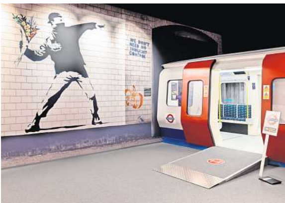
Auch Teil der Ausstellung: Das Werk Flower Thrower.

Insgesamt präsentieren die Aussteller mehr als 150 Werke. Zu sehen sind Graffiti, Fotografien, Skulpturen, Videoinstallationen und Drucke auf verschiedenen