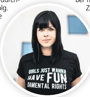
Mareike Fallwickl

HANNOVER. Die österreichische Autorin Mareike Fallwickl, Jahrgang 1983, landete mit ihrem vierten Roman „Die Wut, die bleibt“ einen Erfolg. Im Lockdown des Jahres 2021 schrieb sie von einer Frau, die sich, der Mutterrolle überdrüssig, vom Balkon in den Tod stürzt, von ihrer besten Freundin Sarah, die unversehens zur Ersatzmutter wird, und von Tochter Lola, die sich gegen das Patriarchat radikalisiert. Das Schauspiel Hannover sicherte sich die Rechte an der Uraufführung recht früh und brachte sie als Koproduktion mit den Salzburger Festspielen auf die dortige Bühne. Es war ein durchschlagender Erfolg. Seither sind alle vergangenen und zukünftigen Vorstellungen ausverkauft und heftig bejubelt. Am 7. Oktober kommt Fallwickl zum Publikumsgespräch in den Ballhof Eins. Auch dafür gibt es keine Karten mehr.