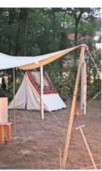
Lagerleben: Es geht auf eine bunte Zeitreise.

Force“ mit Tanzdarbietungen und Märchenereignissen. Geschichte zum Anfassen bietet das Lagerleben zwischen Wikinger-Zeit und Hochmittelalter. Neben Handgemachtem wie Schmuck, Leder- und Holzwaren gibt es ein Badehaus und Aktionen zum Mitmachen, unter anderem Bogen- und Armbrustschießen, Henna-Malerei und Schwertbasteln. Ein Höhepunkt ist die Waffen- und Feuershow. Zwischen Met-Taverne und Mandelei ist für eine passende Stärkung zwischendurch gesorgt.