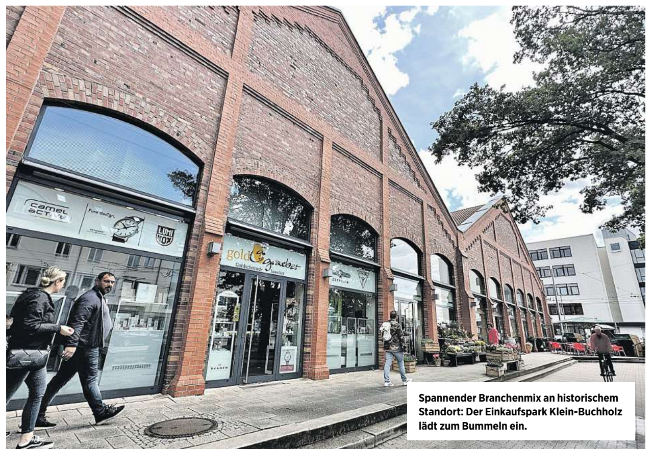
Spannender Branchenmix an historischem Standort: Der Einkaufspark Klein-Buchholz lädt zum Bummeln ein.

■ Highlight des Festtages ist jedoch das Gewinnspiel. Wer seine Teilnahmekarte mit Namen und Adresse in die Trommel wirft, kann sich mit ein bisschen Glück über einen Reisegutschein im Wert von 5000 Euro vom ITA Reisecenter freuen.