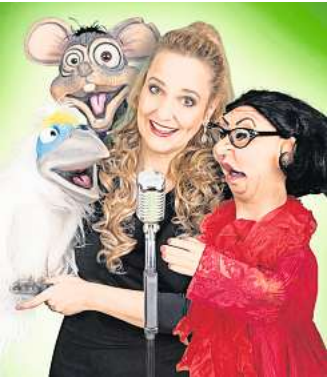
Start ins September-Programm: Murzarella tritt mit Bauchgesängen und tanzenden Puppen in Desimos Spezial-Club auf.

Gleich am nächsten Abend geht es weiter: Am Dienstag, 5. September, liefert Katie Freudenstuss unter dem Motto „Nichts bleibt, wie es wird“ (nicht nur) am Flügel Impro, Kabarett, Comedy und Musik. Gespickt mit einzigartigen Momentaufnahmen, fasst sie ab 20.15 Uhr die großen und kleinen Alltagsdinge in grandiose Kompositionen.