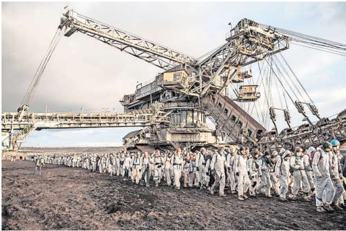
„Ende-Gelände“: Proteste in Leipzig.

Die Öffnungszeiten sind Dienstag bis Donnerstag von 15 bis 19 Uhr, Sonnabend von 15 bis 20 Uhr und Sonntag von 14 bis 18 Uhr. Der Eintritt ist frei, Spenden werden jedoch gern angenommen. RED