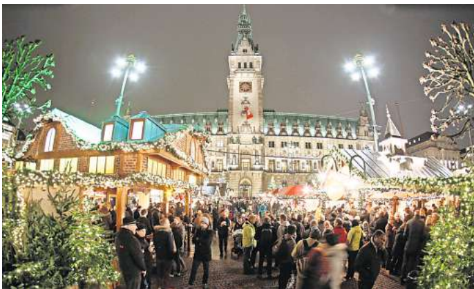
Erfahrung: Seit 2010 richtet Circus Roncalli den Hamburger Weihnachtsmarkt auf dem Rathausplatz aus. Jetzt kommt das Unternehmen auch nach Hannover.

Der niedersächsische Ministerpräsident Stephan Weil begrüßte die Pläne. „Es darf nicht länger sein, dass die Stromverbraucherinnen und -verbraucher in den Regionen, die die erneuerbaren Energien vorantreiben, finanziell schlechter gestellt werden“, sagte der SPD-Politiker am Sonntag. De facto gebe es bereits unterschiedliche Strompreiszonen. Derzeit zahlten die Stromkunden im Süden weniger als diejenigen im Norden. „Es steht für mich außer Frage, dass dies mit Blick auf die notwendige