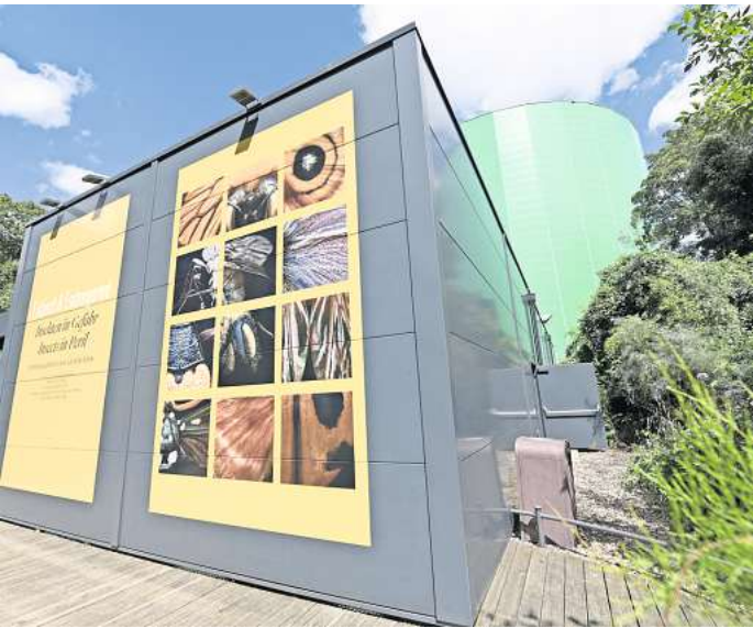
In der Rotunde zeigt der Zoo ab September für gut sechs Monate die Makro-Fotoausstellung „Insekten in Gefahr“ von Levon Biss.

suches, für Tagesgäste also kostenlos. Am Donnerstag, Freitag und Sonnabend jeweils in der Zeit von 17 bis 20 Uhr ist die Ausstellung dann auch für externe Besucher zu sehen, die nicht in den Zoo wollen. Sie erreichen die Rotunde über den Zoo-Parkplatz. Erwachsene zahlen dann 6 Euro, Kinder 2 Euro. Für Schüler und Klassen arbeitet der Zoo noch ein spezielles Besucherkonzept aus. Begleitend zur Ausstellung gibt es noch Erläuterungen zu den Risiken, denen die Insekten ausgesetzt sind – und der Zoo zeigt Lösungen auf, wie jeder Besucher den Insekten im Alltag helfen kann. Die lokale Initiative „Hannover summt“ ist hierbei Partner.