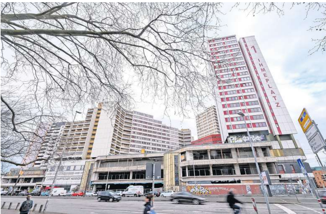
Haupteigentümer überschuldet? Die Eigentümergemeinschaft lässt prüfen, ob die Immobiliengeschäfte von Großeigentümer Lars Windhorst auf solider Basis abgewickelt werden.

Der Finanzspekulant Windhorst hatte 2019 über sein Firmengeflecht die Gewerbeareale in dem Großkomplex übernommen und vollmundig angekündigt, die ruiniösen Immobilienbereiche mit Millioneninvestitionen wieder flottzumachen. Passiert ist wenig, und zum Baustillstand gesellen sich jetzt