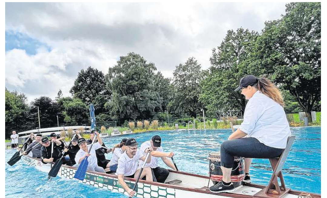
TRAINING IM 25-METER-FREIBADBECKEN: Das Team der Rathausterrassen macht mit beim Drachenboot-Fun-Cup am 26. und 27. August im Badepark Berenbostel.