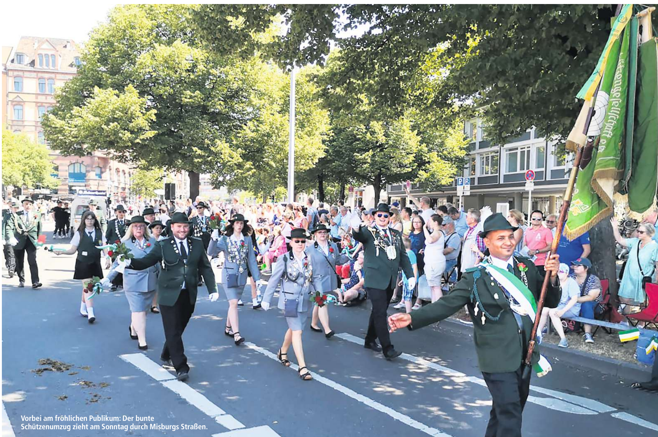
Vorbei am fröhlichen Publikum: Der bunte Schützenumzug zieht am Sonntag durch Misburgs Straßen.

Die Eintrittskarten für den Eröffnungsabend können ab sofort zum Preis von 10 Euro im Vorverkauf per E-Mail und mit Vorabüberweisung über info@vgi-misburg-anderten.de erworben werden. Barzahler bekommen ihre Karten bei der Gebäudereinigung Schneider,