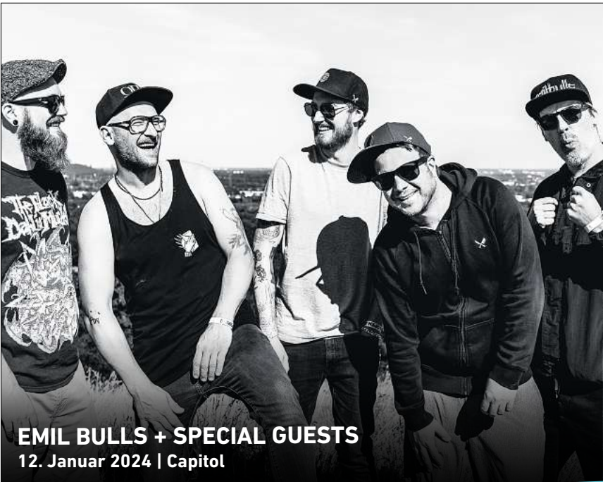
EMIL BULLS + SPECIAL GUESTS 12. Januar 2024 | Capitol

HANNOVER. „Alle singen – all night long“ ist am 28. August auf der Cumberlandischen Bühne, Prinzenstraße 9, Programm: Vom ersten Moment bis zur letzten Note singen beim „Sing dela sing“-Abend hunderte Leute im Publikum gemeinsam Pop-songs. Die Texte kommen auf die große Leinwand, die Begleitung von Musik-Profis, und alle singen mit. Los geht es am Montag, 28. August, um 20 Uhr. Eintritt: 20, ermäßigt 5 Euro. RED