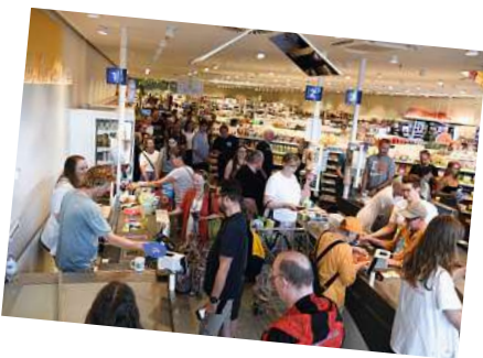
Ganz schön viel los bei dm – rund 500 Fans kamen zur Kassieraktion.

Bühne frei Bevor der Scheck im Wert von 8.000 Euro überreicht wurde, spielte die Band unplugged einen ihrer bekanntesten Songs als Dankeschön für das tolle Event und die Unterstützung des guten Zwecks. Nach diesem furiosen Auftritt bei dm rockte die Band am Abend die ausverkaufte Parkbühne in Hannover.