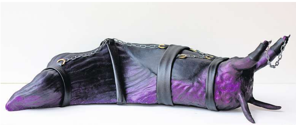
Sofia Baronner: Slug Slut, 2023.