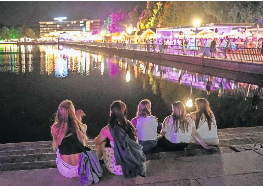
Stimmungsvoll: Auch in diesem Jahr soll der See die Hauptattraktion sein.

MASCHSEEFEST: 200 Livedarbietungen auf verschiedenen Bühnen rund um den See