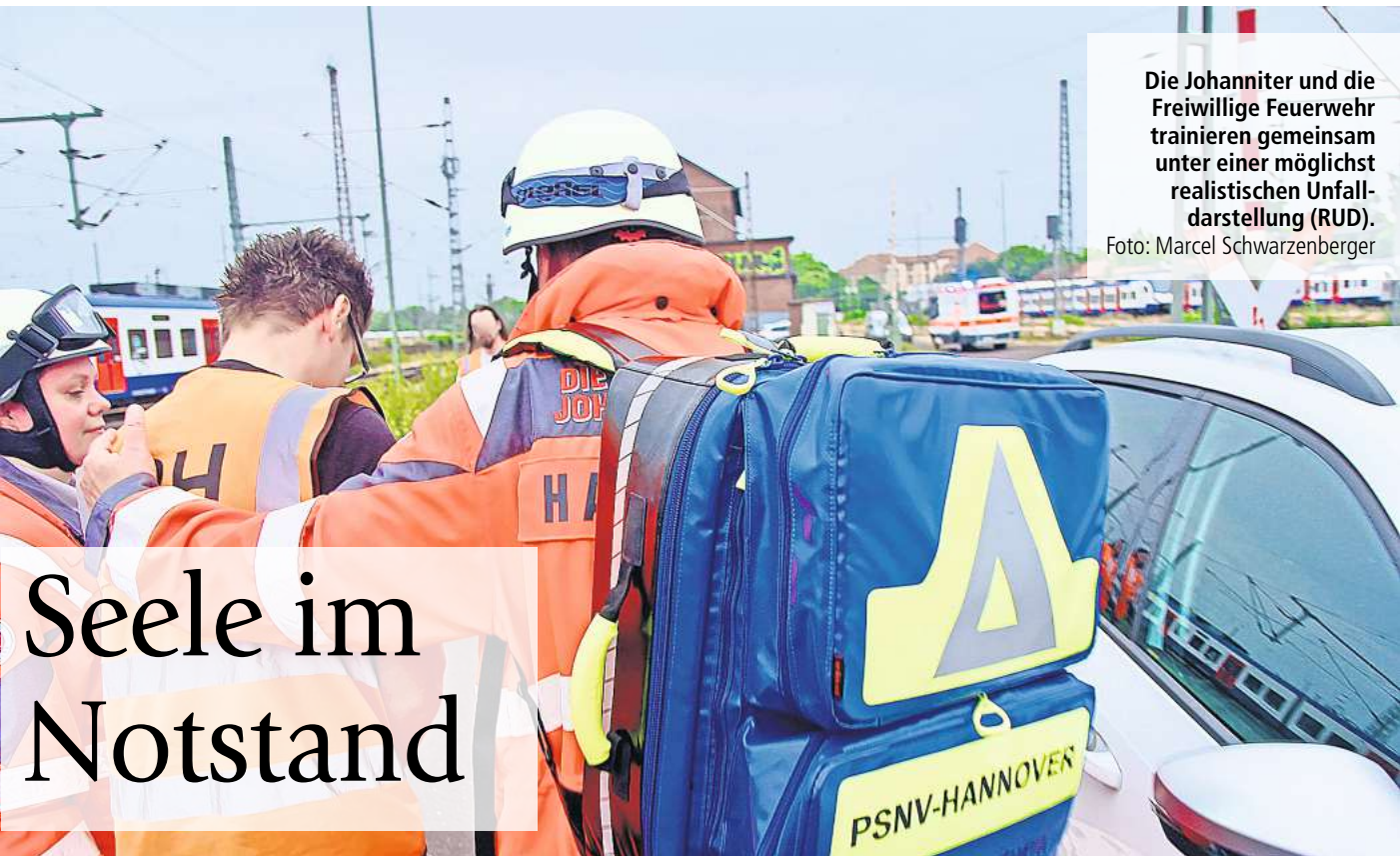
Die Johanniter und die Freiwillige Feuerwehr trainieren gemeinsam unter einer möglichst realistischen Unfall-darstellung (RUD).