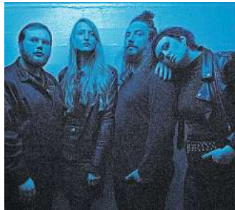
Live: Parting Gyfts aus Hannover.

Post-Punk-Manier. Eingängige, vom Indie Rock beeinflusste Melodien komplettieren den Sound der fünfköpfigen Band. Loose Lips spielen Stoner- und Alternative-Rock, gepaart mit einer ordentlichen Portion Grunge und Post-Punk Einflüssen. Fatigue sind grungy Riot Punk aus Berlin