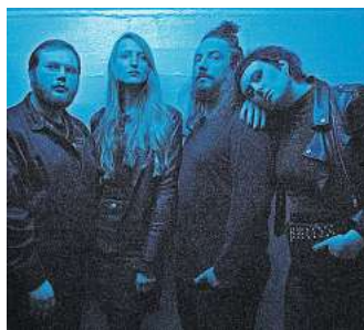
Live: Parting Gyfts aus Hannover.

Post-Punk-Manier. Eingängige, vom Indie Rock beeinflusste Melodien komplettieren den Sound der fünfköpfigen Band. Loose Lips spielen Stoner- und Alternative-Rock, gepaart mit einer ordentlichen Portion Grunge und Post-Punk Einflüssen. Fatigue sind grungy Riot Punk aus Berlin