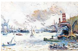
Maximilien Luce (1858-1941): Hafen von Rotterdam, um 1908.

rischen Auseinandersetzungen. Gemälde bannen bahnbrechende Neuerungen und ihre Auswirkungen auf unsere Welt in Öl. Und die Naturkunde hält nicht nur die Vorbilder bereit, an denen die menschlichen Innovationen sich orientieren – sie zeigt auch einige beeindruckende Gegenbeispiele, die deutlich machen, dass Schnelligkeit nicht