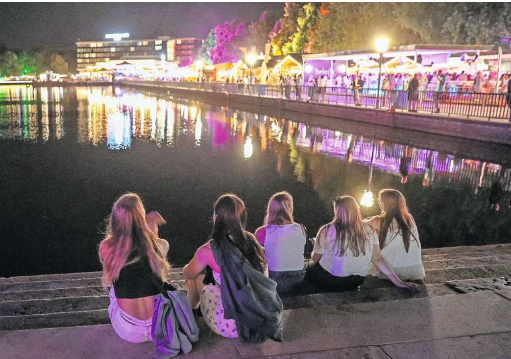
Stimmungsvoll: Auch in diesem Jahr soll der See die Hauptattraktion sein.

MASCHSEEFEST: 200 Livedarbietungen auf verschiedenen Bühnen rund um den See