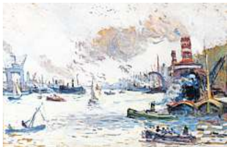
Maximilien Luce (1858-1941): Hafen von Rotterdam, um 1908.

rischen Auseinandersetzungen. Gemälde bannen bahnbrechende Neuerungen und ihre Auswirkungen auf unsere Welt in Öl. Und die Naturkunde hält nicht nur die Vorbilder bereit, an denen die menschlichen Innovationen sich orientieren – sie zeigt auch einige beeindruckende Gegenbeispiele, die deutlich machen, dass Schnelligkeit nicht