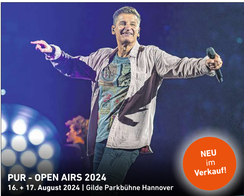
PUR - OPEN AIRS 2024 16. + 17. August 2024 | Gilde Parkbühne Hannover

Tickets gibt es ab 21,10 Euro im Online Vorverkauf: spider-promotion.de/tickets oder Restkarten für 25 Euro an der Eingangskasse.