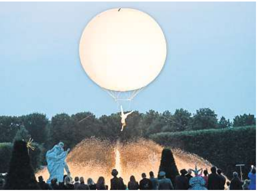
Als Highlight in diesem Jahr gab es unter anderem die Heliosphäre.