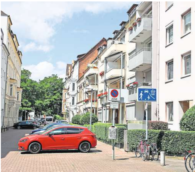
Ein möglicher Superblock: Das Gerberviertel in der Calenberger Neustadt. Der Bezirksrat Mitte hat dieses als Pilotprojekt vorgeschlagen.

Auch die Regionspolitik hat dazu bereits einen Beschluss gefasst. Das Konzept der Superblocks taucht im Verkehrsentwicklungsplan 2035+ auf, der im Juni verabschiedet wurde. „Nicht nur in der Landeshauptstadt ist das Bilden von Quartiersblöcken eine sinnvolle Maßnahme, die zu weniger Parksuchverhalten und damit lebenswerteren und sicheren Wohnquartieren beitragen kann“, heißt es darin. Insgesamt sollen regionsweit 50 Blöcke umgesetzt werden, in denen der Durchgangsverkehr ausgeschlossen werden soll, so der Plan der Region.