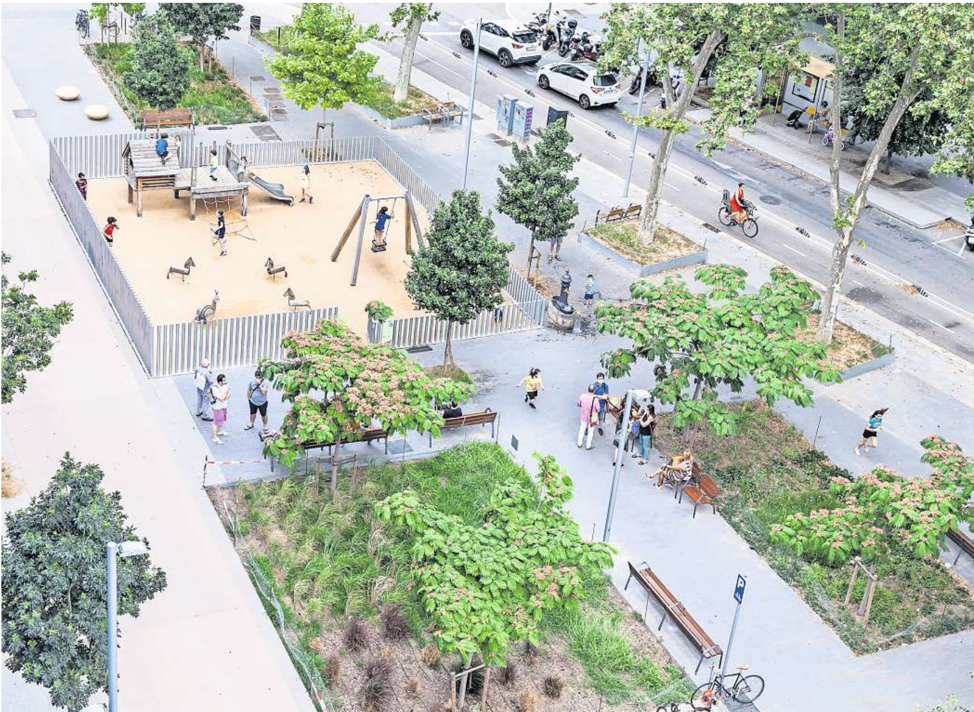
Mehr Grün und Platz für Kinder: Barcelonas Stadtteil Poblenou gehörte zu den ersten, in dem das Konzept der Superblocks umgesetzt wurde.

Noch in diesem Jahr sollen beauftragte Büros drei geeignete Quartiere ausfindig machen