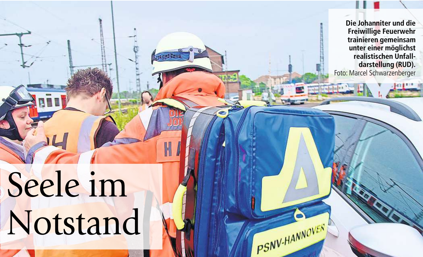
Die Johanniter und die Freiwillige Feuerwehr trainieren gemeinsam unter einer möglichst realistischen Unfall-darstellung (RUD).