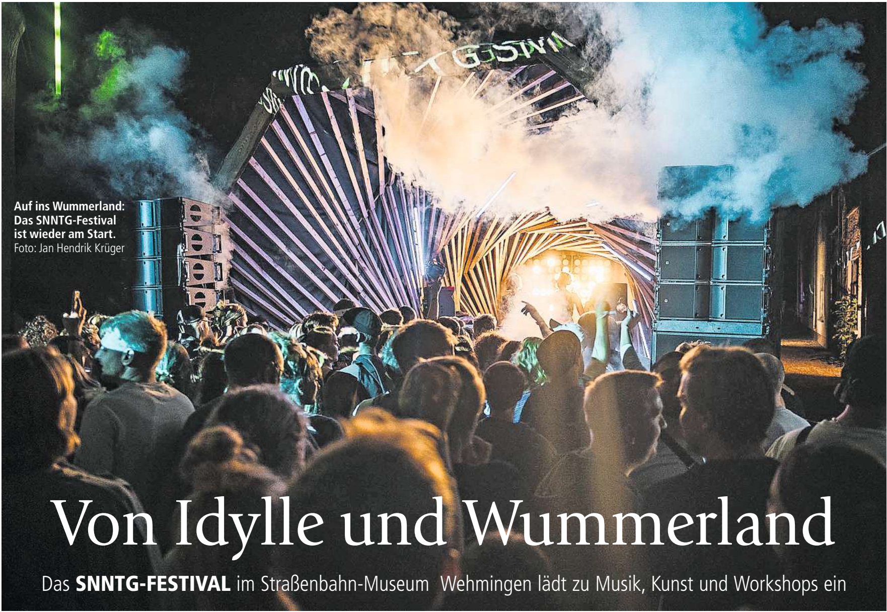
Auf ins Wummerland: Das SNNTG-Festival ist wieder am Start.