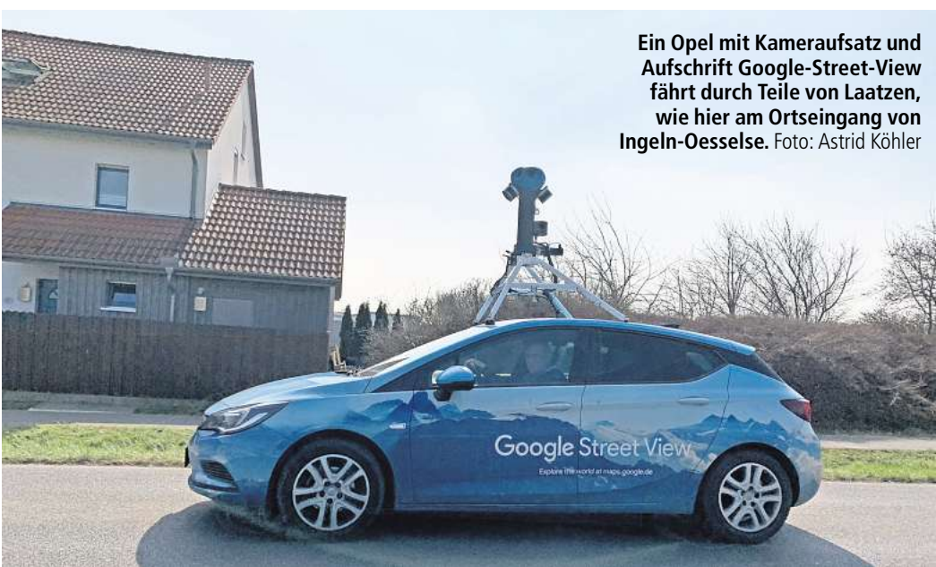
Ein Opel mit Kameraaufsatz und Aufschrift Google-Street-View fährt durch Teile von Laatzen, wie hier am Ortseingang von Ingeln-Oesselse.

Deutschland ist bis heute ein blinder Fleck bei Street View. Denn: Viele machten beim Start 2010 von ihrem Recht Gebrauch, die Ansicht der Gebäude, in denen sie wohnen, unkenntlich zu machen. Google aktualisierte den Dienst hierzulande seitdem nicht mehr. Wer sein Wohnhaus auch nach der Aktualisierung verpixelt haben möchte, muss einen neuen Widerspruch einreichen – die alten gelten nicht mehr. Gesichter und