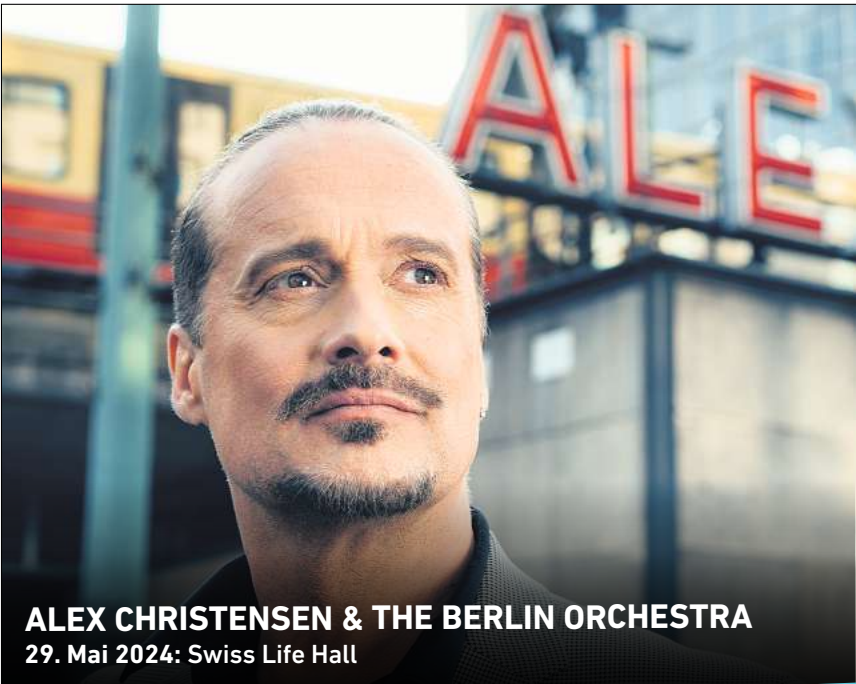
ALEX CHRISTENSEN & THE BERLIN ORCHESTRA 29. Mai 2024: Swiss Life Hall

Nähere Informationen und Anmeldung: jukiks-programm.de