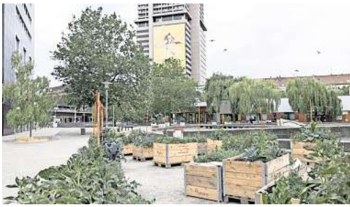
Viel Grün, wenig los: Der Andreas-Hermes-Platz bleibt bisher weitgehend verlassen.

Die Stadt will den Weißekreuzplatz in Zonen aufteilen – für Spiel- und Sportangebote sowie Außengastronomie. Ab Juli soll ein Teil der Lister Meile, die am Platz entlang führt, für den Autoverkehr gesperrt werden, um mehr Raum für Freizeitaktivitäten zu gewinnen. Ende des Monats beginnt der Masala-Weltmarkt mit Verkaufsständen auf dem Platz. Ab 4. Juli startet ein Schwärmekunstprojekt auf dem Weißekreuzplatz: Unter Anleitung einer Künstlerin können alle Bürger an einer überdimensionalen Skulptur mitarbeiten. Wie sich das alles auf den Platz auswirkt, bleibt abzuwarten.