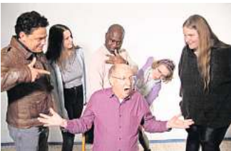
Das Ensemble Fragmente gastiert im Theater in der List.