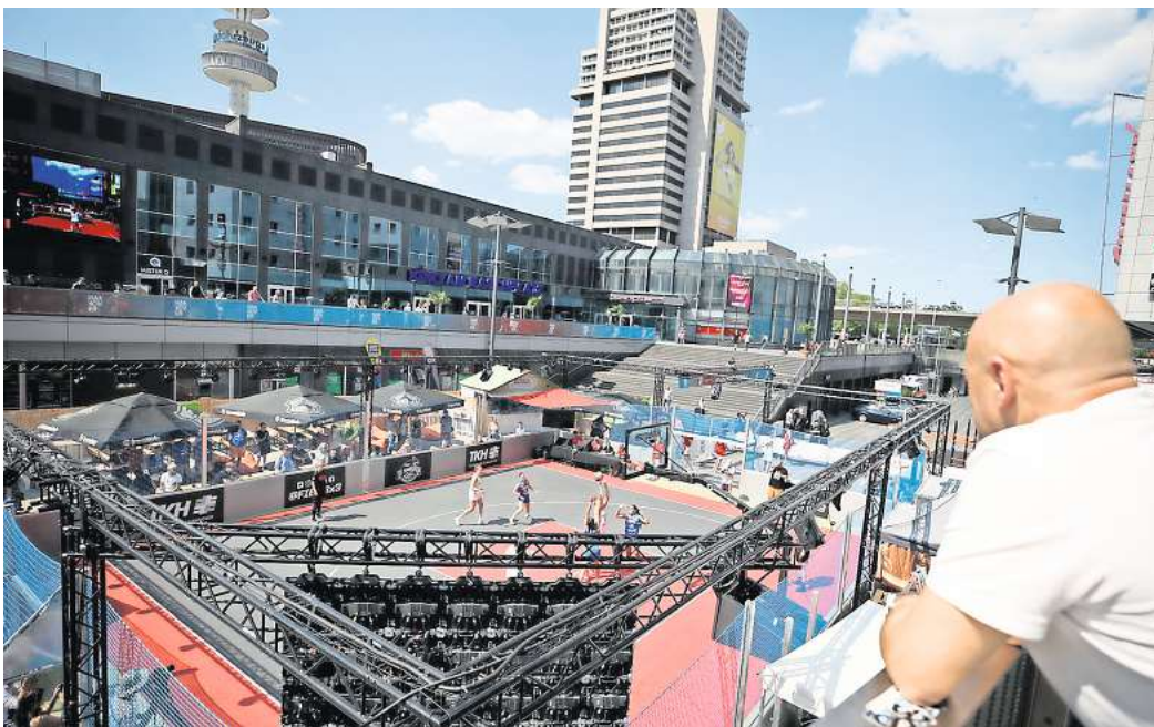
Konzerte, Kinderfest, Afterworkparty und vieles mehr lockten die Hannoveranerinnen und Hannoveraner in die einstige Schmutzdecke Raschplatz.