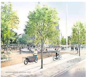
Das sind die Pläne des Büros Grieger Harzer Landschaftsarchitekten aus Berlin für den Steintorplatz. Visualisierung: Grieger Harzer

An den Rändern des Platzes will die Stadt zu sportlichen Aktivitäten einladen. Im Norden des Platzes unweit des Eiscafés soll ein Kinderspielplatz entstehen, etwas weiter versetzt eine Anlage für Skater. „So bleiben die Kinder beim Cafébesuch in Sichtweite der Eltern“, heißt es in den Plänen.