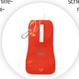
Wiederbefüllbare Flaschen zur Nutzung der kostenlosen Trinkwasserbrunnen in der Stadt werden an Obdachlose verteilt.

im Rahmen des „Homeless-Care-Projektes“ des Tibet-Zentrums Hannover von Mitarbeitenden mithilfe von Lastenfahrern verteilt. Dadurch sollen mehr Menschen erreicht und versorgt werden, auch diejenigen, die keine Tagesaufenthalte nutzen. Darüber hinaus werden die Flaschen über das Hilfesystem in Hannover und die städtische Straßensozialarbeit verteilt. Alle Maßnahmen der Sommerhilfe werden mit Spenden sowie mit Mitteln aus dem städtischen Interventionsfonds finanziert. Mit dem Flugblatt „Tipps bei großer Hitze“ wird aktiv über die Versorgung mit Trinkwasser informiert. Dabei wird auch auf die Möglichkeit hingewiesen, Wasser in öffentlichen Sanitäranlagen zu nutzen. Der Flyer enthält darüber hinaus eine Übersicht der städtischen Trinkwasserbrunnen und medizinische Informationen zum Verhalten bei Hitze der Caritas-Strassenambulanz. Ein weiteres Hilfsangebot hat die Stadt mit der Üstra vereinbart. Obdachlose Menschen dürfen bei hohen Außentemperaturen die Tunnelstationen zur kurzfristigen Abkühlung nutzen. Ein Angebot ohne städtische Beteiligung, das die Landeshauptstadt jedoch ausdrücklich unterstützt, sind die „Social Kioske“ von Hannover 96. Menschen in besonderen sozialen Schwierigkeiten können diese nutzen.