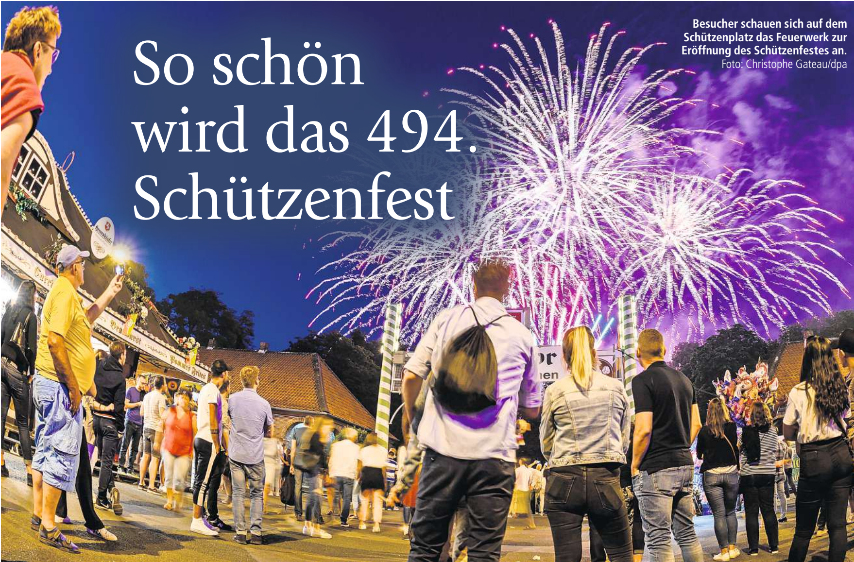
Besucher schauen sich auf dem Schützenplatz das Feuerwerk zur Eröffnung des Schützenfestes an.