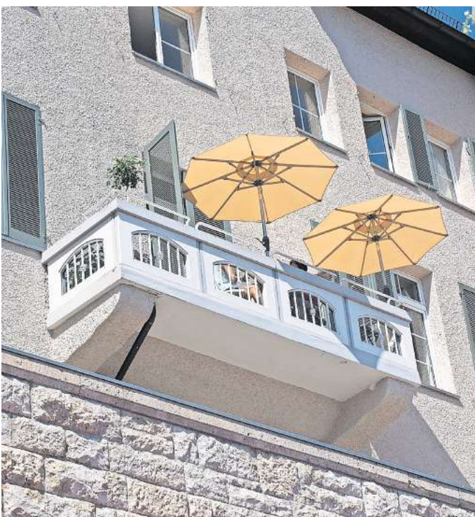
Sonnenschirme auf dem Balkon spenden im Sommer wertvollen Schatten.

Über die Größe hinaus ist das Format wichtig. Es gibt rechteckige, quadratische und runde Sonnenschirme. Das Format ist besonders auf kleinen Balkonen elementar, damit sich alle Sitzflächen im Schatten befinden können. Besonders für die Terrasse eignen sich oft sogenannte Ampelschirme. Weil die Stoffbespannung weit über den Fuß hinausragt, sind Ampelschirme eine deutlich komfortablere Lösung als klassische Mittelstock-