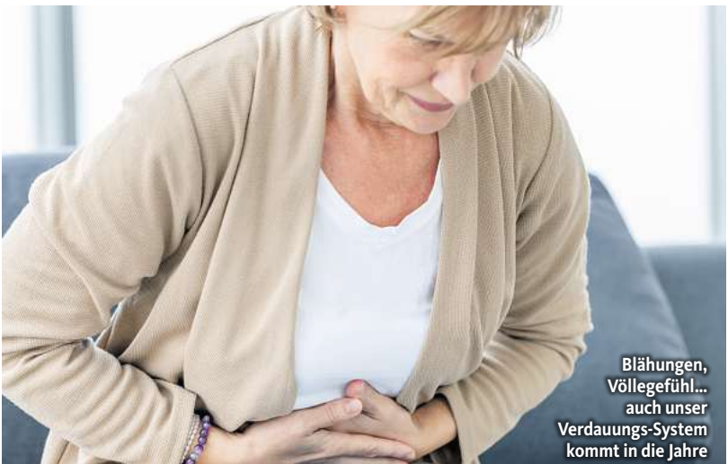
Blähungen, Völlegefühl... auch unser Verdauungs-System kommt in die Jahre