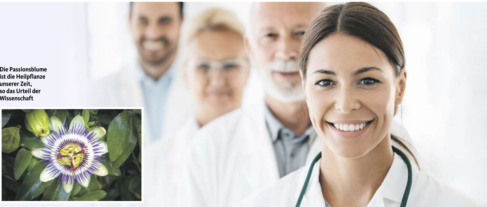
Die Passionsblume ist die Heilpflanze unserer Zeit, so das Urteil der Wissenschaft

Gasteo® Flüssigkeit zum Einnehmen. Wirkstoffe: Gänsefingerkraut, Süßholzwurzel, Angelikawurzel, Benediktenkraut, Wermutkraut, Kamillenblüten. Traditionelles pflanzliches Arzneimittel zur Anwendung bei leichten Verdauungsbeschwerden (z.B. Völlegefühl, Blähungen), sowie leichten krampfartigen Beschwerden im Magen-Darm-Trakt ausschließlich auf Grund langjähriger Anwendung. Enthält 40 Vol.-% Alkohol. (Stand: 11/2022) Zu Risiken und Nebenwirkungen lesen Sie die Packungsbeilage und fragen Sie Ihren Arzt oder Apotheker. Cesra Arzneimittel GmbH & Co. KG, Braumattstraße 20, 76532 Baden-Baden