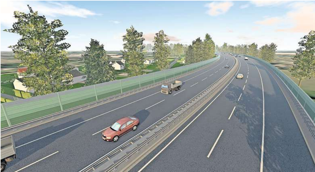
Als Ausweichstrecke für die A2 gedacht: Der Südschnellweg in einer Simulation darüber, wie er eines Tages einmal aussehen soll. Grafik: Felix Riemenschneider/NLSTBV

Weil die Planer jedoch lange die 31 Meter Breite verfolgt hatten, ließen sich die 25 Meter, die laut Richtlinien für mehr als 70.000 Fahrzeuge zulässig wären, letztlich als Kompromiss verkaufen. Weil auch bei einer Verbreiterung auf 25,60 Metern mehrere Hektar Gehölz- und Grünflächen verloren gingen, machten seit 2020 Klimaschutz- und Umweltgruppen dagegen mobil. Sie fordern einen Verzicht auf die Standstreifen, um die Breite auf 21 Meter zu reduzieren. Der Automobilclub ADAC sieht den Südschnellweg als wichtige Entlastungsstrecke für die A2 an. Die 25 Meter Breite seien das „absolut planbare Minimum“, sagt Sprecherin Alexandra Kruse. Auch die Region bestätigte in ihrer Funktion als Planfeststellungsbehörde die Planungen der Landesbehörde. Verkehrsminister Lies äußert sich zurückhaltend: „Eine Debatte um den Eingriff in Natur und Landschaft und vor allem den Aspekt einer Planung mit verstärktem Blick auf die Klimaziele werden wir heute aber sicherlich noch einmal anders führen, als wir das zu Beginn des Verfahrens vor über acht Jahren getan haben.“