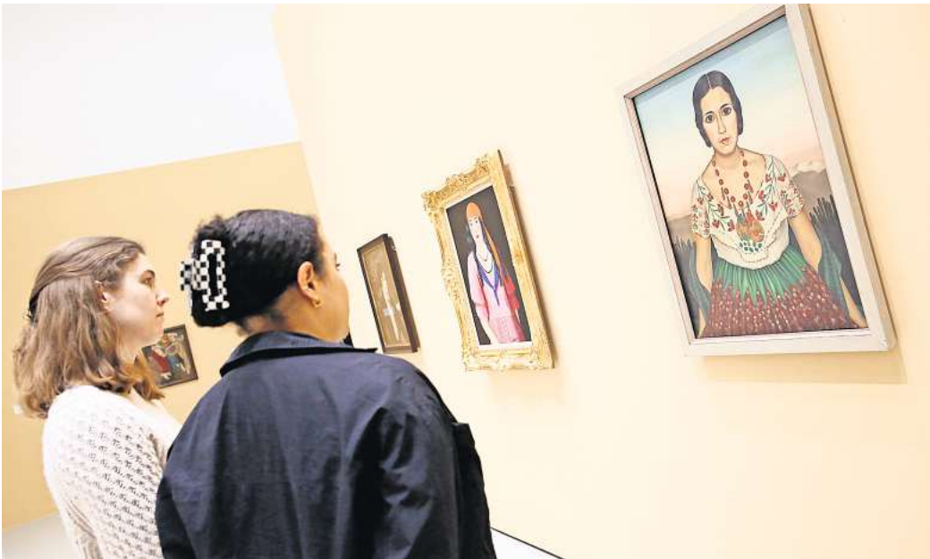
Viele Fragen: Die neue Ausstellung „WelcheModerne?“ im Sprengel Museum.

Der Kunsthistoriker Veit Loers nannte die Kunst der naiven und deswegen als Outsider geltenden Künstler den „Schatten der Avantgarde“, der Tiefe und Kontrast bringt, aber nicht selber schon Avantgarde ist. Das könnte eine Antwort auf die Frage der Ausstellung „Welche Moderne?“ (läuft bis 17. September) sein, die leider nicht sichtbar wird. Nur durch Schatten kommt Tiefe, ohne ihn bleibt alles etwas zu flach. Trotzdem ist die Ausstellung ein Fest des Sehens. Allerdings eben ohne Schatten.