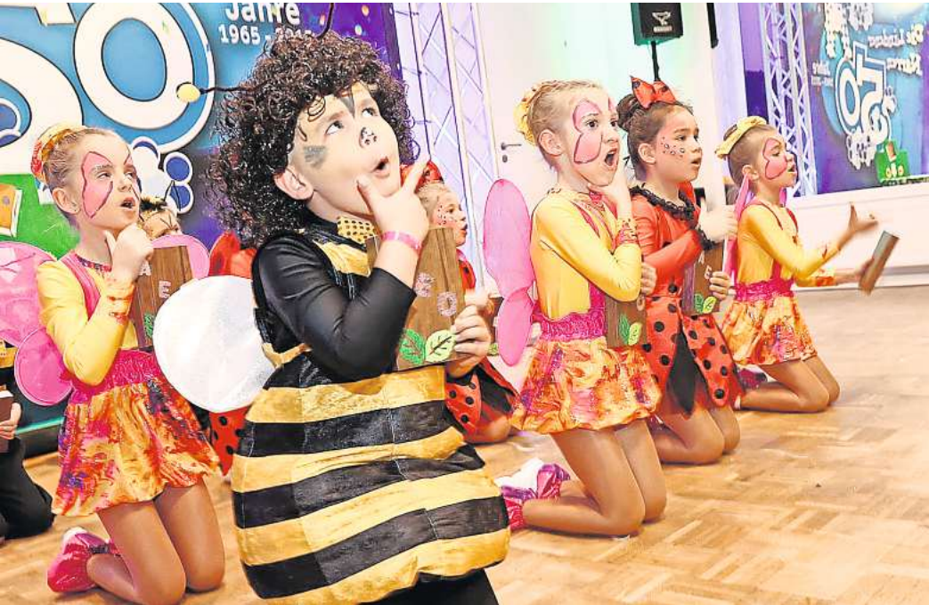
Schautanz mit Botschaft: Die kleinen Lindener Narren mit „Sei mutig und flieg, kleine Hummel“

Am morgigen Sonntag steigt das Neue-Presse-Kinderfest hinter dem Hauptbahnhof