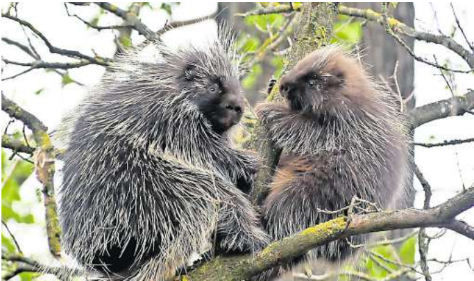
Die Ursons Viktor (links) und Katja erkunden die Kletterbäume in ihrem neuen Reich in Yukon Bay.

„Ihre kräftigen Füße und starken Krallen geben ihnen guten Halt an den Ästen und der Rinde von Bäumen“, erläutert Pressesprecherin Simone Hagenmeyer. „Abgestorbene Eichen in der Mitte des Areals bieten beste Klettermöglichkeiten für die stacheligen Baumbewohner“, so Hagenmeyer. Alte Schaufeln, Siebe, Seile und Fässer ergänzen