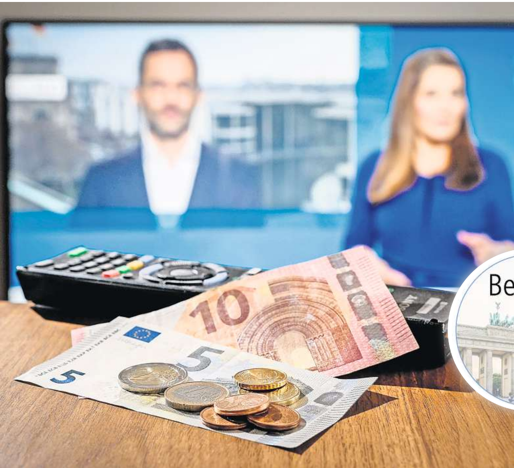
Wollen mehr Geld: ARD, ZDF und Deutschlandradio hatten Ende April ihren Finanzbedarf für die Jahre 2025 bis 2028 bei der unabhängigen Kommission KEF angemeldet.

ARD, ZDF und Deutschlandradio hatten Ende April ihren Finanzbedarf für die Jahre 2025 bis 2028 bei der unabhängigen