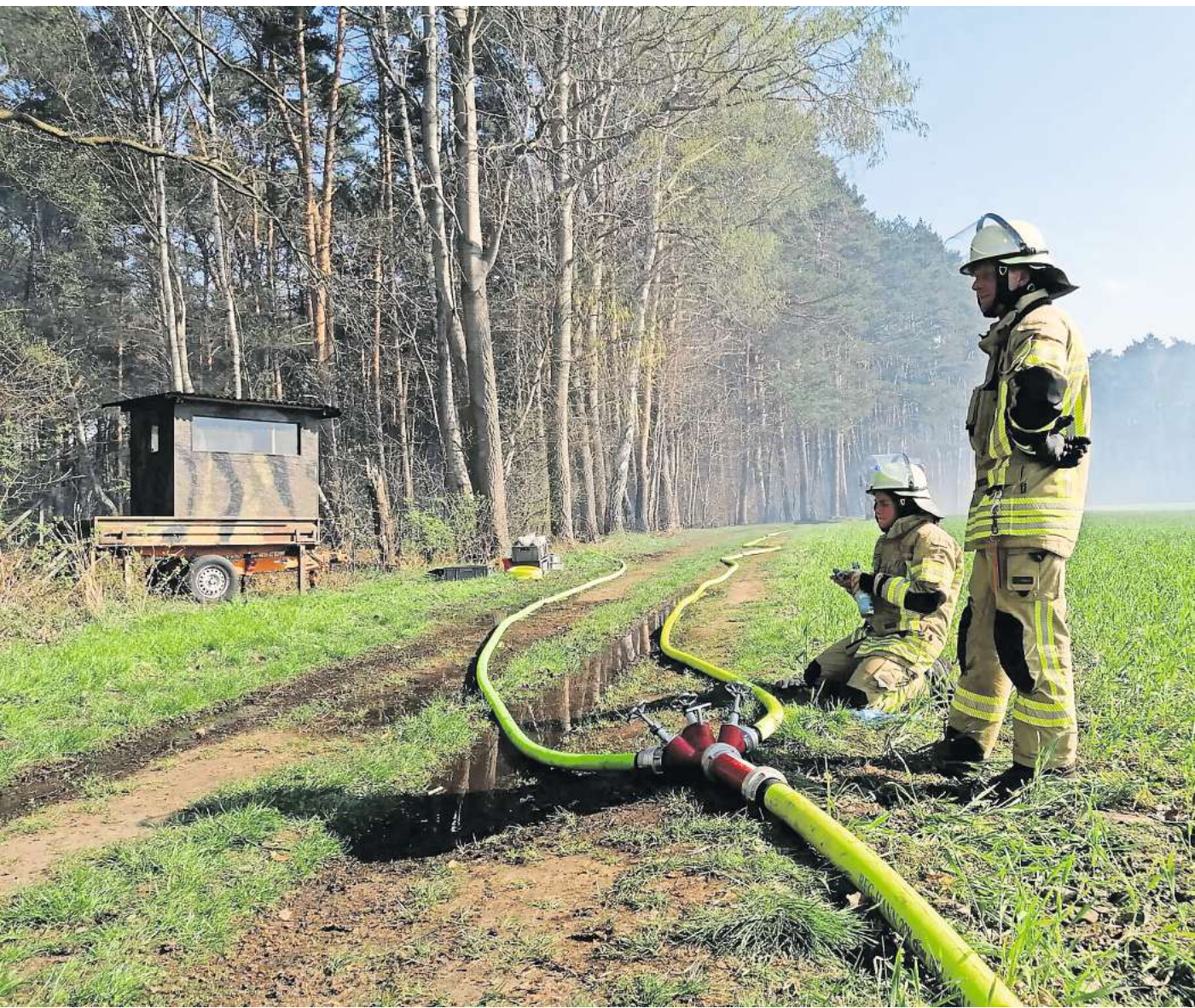
Grosseinsatz: Erst vor wenigen Wochen musste die Feuerwehr einen Waldbrand bei Neustadt löschen.