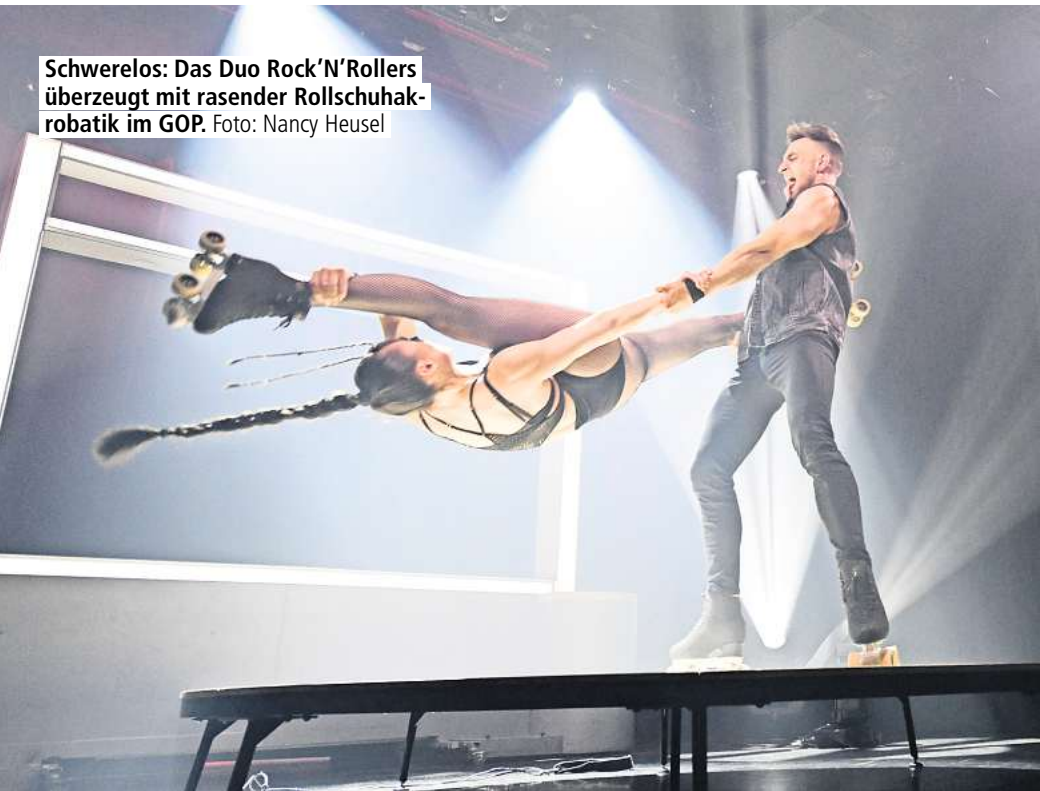
Schwerelos: Das Duo Rock’N’Rollers überzeugt mit rasender Rollschuhakrobatik im GOP.

NEUES GOP-PROGRAMM mit Magier Desimo und vielen Bewegungskünstlern läuft bis 2. Juli