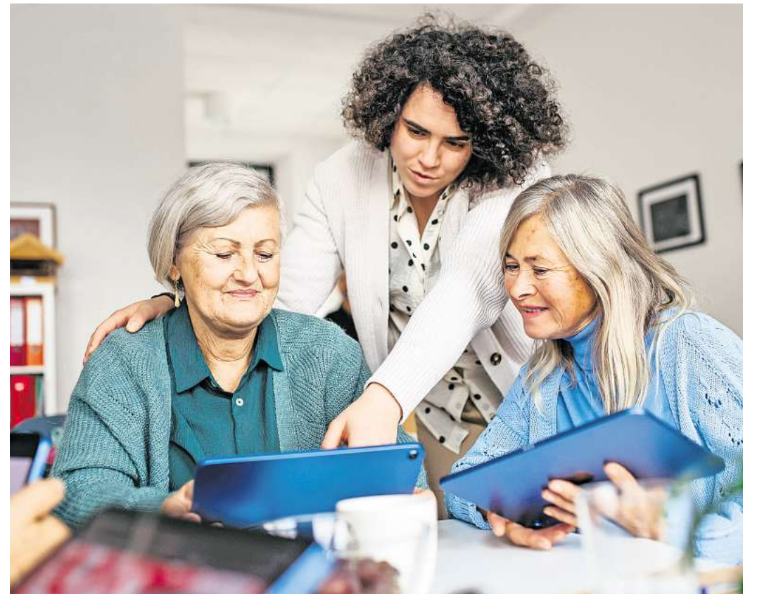
Merken und erinnern: Wer sich regelmäßig mit neuen Aufgaben und Situationen beschäftigt und dabei trainiert, die neuen Informationen gezielt zu speichern, hält sein Gehirn flexibel.

Das heißt: „Je mehr wir unser Arbeitsgedächtnis trainieren, desto besser klappt das Merken und Erinnern. Denn das Gehirn bleibt so flexibel“, sagt der Fachmann. Die richtige Methode kann dabei helfen.