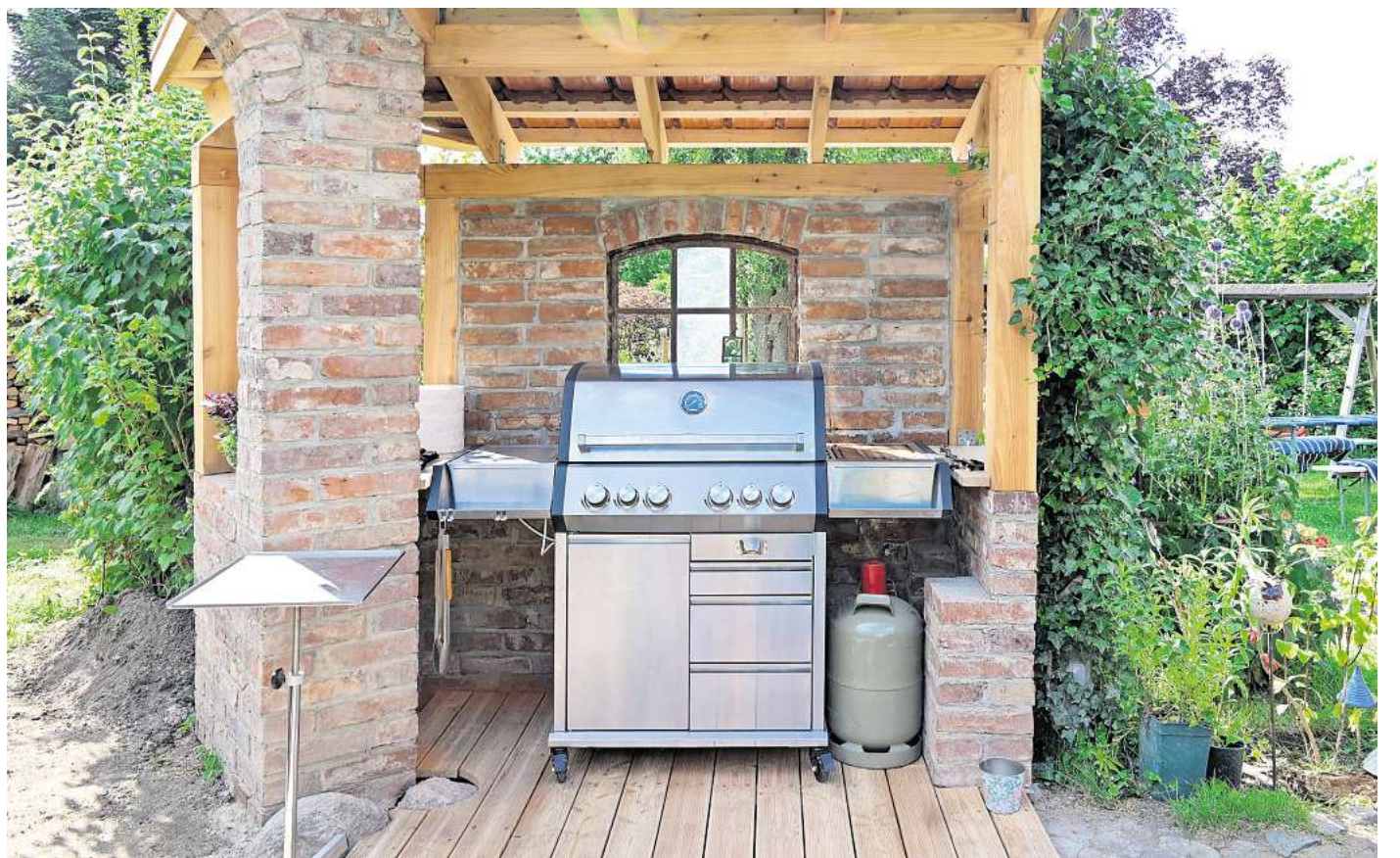
Der Gasgrill: Er ist das Herzstück vieler Outdoor-Küchen.

Andere Trends sieht Schaaf in ihrem Alltag deutlich seltener. „Nachhaltiges und klimafestes