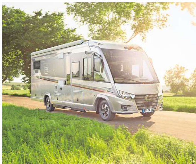
Bietet viel Komfort: Der Carthago e-line von Fiat.

dem Modelljahr 2027 folgt im Juni 2026. Die Unterschrift ist gesetzt. Es geht los.