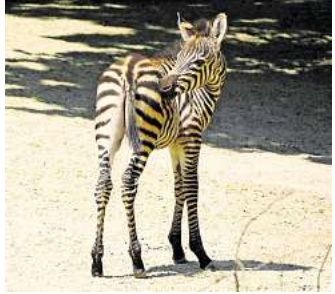
Nachwuchs im Zoo Hannover: Das kleine Zebra Nick erkundet das Gehege.

Nick wog bei der Geburt 30 Kilogramm. Bereits nach wenigen Minuten stand er auf eigenen Beinen und trank nach rund einer Stunde erstmals bei der Mutter. Mit etwa einem Jahr erreicht ein junges Zebra seine endgültige Größe, nimmt jedoch bis zum Alter von rund drei Jahren weiter an Gewicht zu, heißt es vom Zoo. Von allen (Wild-)Pferdearten ist das Steppenzebra am weitesten verbreitet. Trotzdem wird die Art von der Weltnaturschutzunion IUCN als „potenziell gefährdet“ eingestuft.