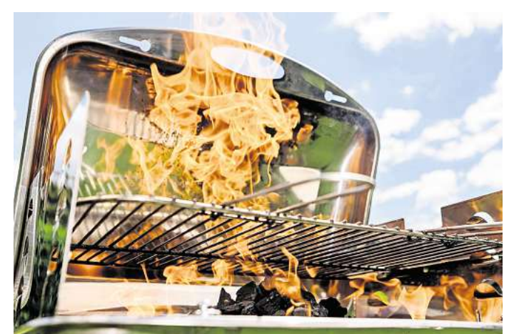
Finger weg: Spiritus und andere flüssige Brandbeschleuniger können hohe Flammen verursachen.

Kleinere Verbrennungen sollten man kurzzeitig kühlen, rät Hirche. Kaltes Wasser hilft, die