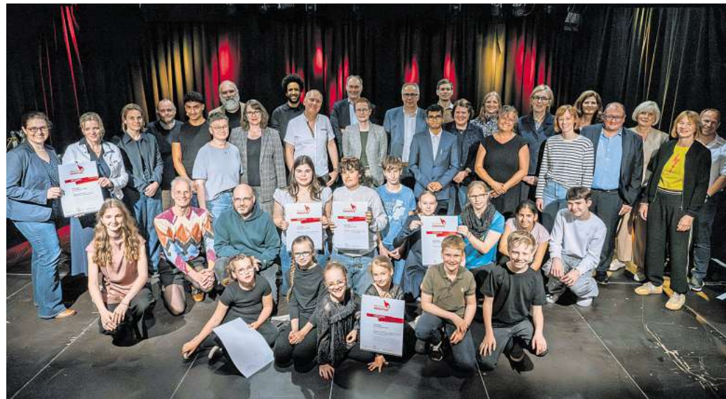
Preisverleihung im Kulturzentrum Pavillon: Mit der Vergabe des „KulturKometen“ zeichnen die Stiftung Kulturregion Hannover und die TUI Stiftung besonderes Engagement von Schulen der Region Hannover im Kulturbereich aus.