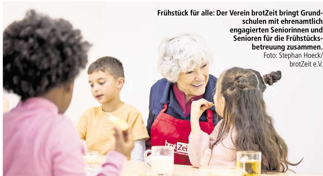
Frühstück für alle: Der Verein brotZeit bringt Grundschulen mit ehrenamtlich engagierten Seniorinnen und Senioren für die Frühstücksbetreuung zusammen.

Oberbürgermeister Belit Onay sieht darin einen direkten Beitrag zu mehr Bildungsgerechtigkeit. „Ein gesundes Frühstück ist eine wichtige Grundlage für erfolgreiches Lernen. Kinder, die hungrig in die Schule kommen, haben schlechtere Voraussetzungen, dem Unterricht zu folgen und ihr Potenzial zu entfalten. Deshalb unterstützen wir Angebote, die unmittelbar dort wirken, wo sie gebraucht werden – direkt an