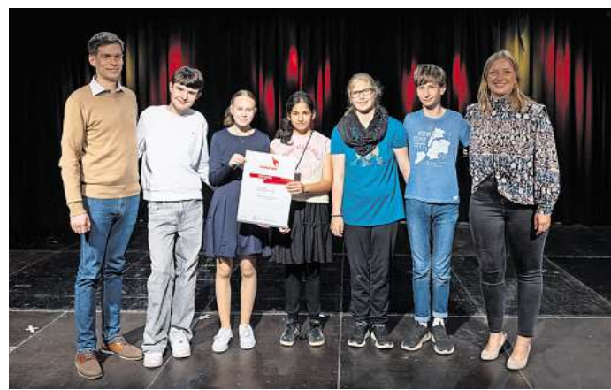
Preisträgerprojekt der Hartwig-Claußen-Schule: die neue Theater-AG.