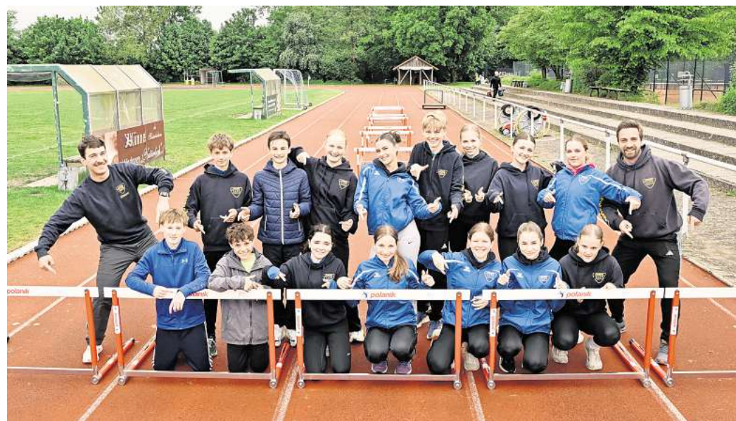
Endlich gut aufgestellt: Die Nachwuchs-Leichtathleten der TuS Wettbergen freuen sich über ihre neuen Hürden.

Und während Gibadlo ein paar Meter weiter zu den Speeren geht, übt der Rest der Trainingsgruppe weiter fleißig für weitere große Hürden-Wettkämpfe.