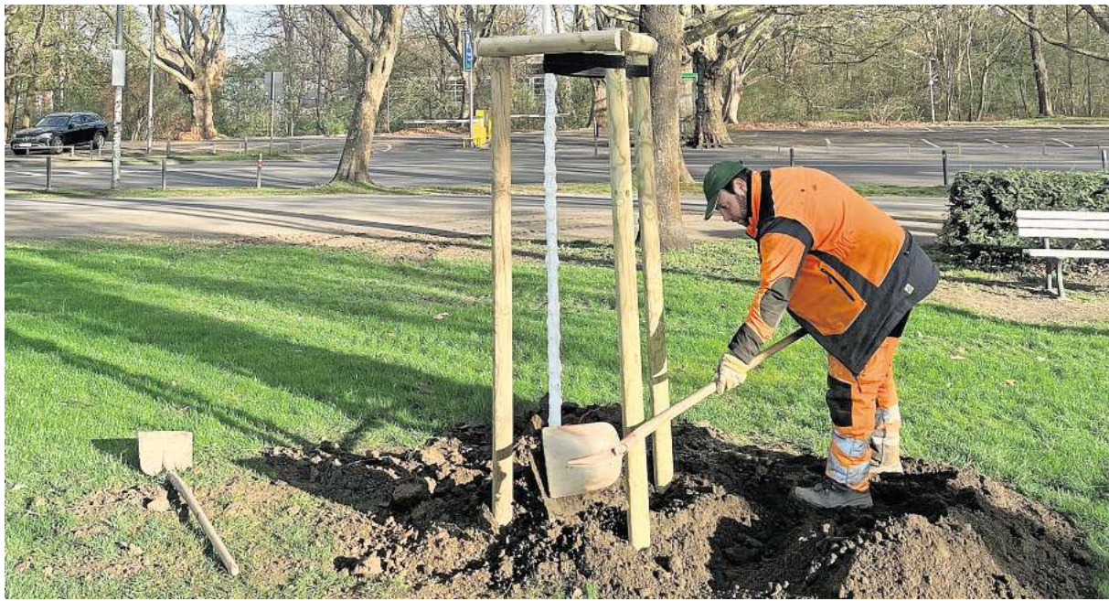
Am Arthur-Menge-Ufer wird ein Jubiläumsbaum gepflanzt.