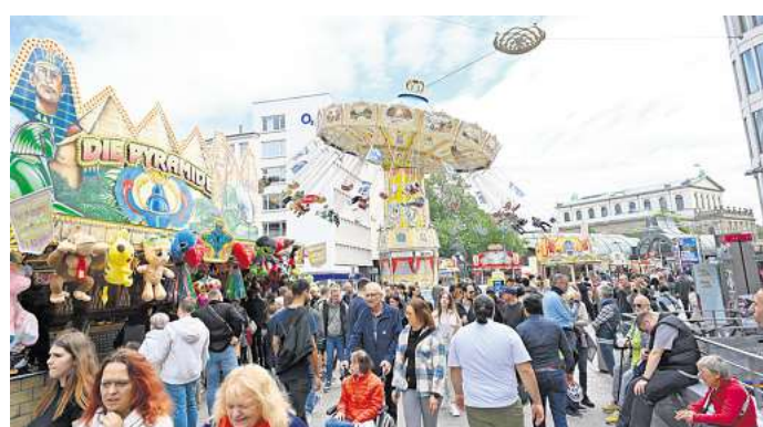
Autoscooter an der Oper, Wellenflieger am Kröpcke: Es ist wieder Kirmes mitten in der Innenstadt.

HANNOVER. Die Fahrgeschäfte drehen sich wieder: Die City-Kirmes ist zurück. Nach der Premiere im vergangenen Jahr bringt die Arbeitsgemeinschaft für Volksfeste Hannover (AGVH) das bunte Innenstadtfest erneut mitten ins Herz der Landeshauptstadt. Seit zwei Tagen und noch bis 17. Mai verwandeln sich Georgstraße, Kröpcke und erstmals auch der Opernplatz in eine große Jahrmarktsmeile zwischen Einkaufsbummel, Fahrspaß und Budenzauber.