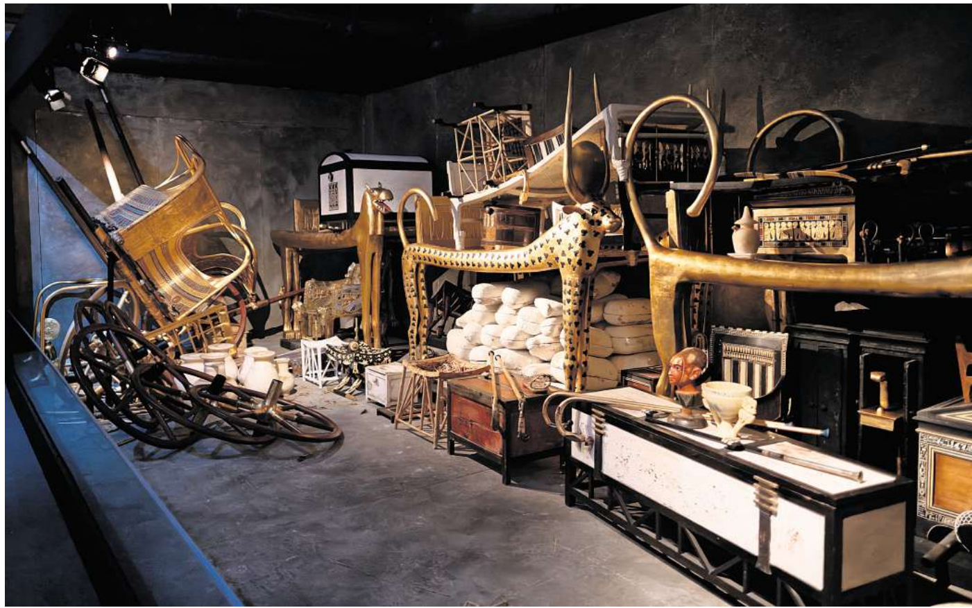
Über 800 Repliken: Das Herzstück der Ausstellung ist die Nachbildung der Grabkammern, wie Howard Carter sie 1922 entdeckte.