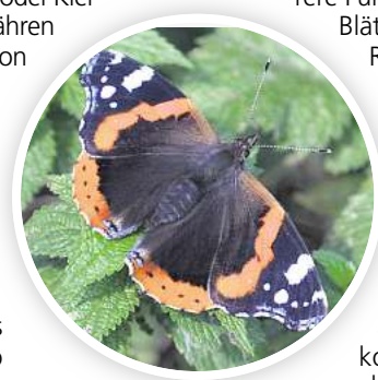
Mehr als Unkraut: Brennnesseln sind eine wichtige Nahrungsquelle für Admiral-Raupen.

Fenchel: Er erfüllt gleich mehrere Funktionen – seine Blätter dienen den Raupen des Schwalbenschwanzes als Nahrung. Den Falter sieht man hingegen an Disteln, Skabiosen oder am Natternkopf. Auch Fenchelblüten locken Insekten an – allerdings eher Wildbienen, Käfer und Fliegen als Schmetterlinge.