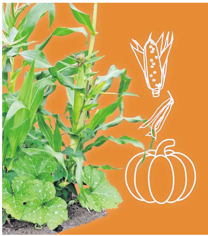
Ideal in einem Beet: Hinter den „Drei Schwestern“ verstecken sich die drei Gemüsepflanzen Mais, Bohnen und Kürbis. MONTAGE: PATAN/RND; FOTO: WILDLIFE/PICTURE ALLIANCE