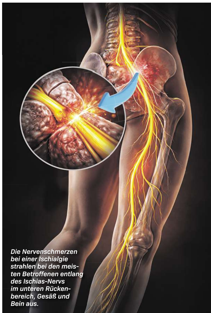
Die Nervenschmerzen bei einer Ischialgie strahlen bei den meisten Betroffenen entlang des Ischias-Nervs im unteren Rückenbereich, Gesäß und Bein aus.

Langes Sitzen am Schreibtisch oder im Auto, schweres Heben, falsches Bücken – und schon ist er da! Ein stechender, brennender Schmerz im unteren Rücken, der über den Po bis zum Fuß ausstrahlen kann. Die einen klagten zudem über Taubheitsgefühle oder ein Kribbeln an den betroffenen Stellen. Andere wiederum fühlen sich sogar wie vom „Strom durchflossen“. Hinter den Schmerzen rund ums Gesäß steckt meist der Ischias-Nerv, der so dick wie unser Daumen ist und sich vom Rücken bis zum Knie verzweigt. Wird Druck auf den Ischias-Nerv ausgeübt, z. B. durch falsche Bewegungen oder Verspannungen, kann dieser gequetscht oder gereizt wer-