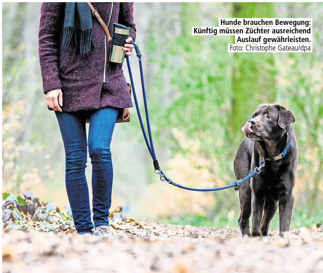
Hunde brauchen Bewegung: Künftig müssen Züchter ausreichend Auslauf gewährleisten.

Für die meisten Tierhalter dürften die neuen Regeln aber erst beim nächsten Tier relevant werden: Für Hundehalter tritt das Gesetz in zehn Jahren in Kraft, für Katzenhalter erst in 15 Jahren. Für Züchter gilt dagegen eine Übergangsfrist von nur vier