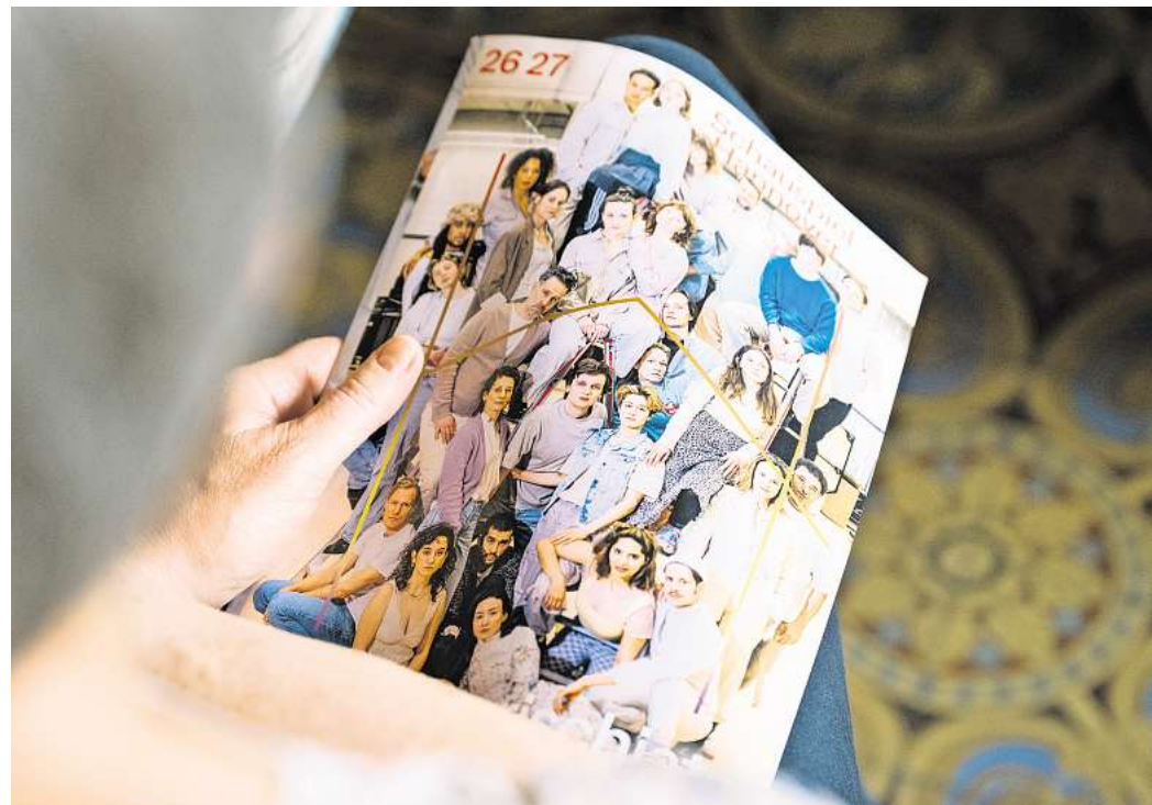
19 Premieren sind für die neue Spielzeit angekündigt, darunter sieben Uraufführungen und eine deutsche Erstaufführung.