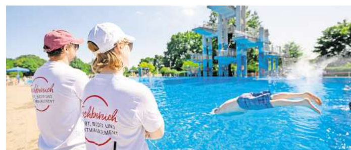
Werden vor allem im Sommer gebraucht: Rettungsschwimmer im städtischen Lister Bad.

„Wir können auch noch im Laufe des Sommers einstellen“, berichtet Bernath. Benötigt würden zusätzliche Kräfte am Be-