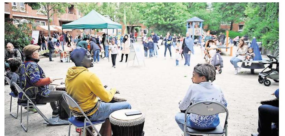
Mit Trommeln und Gemeinschaftssinn: Familienfest auf dem Franzplatz.

Im Mittelpunkt stehen bewusst niedrigschwellige Angebote. Statt großer Bühnen oder zentraler Veranstaltungen verteilen sich die Aktionen über den gesamten Stadtteil. Nachbarn sollen spontan zusammenkommen, neue Kontakte knüpfen und bekannte Orte im Viertel neu entdecken können. Zu den größten Veranstaltungen zählt