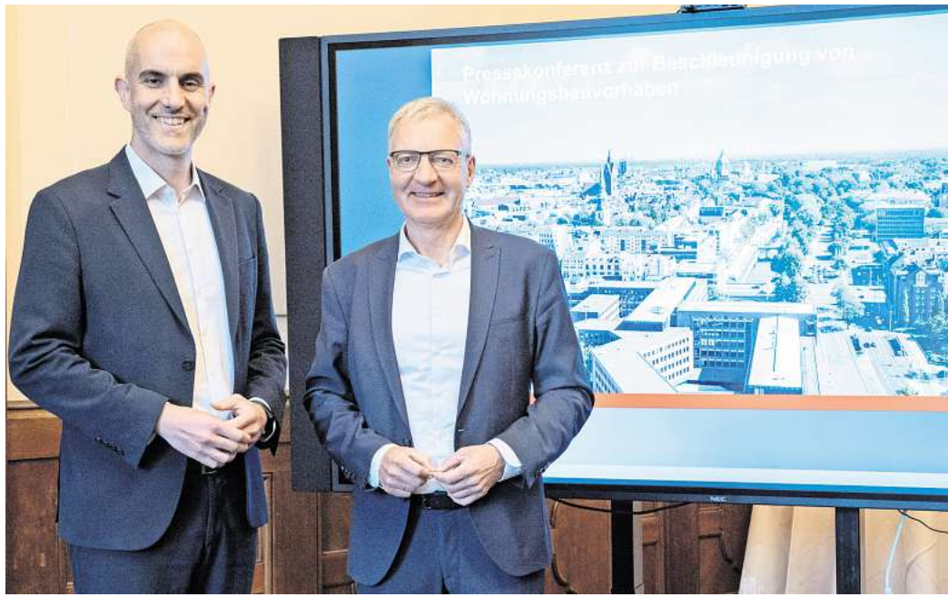
Oberbürgermeister Belit Onay (links) und Stadtbaurat Thomas Vielhaber haben den Bau-Turbo für Hannover vorgestellt.

Oberbürgermeister Belit Onay spricht von einem notwendigen Schritt angesichts der angespannten Lage auf dem Wohnungsmarkt. „Die Lage auf dem Wohnungsmarkt erfordert entschlossenes Handeln. Mit dem Bau-Turbo schaffen wir die Voraussetzungen, damit neue Wohnungen schneller gebaut werden können“, sagt Onay: „Gleichzeitig stellen wir sicher, dass zentrale Anforderungen wie bezahlbarer Wohnraum, soziale Infrastruktur und städtebauliche