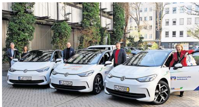
Im Rahmen des Sozialprojekts VRmobil wurden drei Initiativen aus der Region mit Fahrzeugen ausgestattet.