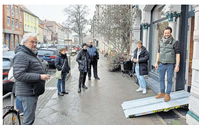
Die Rampen werden mit dem Fahrradanhänger ausgeliefert und ermöglichen einen barrierefreien Zugang zu Geschäften.

Hinter dem Projekt stehen der Verein Deisterkiez, die Lebenshilfe Hannover sowie das Quartiersmanagement der hanova WOHNEN GmbH. Gemeinsam stellen sie zehn weitere mobile Rampen sowie audiovisuelle Klingelsysteme zur Verfügung. Damit sollen insbesondere Menschen mit eingeschränkter Mobilität oder Sehbeeinträchtigungen leichter Zugang zu Geschäften erhalten. Die Teilnahme ist