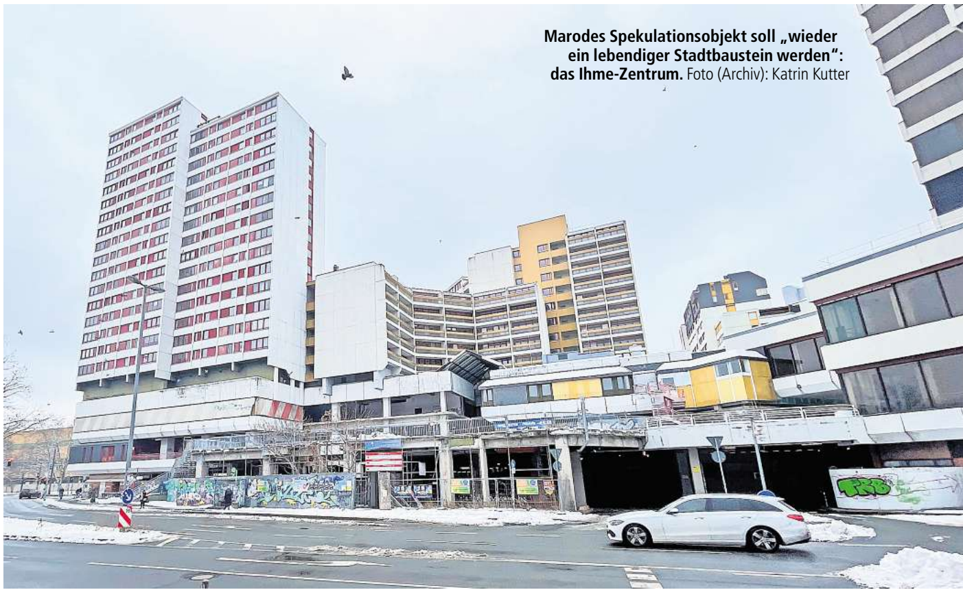
Marodes Spekulationsobjekt soll „wieder ein lebendiger Stadtbaustein werden“: das Ihme-Zentrum.