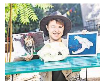
Zoo-Scouts vermitteln Wissen rund um Tiere.

Der Eintritt zum Familienfest ist im regulären Zooeintritt enthalten, Jahreskarten gelten ebenfalls. Einige Mitmachangebote werden gegen einen Selbstkostenbeitrag angeboten. RED