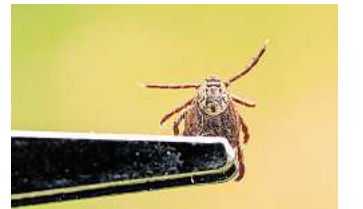
Parasitäre Zeitgenossen: Zecken können Krankheiten übertragen und sollten möglichst zügig entfernt werden.

► FSME-Impfschutz checken: Wer sich in Baden-Württemberg, Bayern, dem südlichen Hessen, dem südöstlichen Thüringen, Sachsen und dem südöstlichen Brandenburg aufhält, also in Regionen mit gehäuftem FSME-Infektionen bei Zecken, dem empfiehlt die Ständige Impfkommission eine FSME-Schutzimpfung.