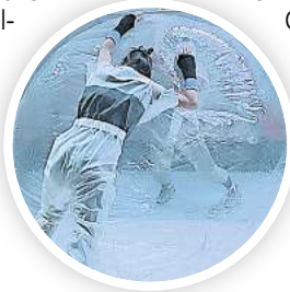
Das tilted collective zeigt die Performance „Couldn't care less“.

HANNOVER. Zwischen Tanz, Objekttheater und feministischer Performance bewegt sich die neue Produktion „Couldn't care less“ des Künstlerinnen-Netzwerks tilted collective.