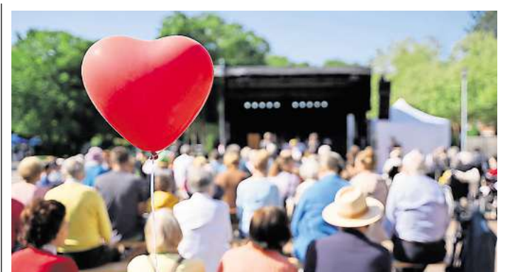
Das Stephansstift lädt zum Jahresfest ein.