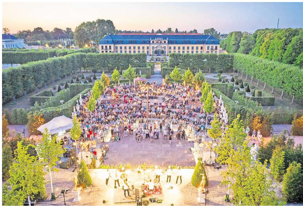
Sommernächte im Gartentheater Herrenhausen: Der Vorverkauf hat begonnen.

Mit OTTOLIEN steht am Sonnabend, 8. August, zudem ein Heimspiel an: Das hannoversche Brüderduo verbindet Indie-Pop mit Rap-Elementen, komplexen Wortbildern und popkulturellen Referenzen. Nach Festivalauftritten beim Reeperbahn Festival oder Southside spielen sie nun ihr erstes großes Open Air in der Heimatstadt.