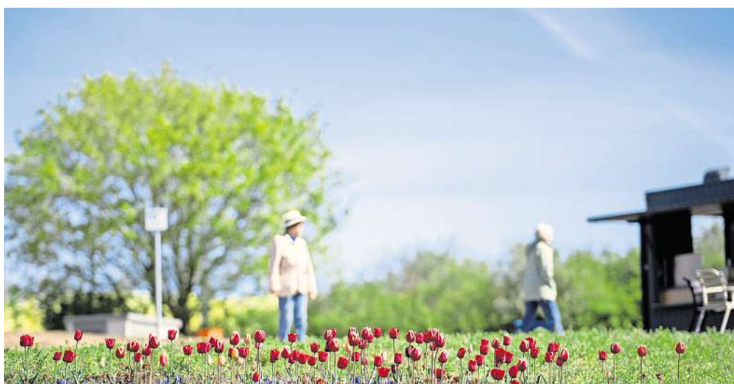
Da blüht was: Die Landesgartenschau läuft bis zum 18. Oktober 2026.

Das Ausstellungsgelände im historischen Kurpark ist von nun an jeden Tag zwischen 10 und 19 Uhr geöffnet. Eine Tageskarte kostet für Erwachsene 24 Euro, für Jugendliche und junge Er-